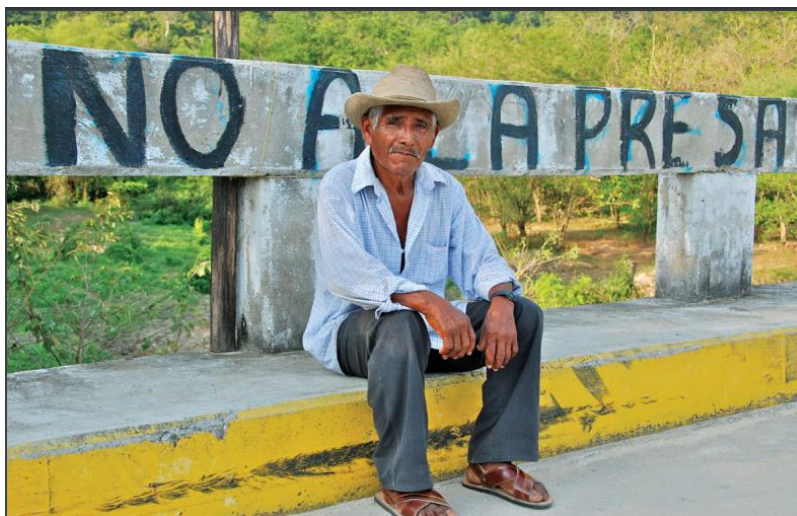
Figura 3. Fotografía de habitante de las comunidades afectadas.

La resistencia se origina en el conflicto socioambiental que surge, pero abarca la lucha por la supervivencia de los pueblos, comunidades, localidades y su modo de vida como base para la formulación de estrategias de los actores sociales (figura 3).