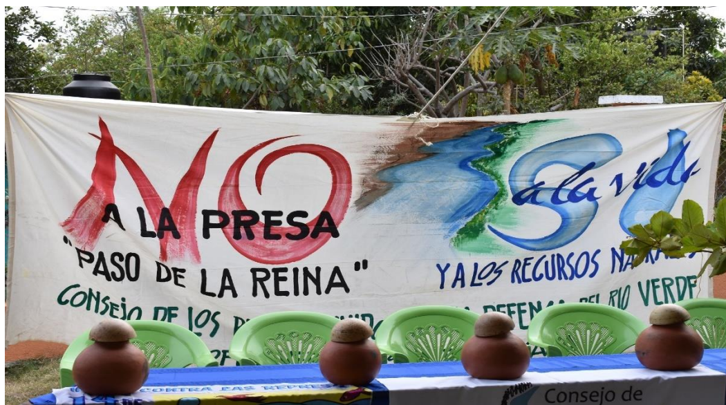
Figura 8. Fotografía No a la Presa “Paso de la Reina”, Sí a la vida y a los recursos naturales.

El Consejo de Pueblos Unidos por la Defensa del Río Verde (COPUDEVER) es un ejemplo de resistencia en comunidades y pueblos indígenas, ya que lucha y defiende su territorio, la vida y el río Verde (véase figura 8), se caracteriza por no desistir y exigir que se respeten los derechos de los pueblos indígenas, y que tengan acceso a la información, cuando existan amenazas que pongan en riesgo su territorio y la vida.