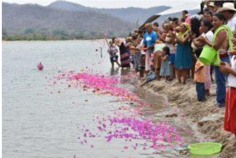
Figura 6. Fotografía celebrando el día del río Verde, Fuente: Obtenida de www.pasodelareina.org , 2022