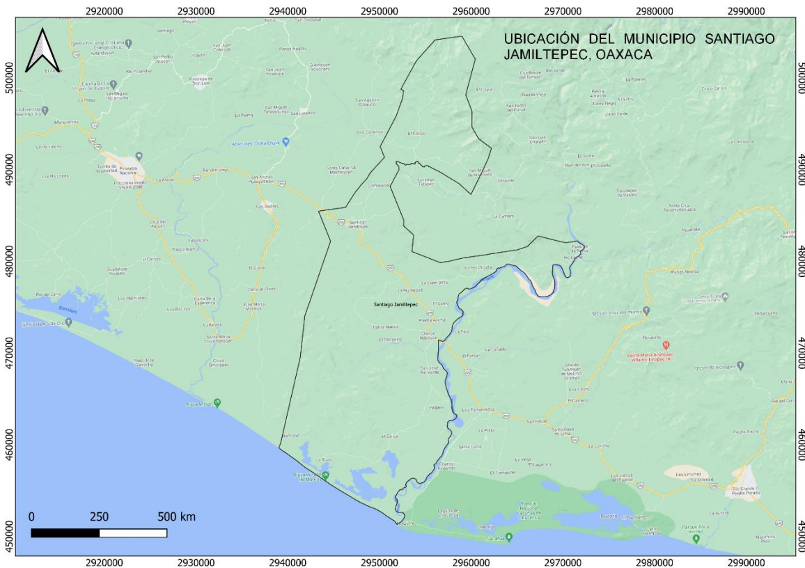
Figura 1. Mapa de la ubicación del municipio de Santiago Jamiltepec, Oaxaca.

El municipio de Santiago Jamiltepec pertenece al Distrito de Jamiltepec, se localiza en la región costa del estado de Oaxaca, México ( Figura 1 ). Las coordenadas geográficas son: 16° 17' Latitud Norte y 97° 49' Longitud Oeste, a una altitud de 440 metros sobre el nivel del mar. Ocupa una superficie terrestre de 670.06 kilómetros cuadrados aproximadamente. Se encuentra en la provincia fisiográfica Sierra Madre del Sur, en la subprovincia Costa del sur y Cordillera costera del sur. Pertenece a la región hidrológica Costa Chica – Río Verde y Costa de Oaxaca. Cuenta con las cuencas Río Atoyac, Río La Arena y otros. La precipitación va de los 1000 a los 2500 mm al año.