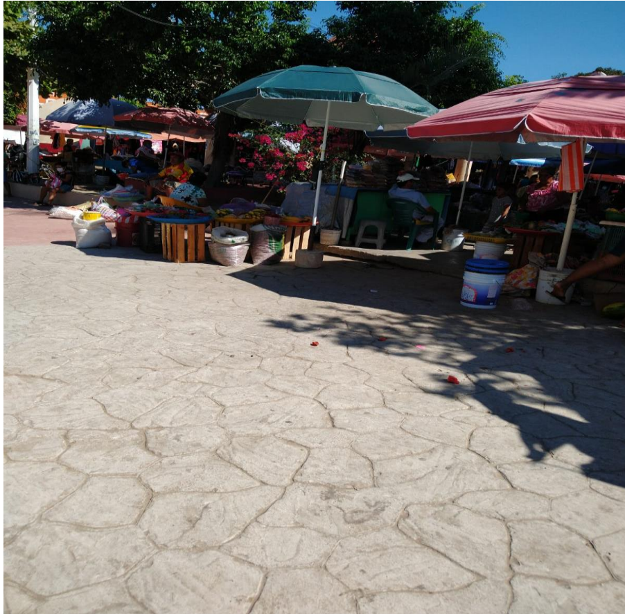
Figura 4. Tianguis a lado de la explanada de la cabecera municipal. Foto tomada durante el trabajo de campo, 2022