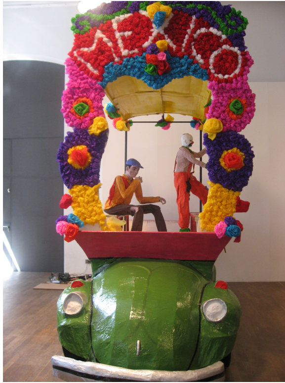
Ultima Hora. Bocho Trajinera.