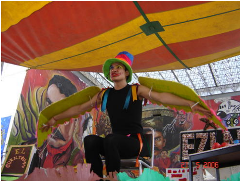
JADEvolucion-arte. El Cuentones.