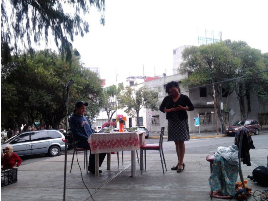
JADEvolución-arte. Sabes voy a tener un hijo