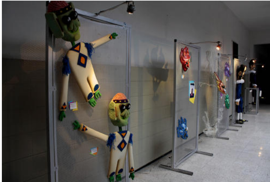
JAEvolución-arte. Títeres y Máscaras