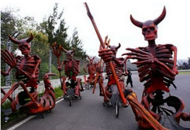
Ultima Hora. Diablos. Desfile del Bicentenario, 2010