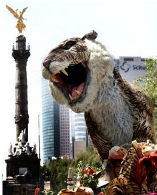
Ultima Hora. Desfile Año Nuevo Chino, 2010