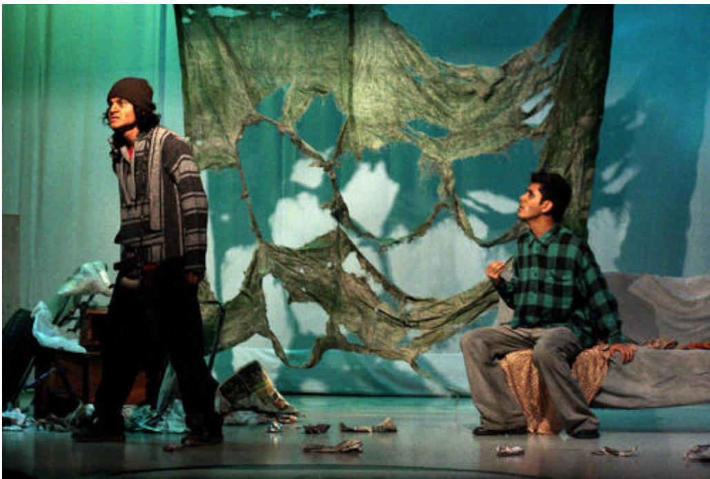
JAEvolucion-arte. De la Calle