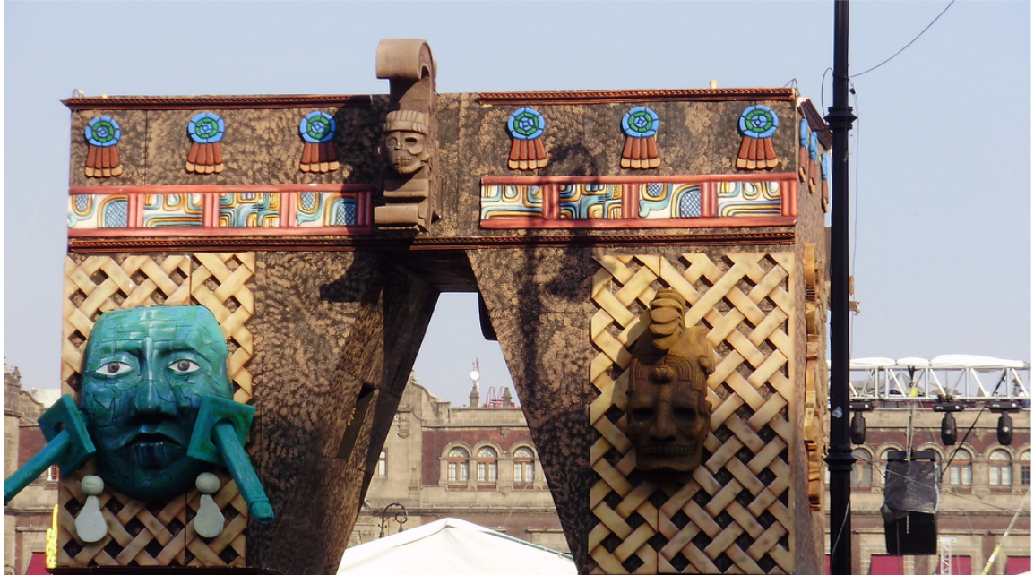
Colectivo Ultima Hora. Arco Maya, Ofrenda de Muertos, Zócalo Distrito Federal, 2009