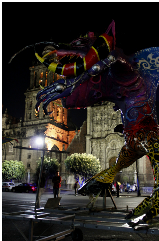
Ultima Hora. Alebrije Monumental, 2010.