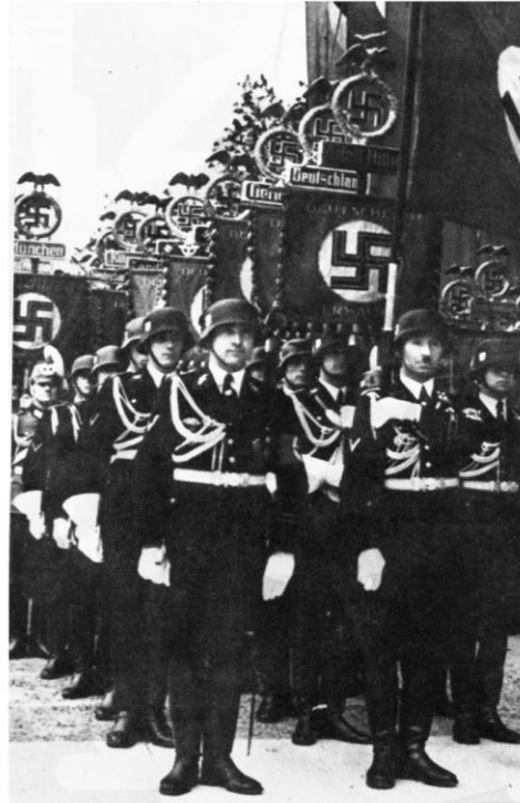
Miembros de las SS, organización paramilitar del Partido Nazi, en Alemania