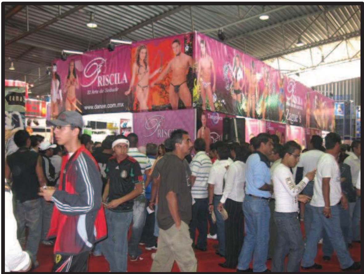
Ilustración 32. Stand comercial de la tienda de lencería Priscila. Expo-sexo Sex & Entertainment edición 2010.