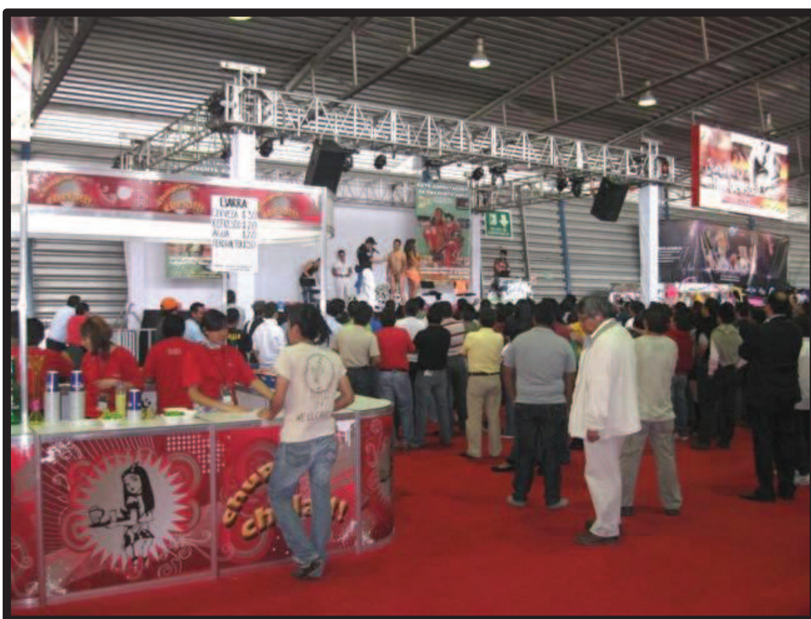
Ilustración 21. Locales comerciales alrededor del stand de la Editorial Matlarock. A la izquierda un local de venta de cervezas, a la derecha en el fondo el escenario de una empresa privada que se dedica a realizar espectáculos en vivo de carácter sexual, animadores. Expo-sexo Sex & Entertainment edición 2010.

detienen acumulándose poco a poco hasta constituir una multitud, y en muchas ocasiones sólo es por la curiosidad de saber por qué hay tanta gente en determinado lugar, se mimetizan. Aunado a ello se podría decir que el mismo producto de esta editorial, un video pornográfico – amateur y/o casero mexicano– tiene mucha influencia para las ventas de otros establecimientos contiguos. Esto, debido a que los locales ubicados a los costados del de la Editorial Matlarock, a pesar de tener ventas mínimas, las tienen a raíz de que el público se detiene en ese espacio.