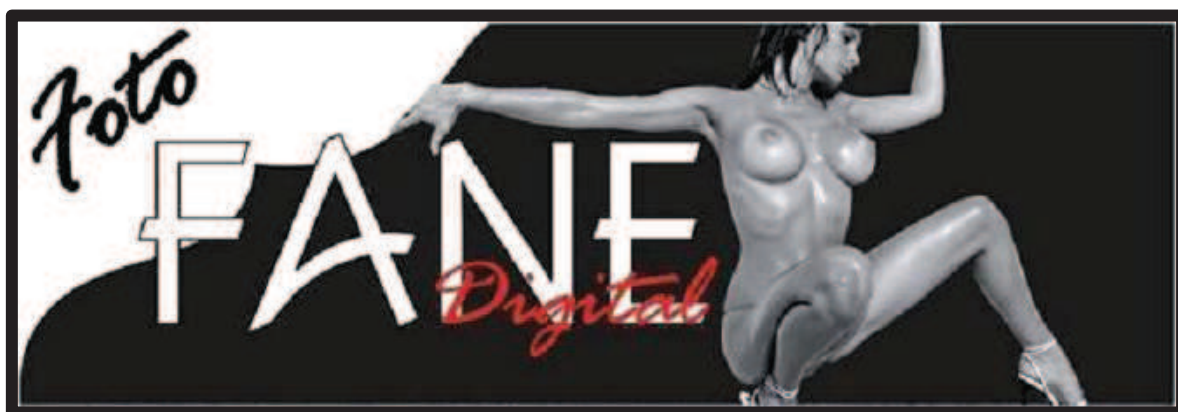
Ilustración 12. Logotipo del estudio fotográfico “Foto Fane”.