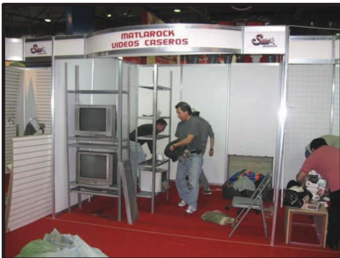
Ilustración 16. Colocación del stand comercial un día antes de la inauguración de la expo-sexo Sex & Entertainment edición 2010.

con las portadas de los números de la mini-publicación impresas, por lo que se debe continuar con la actividad al día siguiente. Para ello, se cita al personal –o por lo menos a un sector de éste– al día siguiente un par de horas antes de que se abran las puertas al público para tener todo en orden. El horario para el público en la expo-sexo Sex & Entertainment es de las 14:00 a las 22:00 horas. Los expositores deben estar en las instalaciones del Palacio de los Deportes una hora antes, es decir a las 13:00 horas. Esto debido a que los organizadores del evento han determinado que los locales comerciales deben estar en funcionamiento en el momento en que se abren las puertas al público. En caso contrario, se les aplica una multa de mil pesos. De igual forma, deben dejar todo en orden después del momento en que se cierran las puertas, por lo que muchos de ellos permanecen en el lugar pasadas las 23:00 horas.