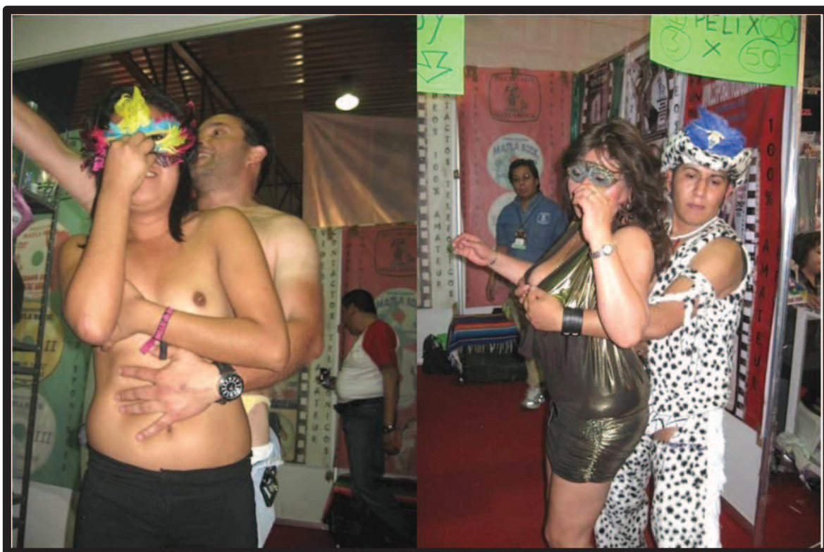
Ilustración 41. Casting en vivo realizado por dos mujeres para la Editorial Matlarock en la expo-sexo Sex & Entertainment edición 2010. Puede observarse que ambas tienen el rostro cubierto con un antifaz y que el elemento significativo, y alrededor del cual se desarrolla la acción, son sus senos.

Lo mismo puede mencionarse en lo que respecta a las personas que deciden participar de este tipo de actividad. Héctor Reyes pregunta al público en general si alguien quiere pasar a hacer el casting. Lo significativo es que no importa quién sea, siempre y cuando pueda lograr la erección del pene, un fragmento corporal. Igual relación encontramos en lo que se refiere a las mujeres, que en caso de animarse a hacer el casting se les pide que tengan actitud, lo que puede traducirse como la capacidad de mostrar sus senos al descubierto. Es irrelevante, de nueva cuenta, quién sea, pues los senos son los protagonistas principales.