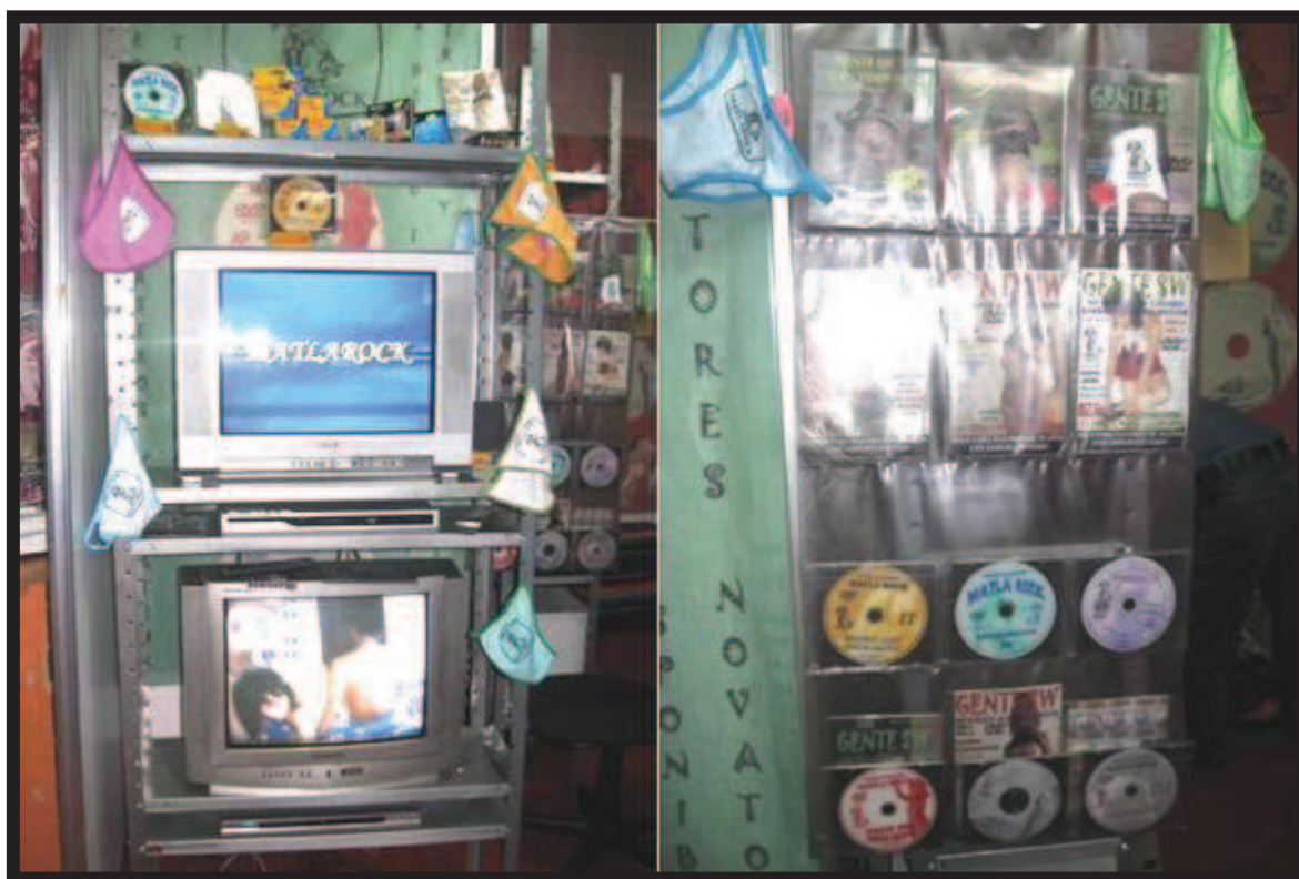
Ilustración 18. Exposición de los productos de la Editorial Matlarock al público en la expo-sexo Sex & Entertainment edición 2010.

El stand de la Editorial Matlarock se ha ubicado casi siempre en el segundo hangar del lado derecho de la puerta de acceso principal. Éste tiene un dimensión de tres metros de largo y dos de ancho aproximadamente. En este reducido espacio se coloca, del lado derecho, un estante que da hacia el exterior donde se acondicionan los televisores y los reproductores de DVD's mediante los cuales se transmite continuamente el contenido de los videos de la editorial –ya sea aquellos correspondientes a los números de la mini-publicación o aquellos que se han grabado de los casting realizados a los aspirantes a actor pornográfico– para que el público consumidor pueda observarlos y se genere un interés en adquirirlos, comprarlos.