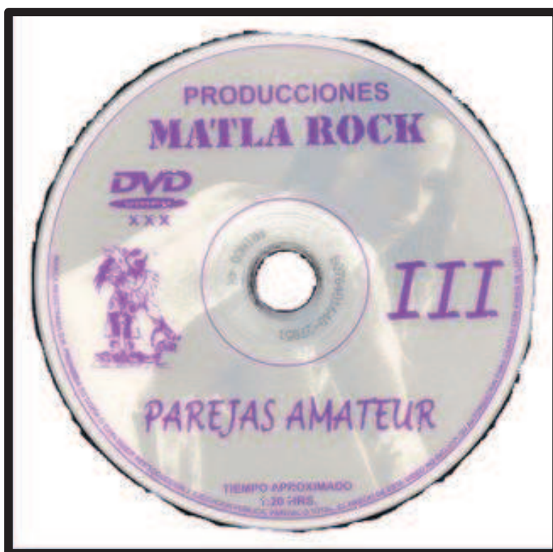
Ilustración 29. Presentación comercial de la colección de videos caseros de la Editorial Matlarock.