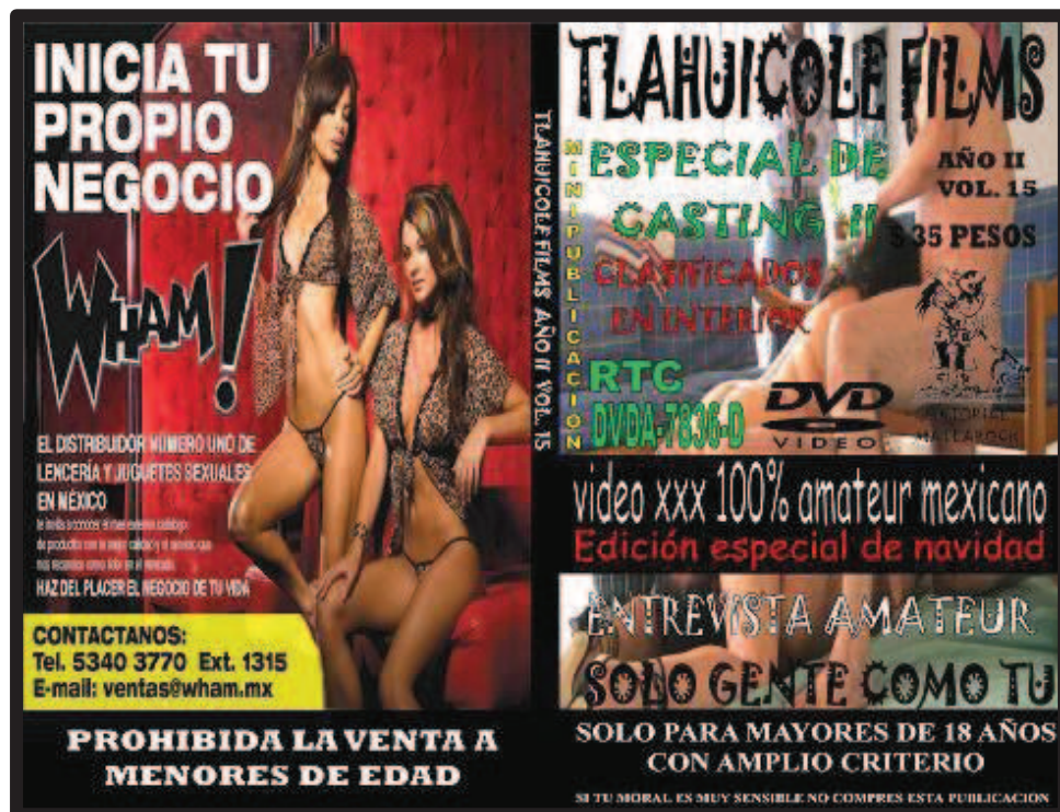
Ilustración 15. Presentación comercial de la mini-publicación “Tlahuicole Films” de la Editorial Matlarock.