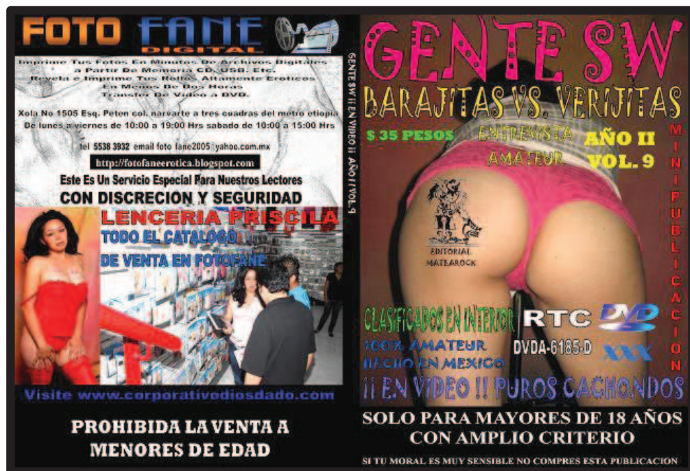
Ilustración 13. Presentación comercial de la mini-publicación “Gente SW” de la Editorial Matlarock. Vista externa.