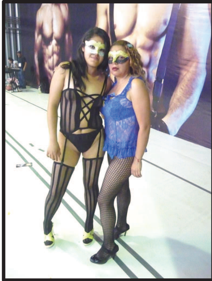
Ilustración 40. Modelos de la Editorial Matlarock usando un antifaz. Expo-sexo Sex & Entertainment edición 2012.

Esto se refleja, por ejemplo, en la realización de los castings en vivo o en el servicio de fotografías con los clientes durante el evento. En los primeros, tanto a los productores como a los participantes no les importa con cuál de las modelos se interactúa, dado que tienen el rostro cubierto con un velo. Sobre todo porque el productor simula hacer tomas con la cámara de videos de las partes corporales con una carga sexual significativa, los senos y la parte genital. Por su parte, el sujeto que lleva a cabo el casting centra su atención, y su actuación, sobre estos fragmentos corporales, besándolos o tocándolos con las manos de manera recurrente.