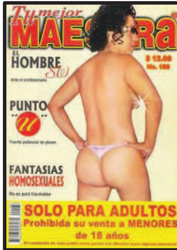
Ilustración 1. Presentación comercial de la revista Tu Mejor Maestra.