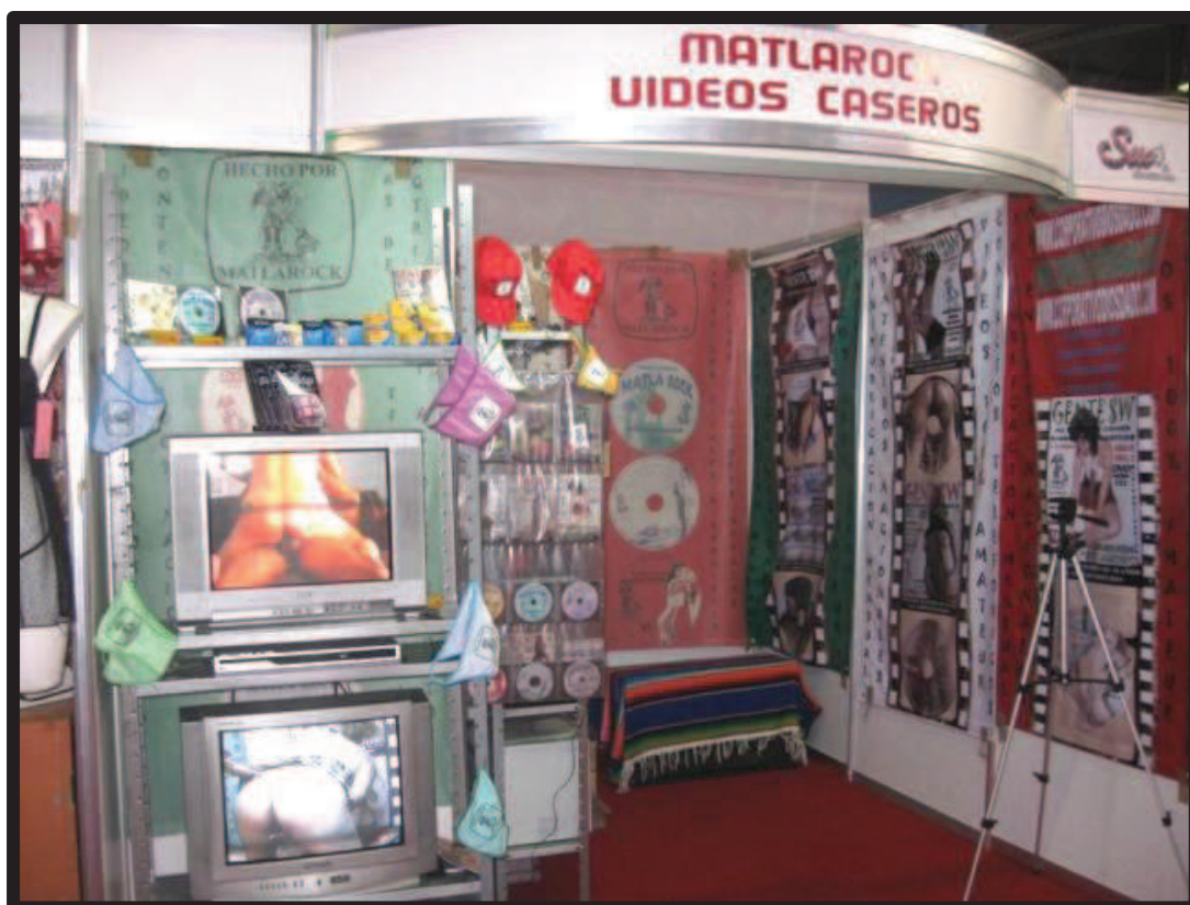
Ilustración 20. En el fondo se observa el baúl cubierto con una cobija, a la derecha las mantas impresas con las portadas de la mini-publicación de la Editorial Matlarock. Expo-sexo Sex & Entertainment edición 2010.