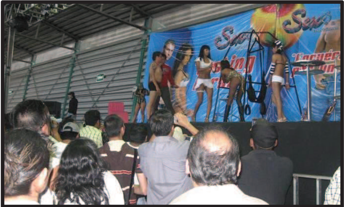
Ilustración 10. Casting en vivo de la productora de pornografía Tierra Erótica durante la expo-sexo Sex & Entertainment edición 2009.

En general, se les pregunta si saben por qué han sido citados en ese lugar, si han asistido por voluntad propia y se les pide que muestren su credencial de elector a la cámara. Inmediatamente después se les indica qué es lo que se busca en ellos para poder ser actores pornográficos, a saber, potencia física, entusiasmo, y se les explica en qué consiste el guión, procediendo así a la filmación del acto sexual. En las ocasiones en que coincide que un hombre y una mujer asisten para realizar su casting, lo ejecutan juntos. En caso contrario se emplea un actor o actriz ya contratado(a) por la empresa para interactuar en la escena sexual con el aspirante. Finalizada la sesión se les informa que los resultados de si son seleccionados o no serán publicados en la página web.