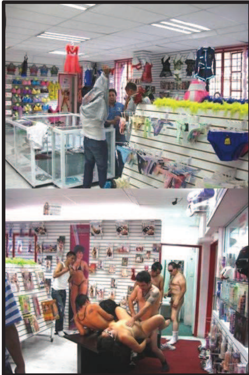
Ilustración 48. Reemplazo de los actores pornográficos. En la parte superior se muestra cuando les proporcionan la vestimenta para caracterizarse como empleados de la tienda, en la parte inferior se muestra cuando entran en escena.

dos actores pornográficos por otros dos actores pornográficos, se sustituyeron dos penes por dos penes erectos, que es a fin de cuentas lo que realmente interesaba a los primeros.