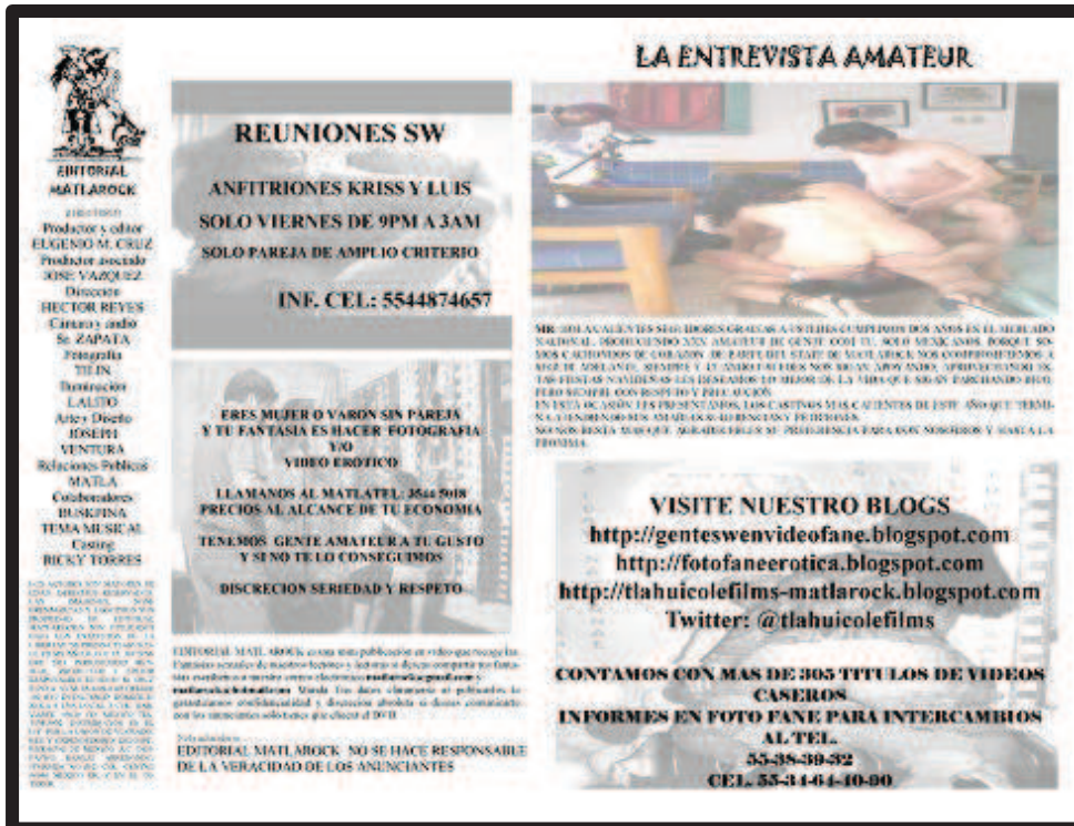
Ilustración 14. Presentación comercial de la mini-publicación “Gente SW” de la Editorial Matlarock. Vista interna.