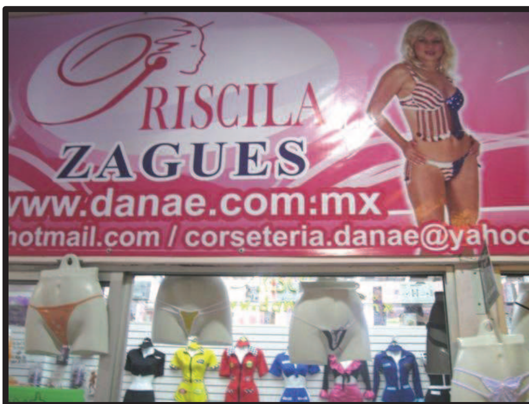
Ilustración 43. Fachada de la tienda de lencería Priscila, ubicada en la plaza comercial Sex Planet , en el centro histórico de la Ciudad de México.

Para ejemplificar esta problemática hacemos referencia a la grabación de una escena sexual que se realizó el día 9 de marzo del año 2010 y que corresponde al número 9 de la revista “Gente SW” de la Editorial Matlarock. En esta ocasión se citó a todas las personas –actores y equipo de producción– a las 15:00 horas en las oficinas de la editorial, ubicadas en aquel tiempo en el estudio fotográfico “Foto Fane”, lugar de donde se trasladaron a las instalaciones de la plaza comercial Sex Planet , en el centro histórico de la ciudad de México, donde se ubica el establecimiento de la tienda de lencería “Priscila”.