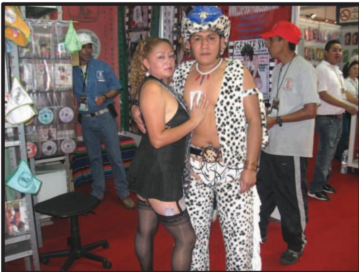
Ilustración 25. Modelos de la Editorial Matlarock en la expo-sexo Sex & Entertainment edición 2010.

atraer a la clientela. No obstante, a diferencia de otros locales comerciales –que también emplean modelos para obtener compradores potenciales de sus productos–, los modelos de la Editorial Matlarock no tienen prácticamente ningún momento de descanso. Esto provoca la falta de ánimo y el cansancio de éstos, que más que brindar un buen espectáculo, lucen aburridos y agotados.