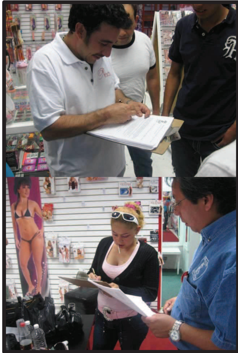
Ilustración 51. Firma de cesión de derechos.

A través de la descripción y análisis de la filmación de la escena sexual pudimos reconocer algunos elementos importantes y presentes en otros momentos del proceso de producción de pornografía amateur de la Editorial Matlarock. En primer lugar, la performance , la actuación de los individuos, el mostrarse capaces de realizar aquello que se espera de ellos y que de su correcta ejecución o no, que será evaluada por los productores –en el caso de los actores pornográficos–, depende su participación en la escena sexual. Estrechamente