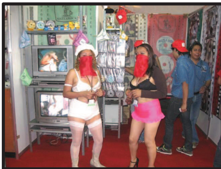
Ilustración 39. Modelos de la Editorial Matlarock utilizando un velo en el rostro. Expo-sexo Sex & Entertainment edición 2010.

Durante las actividades que realizan los productores de esta editorial en la expo-sexo Sex & Entertainment también es posible observar esta fragmentación del cuerpo. Retomando el papel que representan los modelos, sobre todo las mujeres, su trabajo es posar y bailar frente al local comercial portando vestimenta erótica. Así mismo, deben retratarse con los clientes cuando así lo solicitan y, como ya hemos mencionado, también ofrecer servicios de carácter sexual de manera clandestina. Además, deben actuar con los aspirantes a actor o actriz pornográficos(as) durante los castings. Entre los principales elementos que nos permiten hablar de una transformación en objetos de éstas, de un grupo de cuerpos intercambiables, está el hecho de que las mujeres tienen la cara cubierta con un velo o un antifaz. La explicación de los productores al respecto es que las modelos no son estéticamente bellas del rostro, mientras que éstas mencionan que sirve para mantener su anonimato, para que no ser reconocidas por sus familiares o amigos. En todo caso se da una despersonalización, una fragmentación del cuerpo, un cuerpo sin rostro.