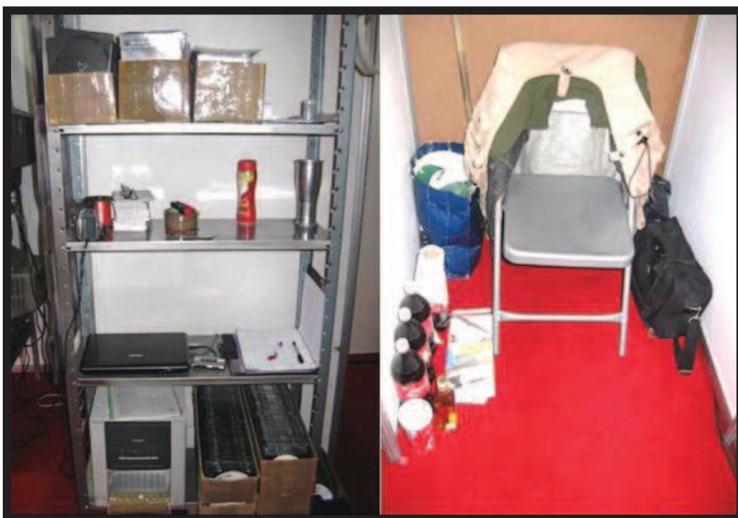
Ilustración 19. A la derecha, el estante con el equipo de cómputo y algunas cajas de cartón donde se almacenan los remanentes de la mini-publicación que comercializarán durante el evento, a la izquierda el cuarto acondicionado donde es posible observar algunos refrescos, vasos y bebidas alcohólicas. Expo-sexo Sex & Entertainment edición 2010.

se pide a los organizadores del evento que les improvisen dos paredes de manera que simulen un pequeño cuarto donde se coloca una silla. Este espacio sirve para guardar las pertenencias personales –mochilas, suéteres, bolsas, bebidas alcohólicas que los productores introducen de manera clandestina al evento–, y es utilizado, además, para que los modelos –las mujeres más que nada– ofrezcan servicios sexuales a los clientes que los soliciten, actividad para la cual no tienen permiso y que como veremos más adelante nos habla claramente de una relación de género muy marcada, entendiendo por ésta una relación de poder. Por último, en la pared del fondo y en la del lado derecho se colocan las mantas impresas con las portadas de los números de la mini-publicación y, al pie de éstas, un baúl en el que guardan el material –principalmente los videos de la mini-publicación– y al que cubren con una cobija, cumpliendo además la función de sillón y que es el espacio donde los clientes se sientan cuando son fotografiados con los modelos.