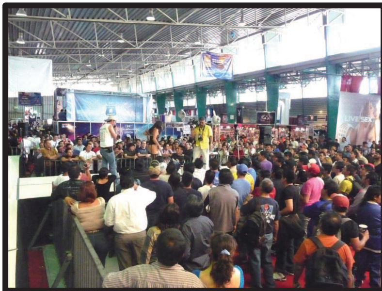
Ilustración 32. Casting en vivo de la Editorial Matlarock en la expo-sexo Sex & Entertainment edición 2012.