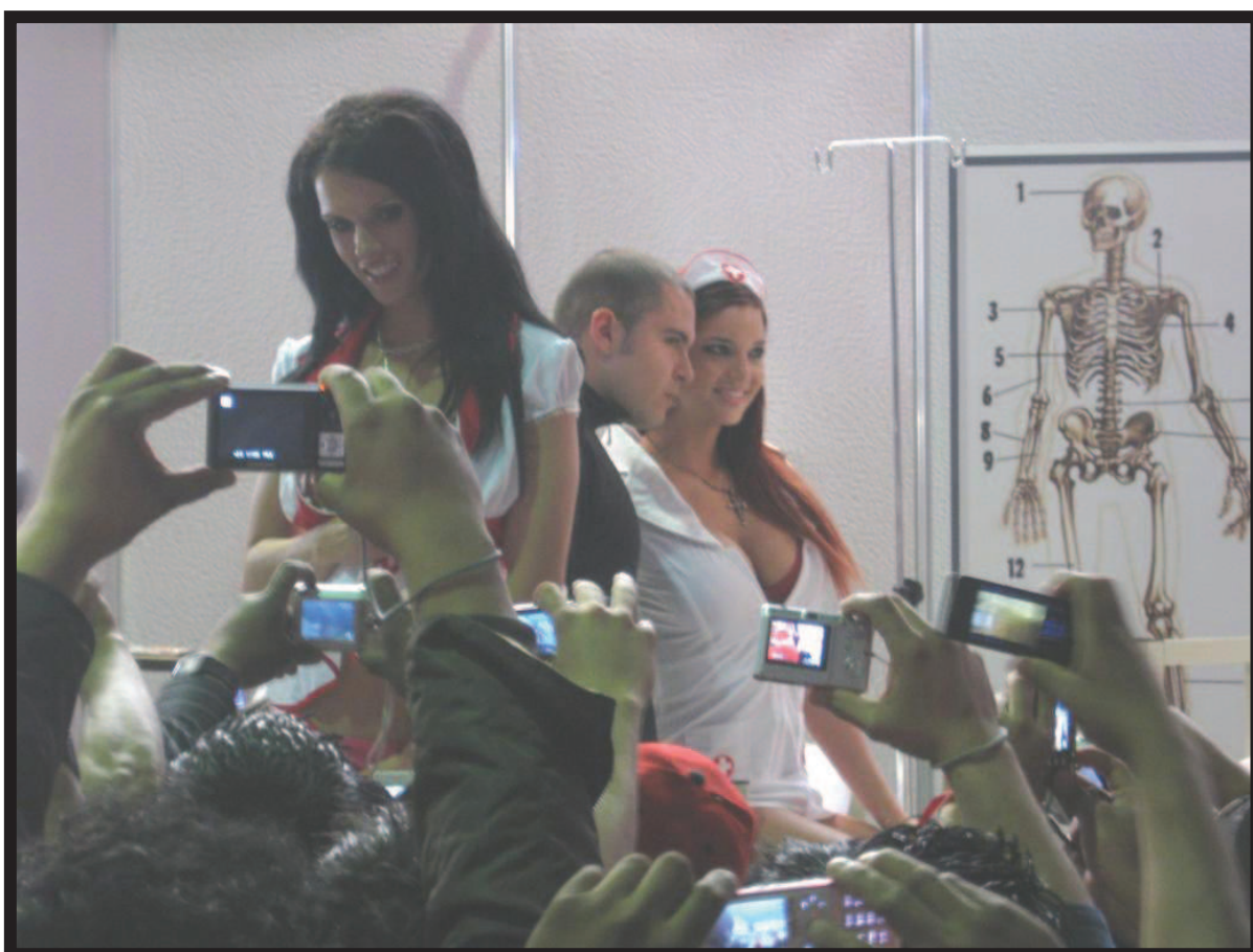
Ilustración 17. Modelos y público consumidor en la expo-sexo Sex & Entertainment edición 2010.

La expo-sexo está estructurada en seis secciones. El domo, donde se encuentra el espacio donde se realizan diversos espectáculos en vivo de table dance y el área swinger . Junto a éste se encuentra la zona de venta de alimentos. Así mismo, hay cuatro hangares o pabellones, dos en cada uno de los extremos, en los cuales se ubican los locales comerciales y algunos otros que también ofrecen presentaciones en vivo, pertenecientes en su mayoría a empresas consolidadas en el ámbito del entretenimiento para adultos como son las firmas Playboy y la revista “ H Extremo ” para el caso mexicano. Es notable la presencia de varias productoras de pornografía internacionales que tienen acondicionados sus establecimientos para que el público asistente tenga la oportunidad de mirar a sus modelos y fotografiarlas, así como brindarles la oportunidad de retratarse con éstas pagando una cuota de entre cien y ciento cincuenta pesos.