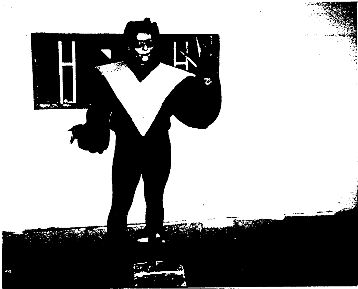
2.1. Fotografía de "Humatron", personaje que trabaja en las calles del centro histórico, él simula ser un robot, se mueve cada vez que alguien le da una moneda.