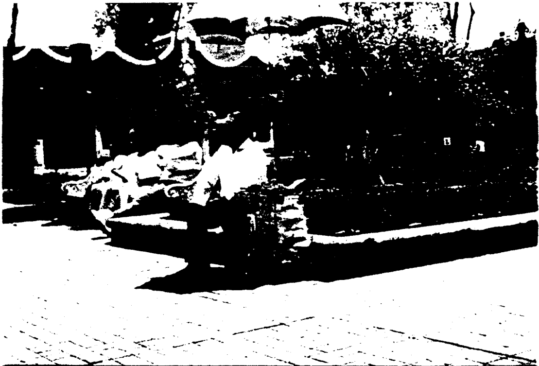
2.3. Foto. Vendedor de comida para aves en la plaza de Coyocán. El da a los visitantes del lugar, un momento que les otorga a sus compradores una mascota efímera