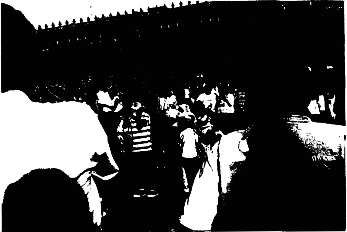
2.4. Fotografía que muestra la protesta política metafórica, escenificada en el Zócalo capitalino, frente al Palacio Nacional donde siempre se han dado cita las señales de resistencia.