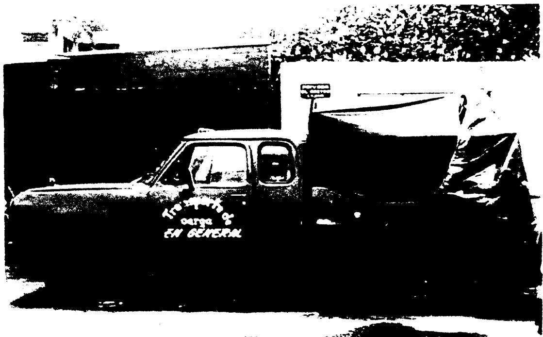
3.2. Fotografía de la camioneta donde habitan y duermen "el bucanero" y su familia cuando llegan a la ciudad y se transportan desde Cuautla Morelos.