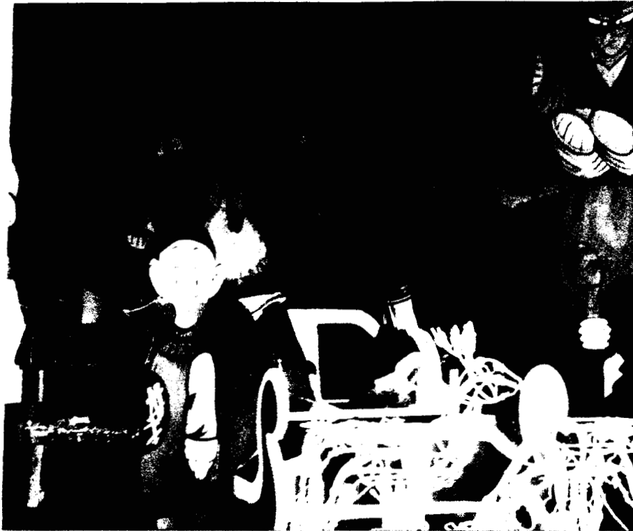
2.6. Personajes de procedencia oriental ( Dragón Ball ) utilizados también en Navidad.

En este capítulo pudimos percatarnos, del ingenio que estos individuos utilizan para realizar su trabajo, también se presentaron los dispositivos utilizados para el desempeño de éste y se hizo una exploración de la dimensión simbólica que acompaña a sus actividades, así como de algunas evocaciones que nos dan cuenta de una ciudad imaginada, pero no por eso apacible, sino conflictiva donde el círculo de la comunicación, ayuda a construir códigos y claves, efectivos en un determinado espacio y tiempo.