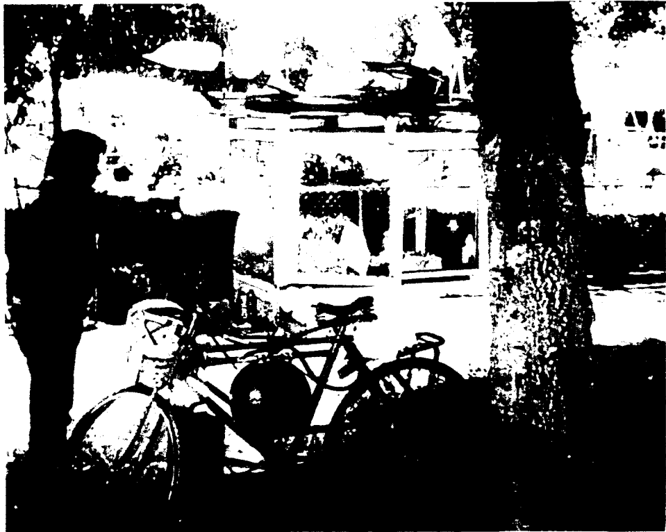
2.2. Fotografía de un "algodonero" en el momento en que fabrica su mercancía, en ella se aprecian sus dispositivos para laborar.