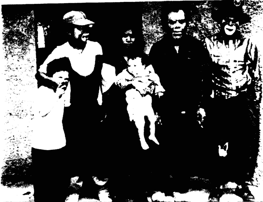
3.1. Fotografía del “ bucanero ” y su familia frente a una casa, ubicada en un de los callejones utilizados para su descanso.

Esta forma de habitar del “ bucanero ”, muestra una estrategia para vivir tanto en el campo como en la ciudad, aunque ninguno de estos proporcione el mercado de trabajo que los conduzca a satisfacer sus necesidades.