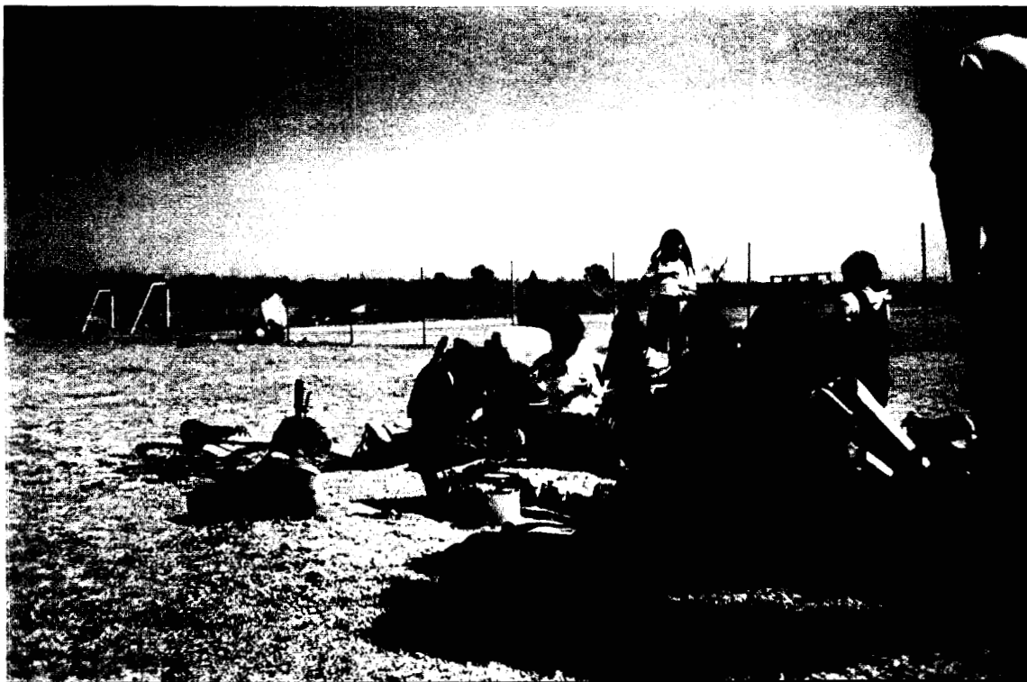
Madres llevándoles de comer a sus hijos de la primaria al momento del recreo.