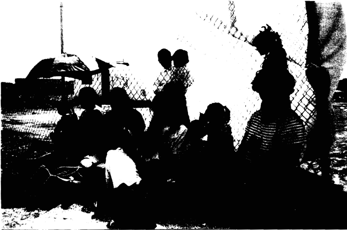
Madres que participan en el Programa de educación Inicial donde reciben orientación sobre el desarrollo del niño después de llevarles de comer a sus hijos.