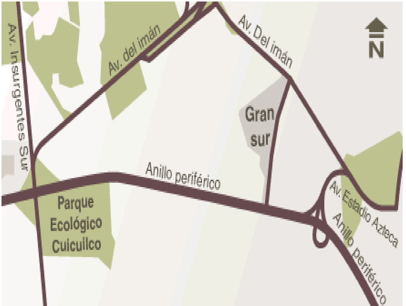
MAPA DE UBICACIÓN DEL CENTRO COMERCIAL