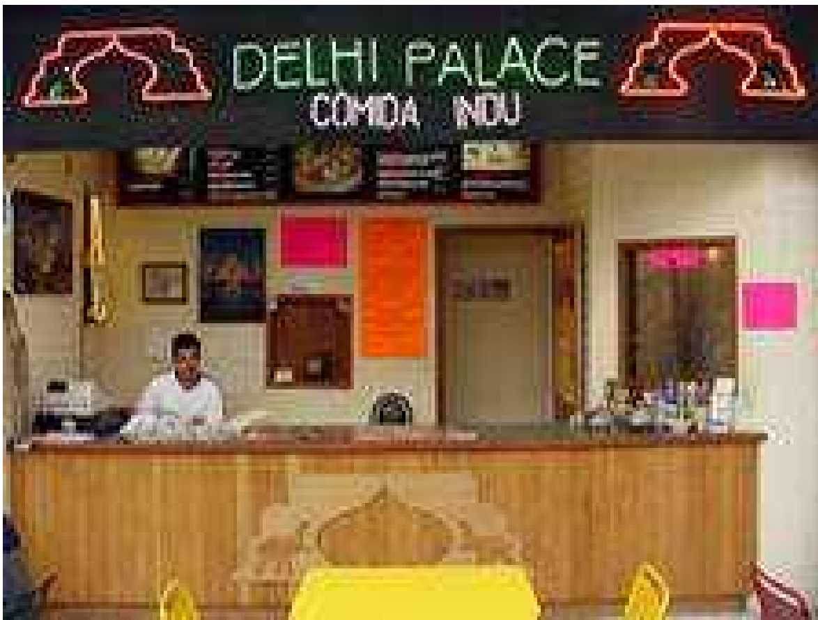
FOTO DEL DELHI PALACE

En Chalco se encuentra la comida China, que actualmente tiene bastante aceptación dentro de los que visitan el centro comercial, tanto que se puede considerar que es una moda entre los habitantes de la localidad. Los costos son relativamente bajos, sin se considera que te venden un paquete con arroz frito y dos guisados con un refresco por 47 pesos.