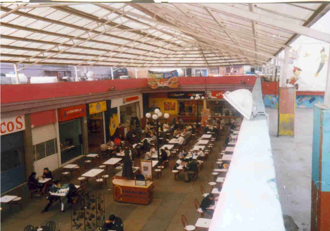
Foto del centro comercial plaza Chalco

La alimentación es importante por que nos dice un poco de la cultura de cualquier grupo. Por eso me parece importante estudiarlo y hacer una comparación entre los diferentes usos de la alimentación en los centros comerciales.