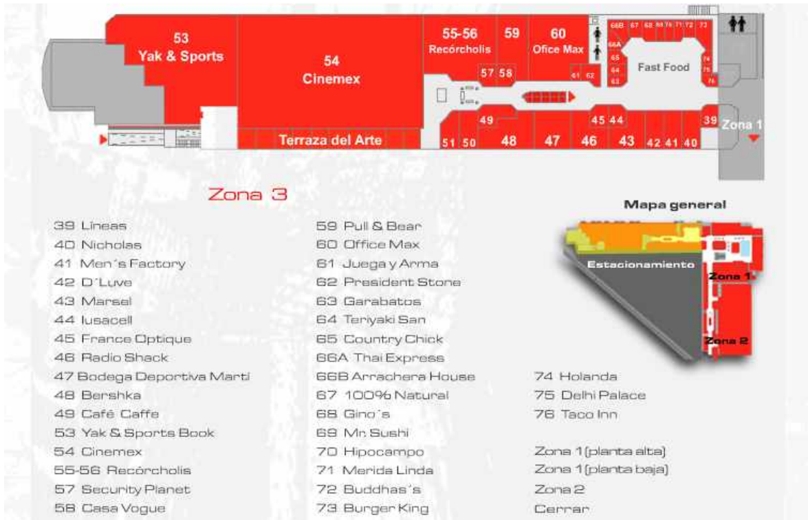
MAPA DE UBICACIÓN DEL CENTRO COMERCIAL GRAN SUR