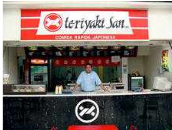
FOTO DEL LOCAL DE TERIYAKI SAN