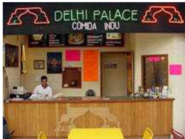
FOTO DEL LOCAL DE DELHI PALACE