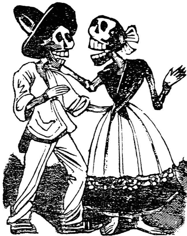
76. Posada . Pareja de alegres "calaveras" que siguen amándose aun después de la vida. Grabado en relieve en plomo. 78 × 63 mm.