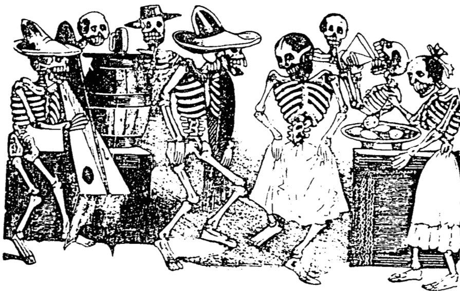
75. Posada . No importa su nuevo estado. Por un día reviven los esqueletos la alegría de lo terreno: bailan, beben y se divierten de lo lindo. Este admirable trabajo de Posada es, sin duda, el que corona su obra. Grabado en relieve en plomo. 120 × 204 mm.