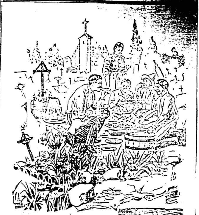
Llorando al hueso..... En el Panteon de Dolores