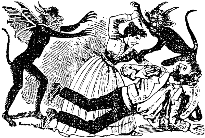
48. Posada . Cuando el artista solía ocuparse de asuntos cruentos era casi obligada la presencia del Diablo como inspirador del crimen. Los que creó su imaginación rivalizan en horror con los que se ven en portales góticos y en los grabados de Durero. Cincografía.