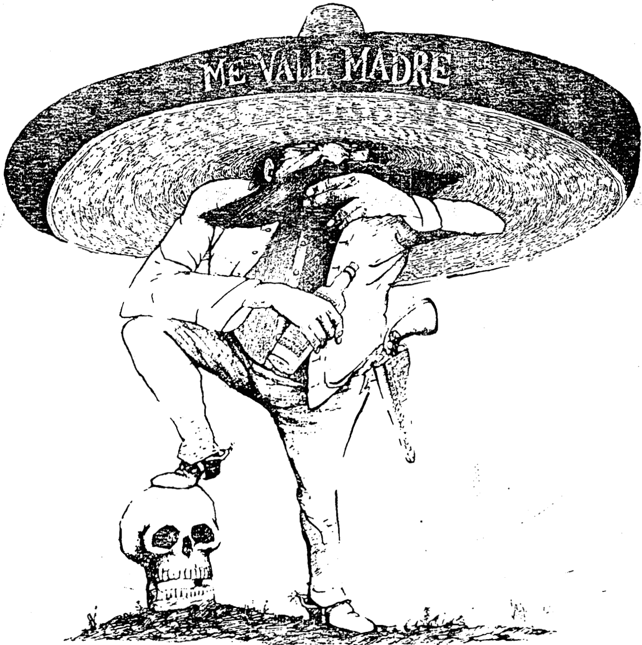
La muerte. Expresiones Mexicanas de un enigma.