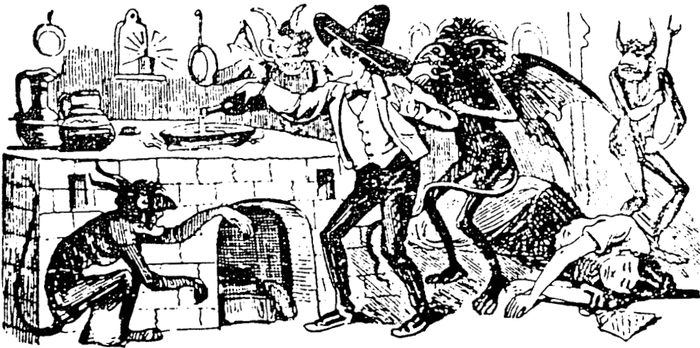
49. Posada . Eleuterio Mirafuentes, aconsejado por cuatro espíritus infernales, condimenta un guiso para quitar la vida a odiada mujer. Cincografía. 75 × 155 mm.