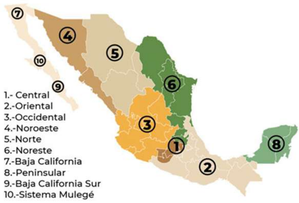
Figura 1: Zonas del sistema eléctrico nacional. Fuente: PRODESEN 2020-2036 p.47.