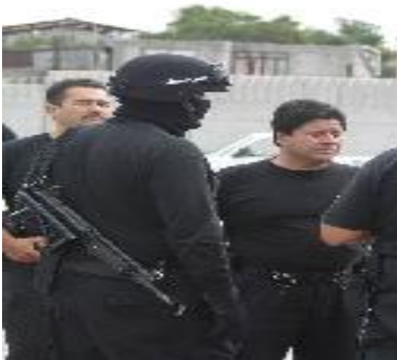
Granaderos y agentes contra motines en el penal de Santa Marta