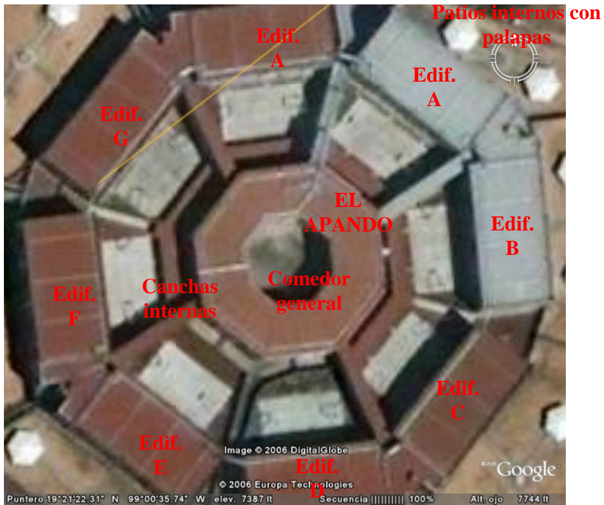
Imagen satelital en la que podemos señalar los edificios por número, las canchas, las palapas en los patios traseros, el comedor y el apando.

Los espacios arquitectónicos y las políticas institucionales de los reclusorios determinan la formación de los grupos y de identidades diferenciadas.