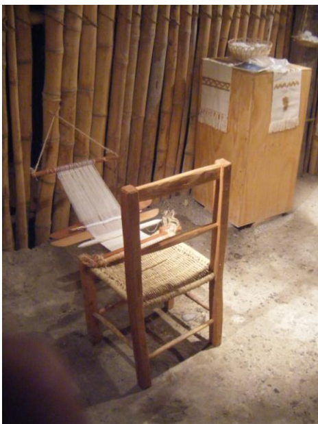
Telar de cintura en Parque Temático