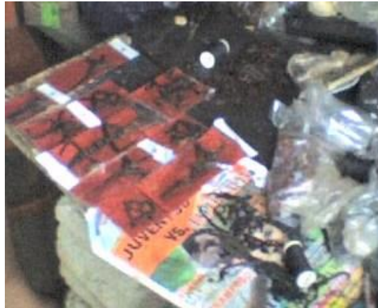
Figuras de vainilla elaboradas por una familia en la comunidad de Nuevo Ojital