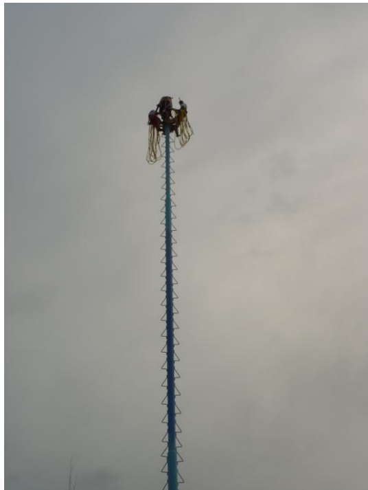
Voladores antes de emprender el descenso del palo volador de la zona arqueológica. 2010

Desde que se le dio impulso turístico a la zona, el ritual comenzó a tener más auge en el mercado como espectáculo. Convirtiendo a Papantla en el máximo exponente de la danza a nivel internacional a pesar de que la danza puede encontrarse en gran parte del Totonacapan. Hoy en día la danza es un gran espectáculo y un recurso económico para los grupos de voladores quien son contratados para presentarse en otros estados de la republica y a nivel internacional como España y Estados Unidos