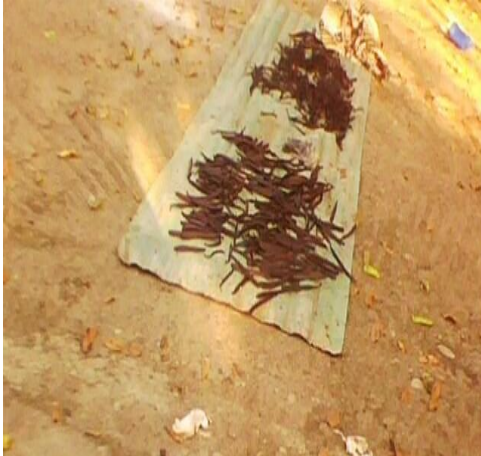
Vainas de vainilla al sol