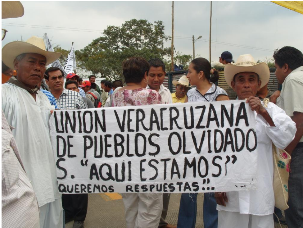
“Abuelos” totonacas durante el plantón. Marzo 2010