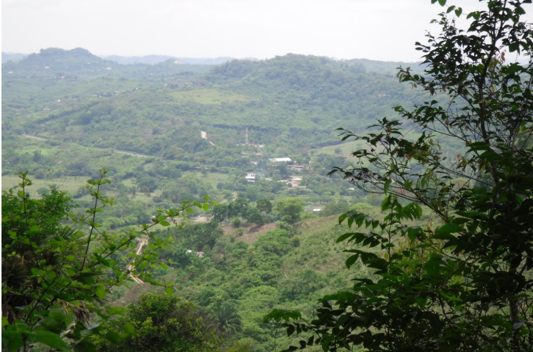
Vista panorámica desde San Antonio Ojital