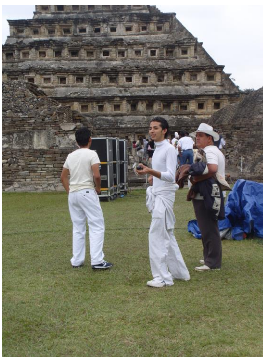
Visitantes en la zona arqueológica durante el 21 de marzo.

arqueológica y las vibraciones cósmicas, ha experimentado una especie de comienzo en el año, llena de energía, vitalidad y optimismo