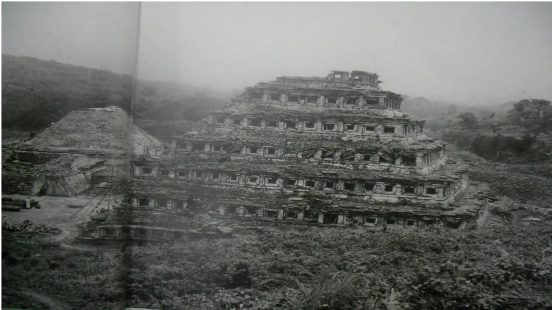
Zona arqueológica El Tajín a principios de siglo XX

En 1938 con la reciente creación del Instituto Nacional de Antropología e Historia da comienzo una nueva etapa en los trabajos de restauración de monumentos e investigación arqueológica a cargo de José García Payón quien destinaría gran parte de su vida al conocimiento de la zona 21 .