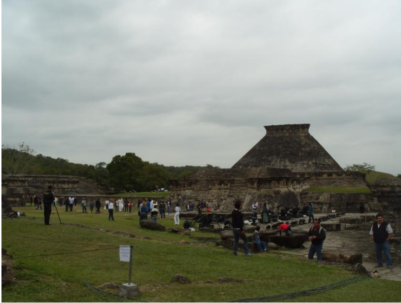
Afluencia turística 21 de marzo 2010