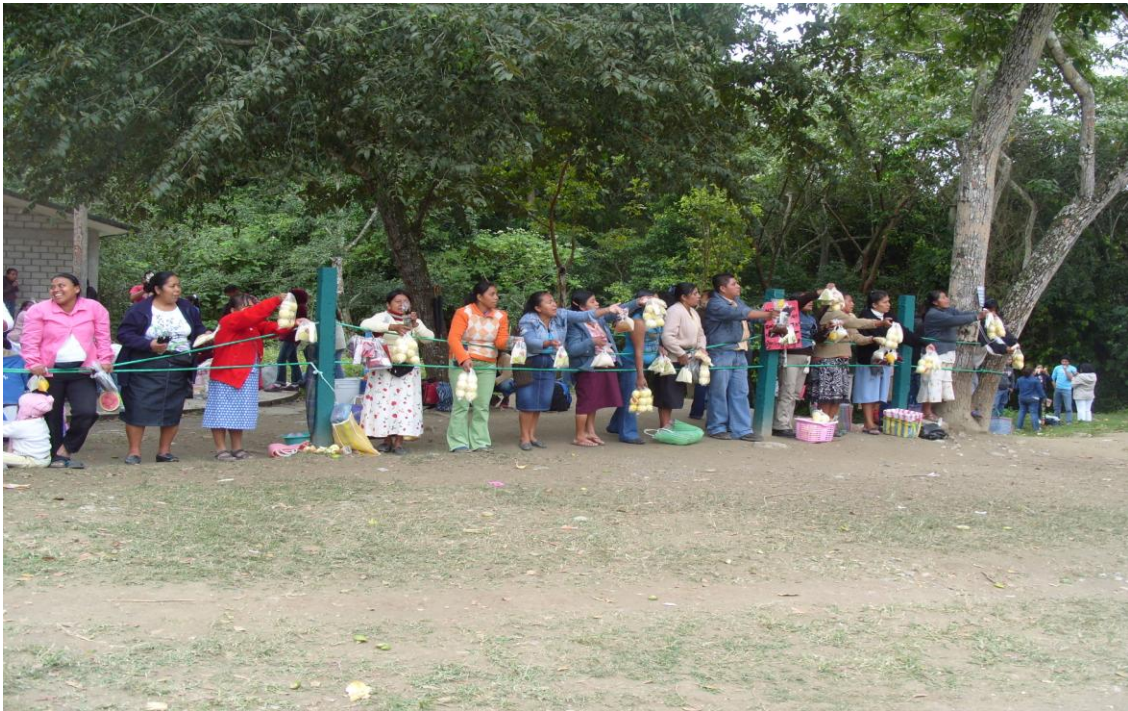
Comerciantes en el espacio denominado “el corralito.” Febrero 2010

en una situación difícil por la baja oferta laboral. Generalmente estos empleos están enfocados a proyectos de beneficio comunitario.