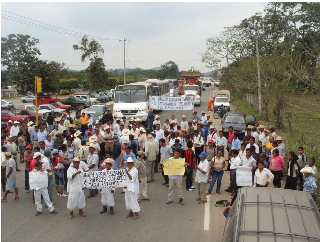
Cierre de carretera frente a Parque Temático. Marzo 2010

Los representantes de la organización mencionaron que Cumbre Tajin es un buen evento pero que no han recibido propuestas concretas que detonen la región. Sus comunidades se encuentran abandonas no cuentas con servicios básicos. No hay oportunidades de estudio, empleo trabajo que permitan un arraigo y establecimiento de los habitantes en sus localidades, buscan ser un región de desarrollo a partir de su cultura, no quieren políticas indigenistas, si no que a los indígenas se les brinde la oportunidad de plantear desde su propia cosmovisión el desarrollo del Totonacapan.