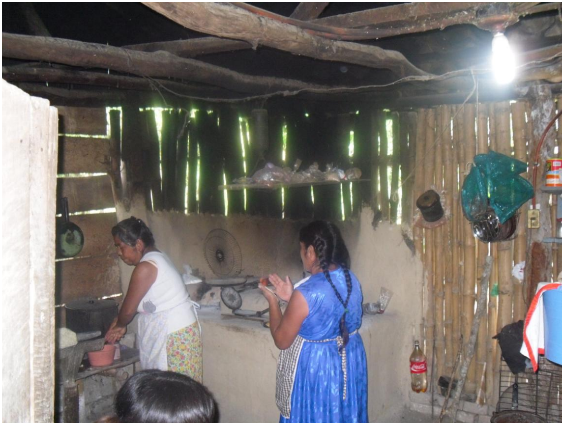
Hermanas Castaño preparando la comida. Junio 2008

estuvo yendo al municipio de “aquí, pa’ allá para arreglarse y poder contener las exigencias del líder”.