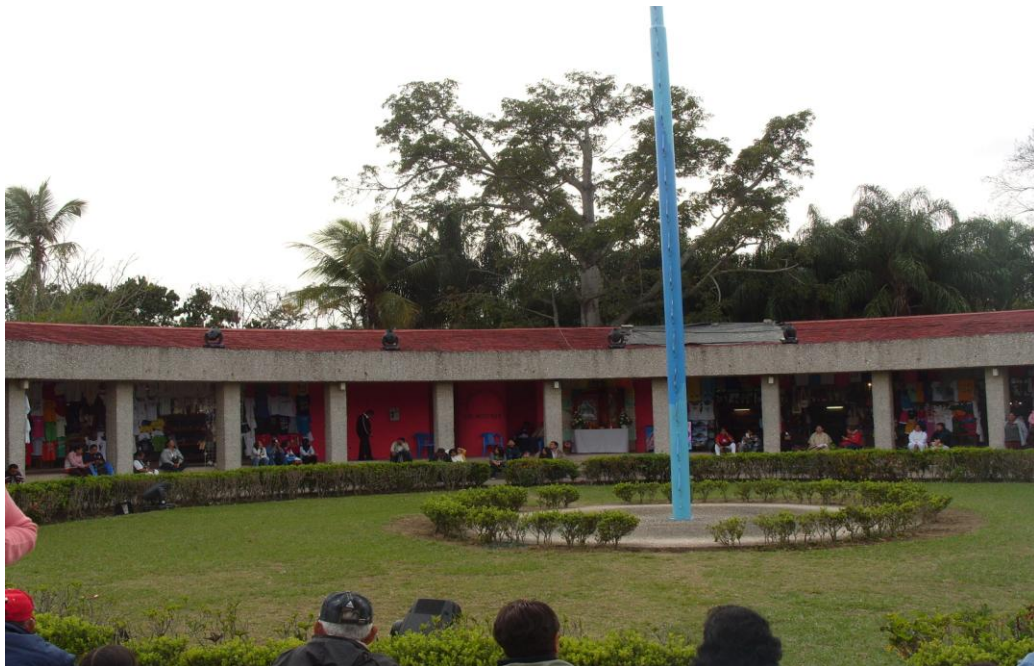
La Media Luna. Marzo 2010

Muchas de la mercancía que se vende en La Media Luna pueden encontrarse en los puestos de afuera pues muchos son producidos en serie y otros como las artesanías frente a la competencia, algunos de sus miembros han recurrido a venderlas a la organización de la SSS, quienes tienen acaparado gran parte del espacio comercial.