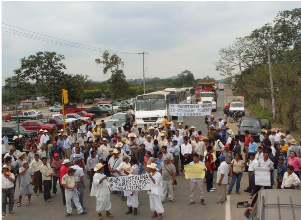
Cierre de carretera durante el plantón. Marzo 2010