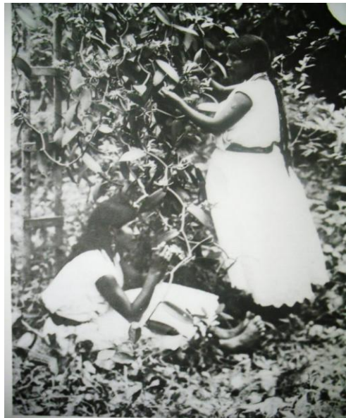
Polinización de la planta de vainilla.

Actualmente la vainilla es exportada a diferentes partes del mundo, la producción china ha disminuido considerablemente la venta y el consumo de la vainilla nacional ya que su precio es menor. Las comunidades siguen produciendo pero en pequeña escala. Durante los recorridos se pudo observar que en algunos patios vainas secándose en el piso que servirán para elaborar pequeñas artesanías.