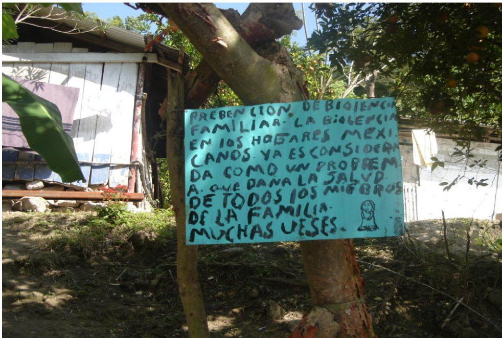
En el camino principal para acceder a la comunidad se pueden observarse diferentes letreros de carácter informativo y con recomendaciones sobre violencia, salud y educación.