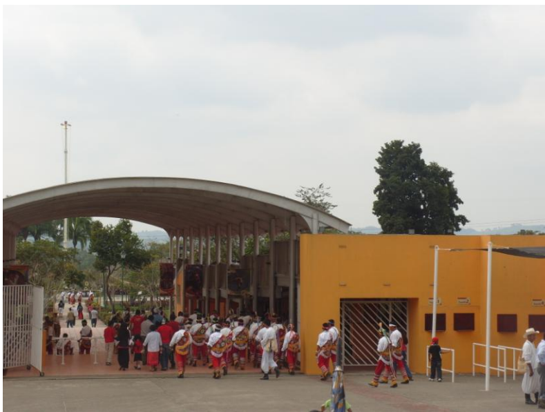
Entrada principal al Parque Temático. 2010

El acceso al evento es solo para quienes puedan pagarlo, mucho de ellos turistas quienes provenientes de ciudades y estados cercanos. La entrada oscila alrededor de $250 pesos por día, este puede variar dependiendo los días que se dese ingresar, si se requiere de camping y otros servicios. Los habitantes de las comunidades que ingresan al Parque son porque se encuentran realizando alguna labor o trabajo dentro del mismo o porque algún familiar realiza alguna actividad relevante; algunos me comentaron que se les permitía el libre acceso si portaban su vestimenta tradicional de manta. Esto pudiera parecer una especie de continuidad y fomento al juego de la simulación de escenarios, pues así se recrea un espacio para el turismo con la población local portando una vestimenta que actualmente ya no es usada demostrando que la cultura local puede ser absorbida por la cultura turística.