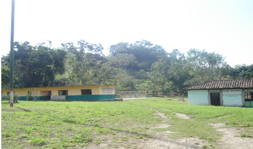
Escuela Primaria Marco Antonio Muñoz y Agencia Municipal, a la izquierda de puede observar el palo volador.

frijol y congeladas en un espacio que se ha denominado como “el corralito” el cual se encuentra al fondo de la zona, a un costado de La Greca. Es un espacio con un pequeño piso de concreto, cercado por un lazo, con el fin de delimitar el espacio e impedir que abarquen más del que se les ha asignado.