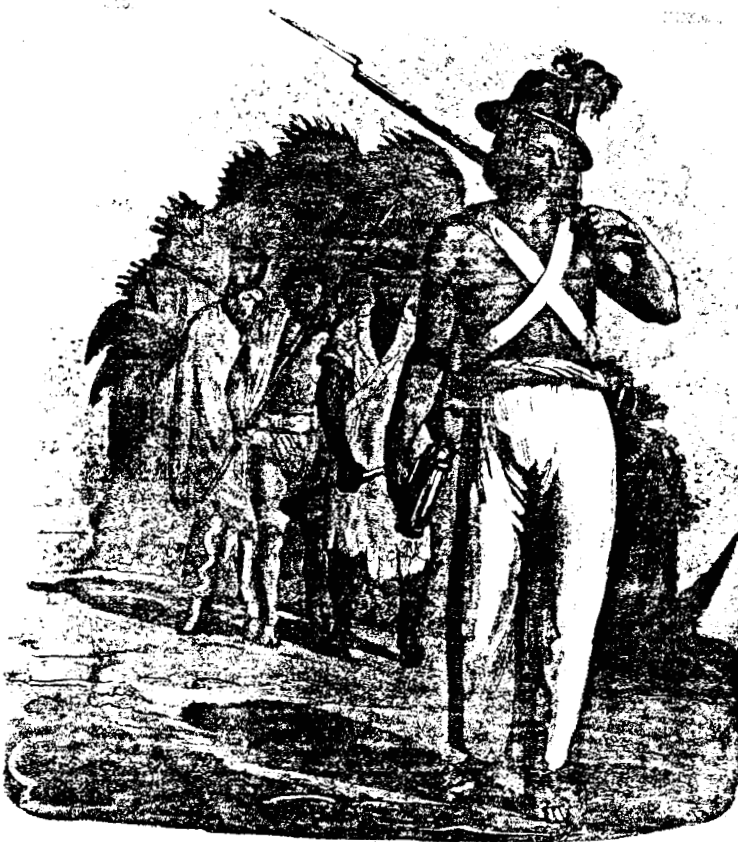
COSTUMES MEXICAINS. par M. de la Harpe, dessiné par G. de la Harpe.

Uno de los factores por las que México pierde en las batallas en contra de los Estados Unidos, radicó en la mala posición de las tropas mexicanas quienes, la mayoría eran civiles, es decir, gente que no estaba familiarizada con las armas, a lo que tendríamos que agregar la mala organización y el poco financiamiento por parte del gobierno quien carecía de dinero. He aquí un ejemplo de la pobreza de los hombres que iban a la defensa de la nación