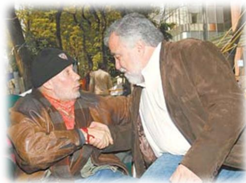
Ilustración 9. Encuentro entre el diputado Alejandro Encinas y el Dr. Edur Velasco frente al edificio de la BMV.

"El diputado federal Alejandro Encinas visitó al profesor Edur Velasco, en huelga de hambre desde hace 26 días en demanda de un aumento al presupuesto destinado a la educación superior, a quien aseguró que la Comisión de Educación de la Cámara de Diputados recibirá a los indignados, quienes realizarán una movilización el próximo jueves de la BMV al Palacio Legislativo. El legislador también dio a conocer que se formará una comisión para atender las demandas educativas del movimiento." (Díaz, 2011: 8).