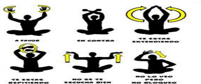
Ilustración 4. Ejemplo del Lenguaje Simbólico para la expresión colectiva en la Asamblea.

En la imagen no puede apreciarse pero aquí la comunicación es bilateral a diferencia del mitin, cualquiera puede hacer una intervención directa a través de signos corporales sobre lo que se está diciendo. No se puede interferir al que está hablando en el momento en el que éste se hace escuchar, pero cualquiera le puede hacer llegar señales a la persona que tiene la palabra, ésta, al observar las señales puede utilizarlas para replantear sus ideas, argumentos o planteamientos mientras tiene uso de la palabra. Este lenguaje simbólico para la expresión colectiva en la asamblea 56 se utiliza sobre todo para que los participantes puedan escucharse con respeto, evitar los insultos, el abucheo y el aplausómetro, como en el caso del mitin, además de que permite agilizar la exposición de ideas y por ende la toma de decisiones.