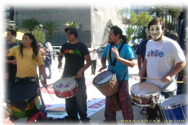
Ilustración 5. Jóvenes tocando música durante la jornada del 15O.

Otro aspecto importante a sobresaltar es el carácter lúdico de las manifestaciones que ha singularizado al movimiento de los indignados desde su origen en España y la creatividad desplegada en sus formas particulares de protesta. Esto está estrechamente ligado con las nociones de desobediencia civil y la no violencia activa , ambas irreductibles entre sí en el accionar político. El uso de música específica como forma de protesta o la realización de performances también fueron parte de la jornada de aquel día, una vez más, realizados principalmente por jóvenes.