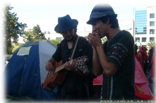
Ilustración 8. Jóvenes instalando tiendas de campaña en el 15O.

Como se ha señalado en los capítulos anteriores otra de las características de este movimiento es la creación de acampadas/asambleas en los espacios públicos en los cuales la ciudadanía se da cita ¿Qué hubo con relación a esto durante el 15O en la Ciudad de México? Pude observar algunas tiendas de campaña bajo el Monumento a la Revolución, alrededor de cinco tiendas.