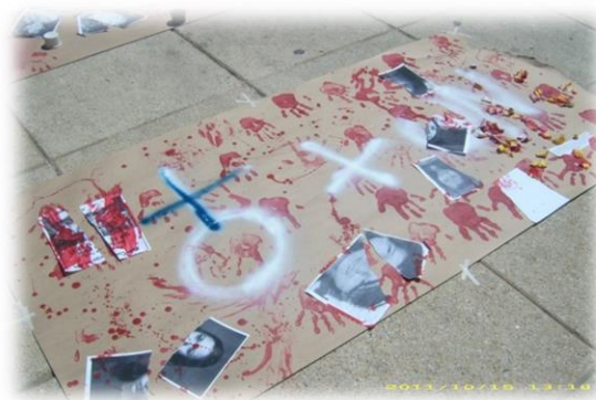
Ilustración 7. Cartel en contra de la violencia en México durante el 15O.

El performance estuvo claramente dirigido al rechazo de la estrategia militar contra el narcotráfico iniciada durante la administración del «condenado» pero igualmente rechazado expresidente de la república que cobró miles de víctimas durante su gestión. Hubo otros mensajes evidentes en contra de la denominada «guerra contra el narcotráfico» y la violencia generalizada en México en las expresiones del 15O.