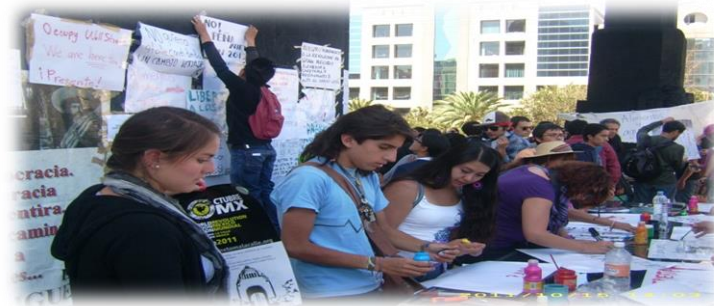
Ilustración 1. Asistentes elaborando sus carteles.