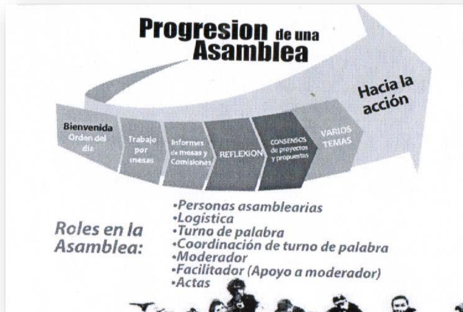
Ilustración 15. Progresión de una Asamblea. El diseño de la imagen y su contenido pertenecen a la Asamblea México Toma la Calle Democracia Real ¡Ya!

Cómo la imagen muestra, comienza por la bienvenida y el orden del día, el cual es sugerido por la moderadora. La moderadora: