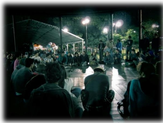
Ilustración 10. Asamblea en el Kiosco de Coyoacán.

El kiosco alrededor del cual estaban ubicadas todas las tiendas de campaña representó también un sitio central dentro del campamento, fue reapropiado tanto física como simbólicamente. Era frecuente encontrar infinidad de mensajes de carácter político, aunque no exclusivamente, escritos en papel tapizando esta estructura, sobre todo durante las primeras semanas de ocupación. El kiosco, además, era utilizado al principio como el lugar en donde se llevaban a cabo las asambleas y otro tipo de actividades como talleres de diversos tipos.