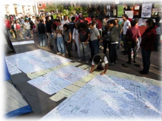
Ilustración 11. Transeúntes, participantes y acampantes en actividad "Y a ti ¿Qué te indigna?"

Algo que distinguió a la acampada sur con respecto al campamento de la BMV fue su orientación hacia la creación de actividades de toda índole. Desde mi experiencia, la acampada sur, como comunidad , aunque no estaba desprovista de un contenido político estaba más dirigida a fungir como un punto de encuentro y foro de expresión cultural y artística para todas aquellas personas interesadas en participar en ese espacio urbano.