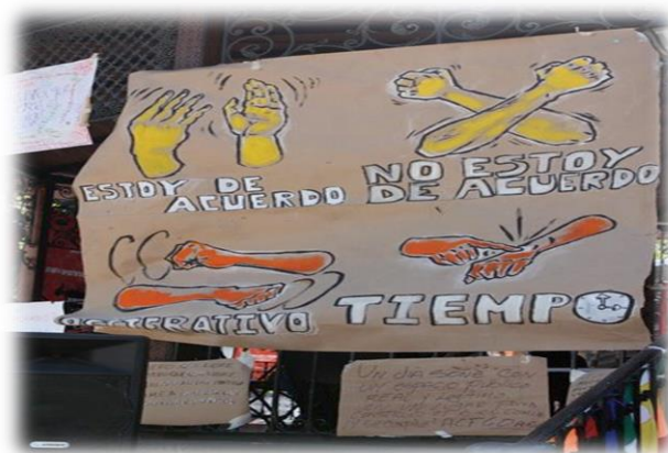
Ilustración 12. Parte del Lenguaje Simbólico para la expresión colectiva en la Asamblea.

Tanto «transeúntes», como «participantes» y «acampantes» tenían la facultad de participar y decidir en asamblea aunque para cuestiones de gestión y organización interna relacionadas directamente con la acampada y sus recursos estratégicos se daba más peso a la opinión de «participantes» y «acampantes», esto evidentemente al momento de consensuar objetivos referentes a estos rubros.