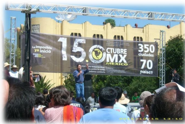
Ilustración 2. Mitin realizado por el SME durante el 150.