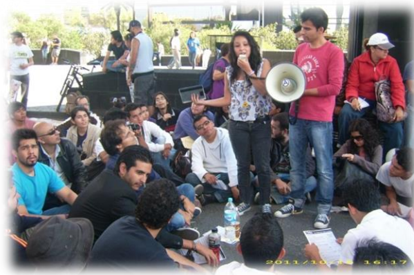
Ilustración 3. Asistentes al 15O realizando una asamblea.

Al mismo tiempo que se llevaba a cabo el mitin del SME, debajo del techo del Monumento a la Revolución se llevaba a cabo una asamblea.