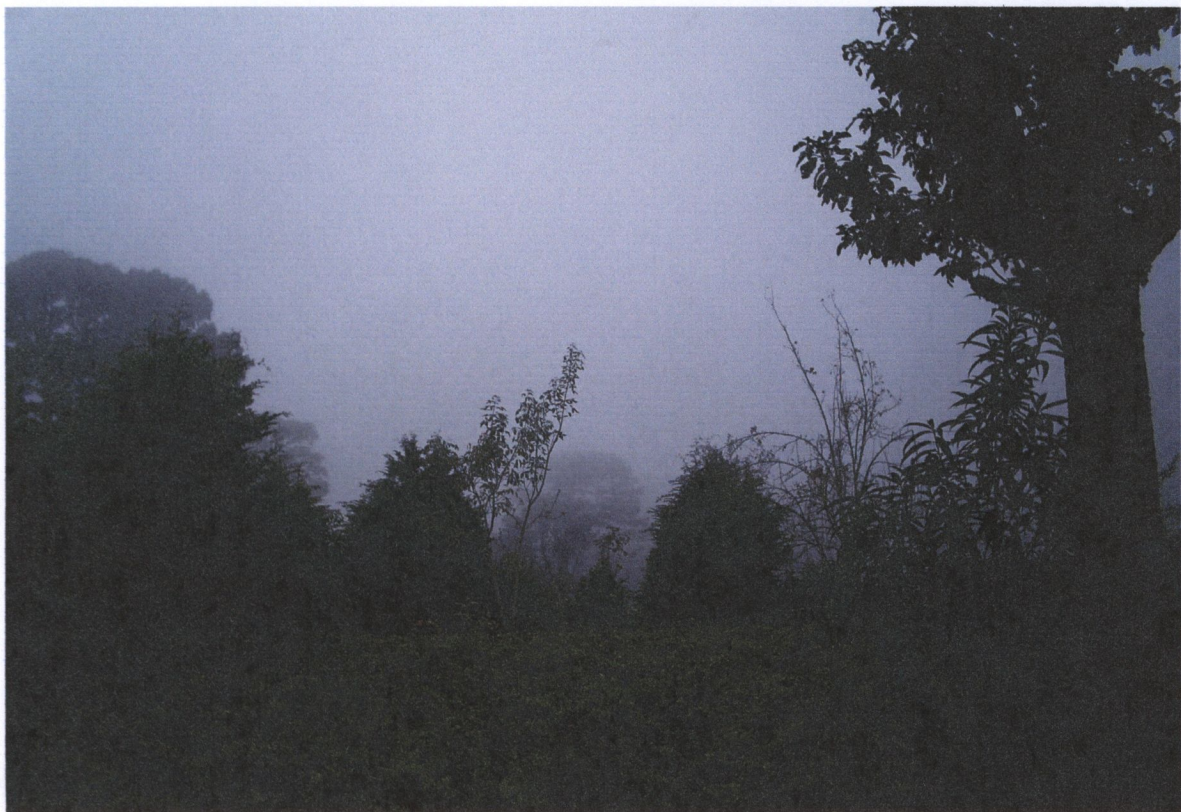
Tenango víctima Invernadero de pino los huracanes