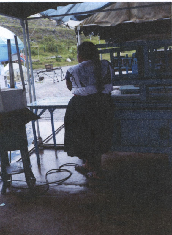
Nahua de Tenango de las Flores