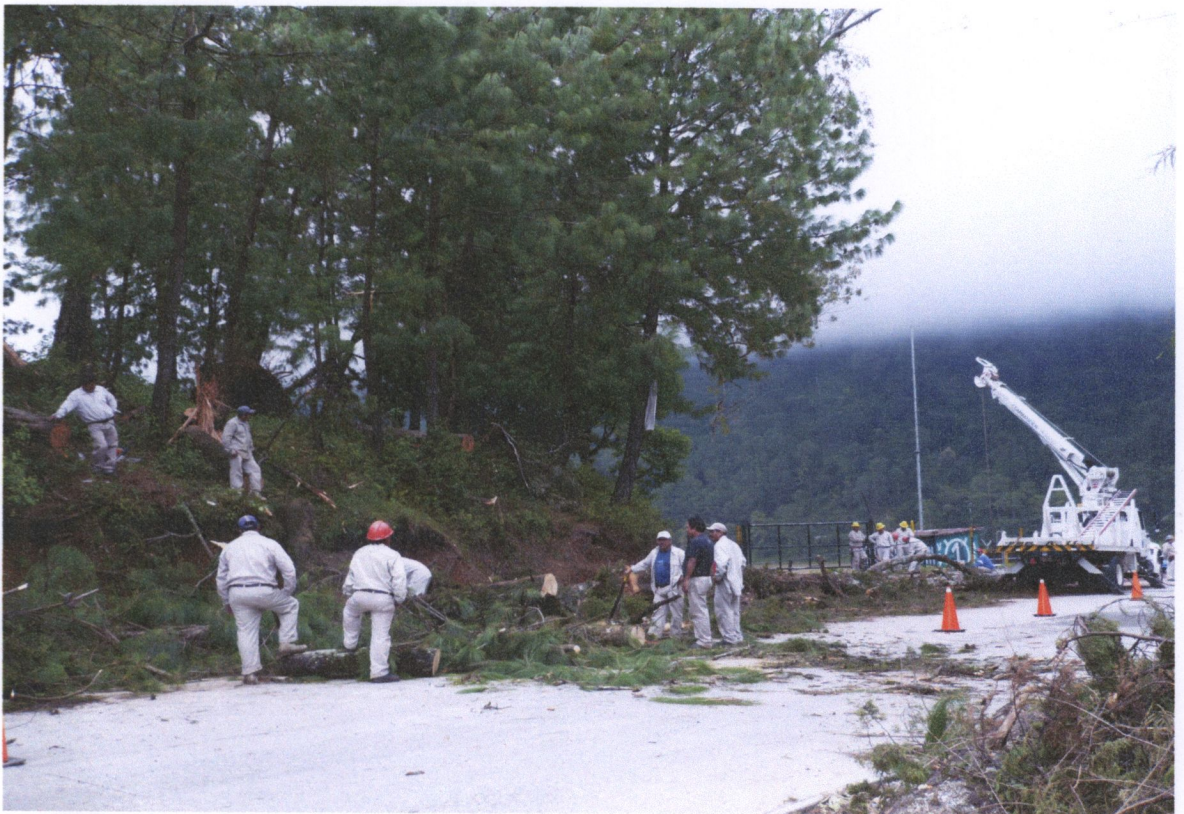
Trabajadores de la Compañía de luz arreglando los desperfectos ocasionados por el huracán