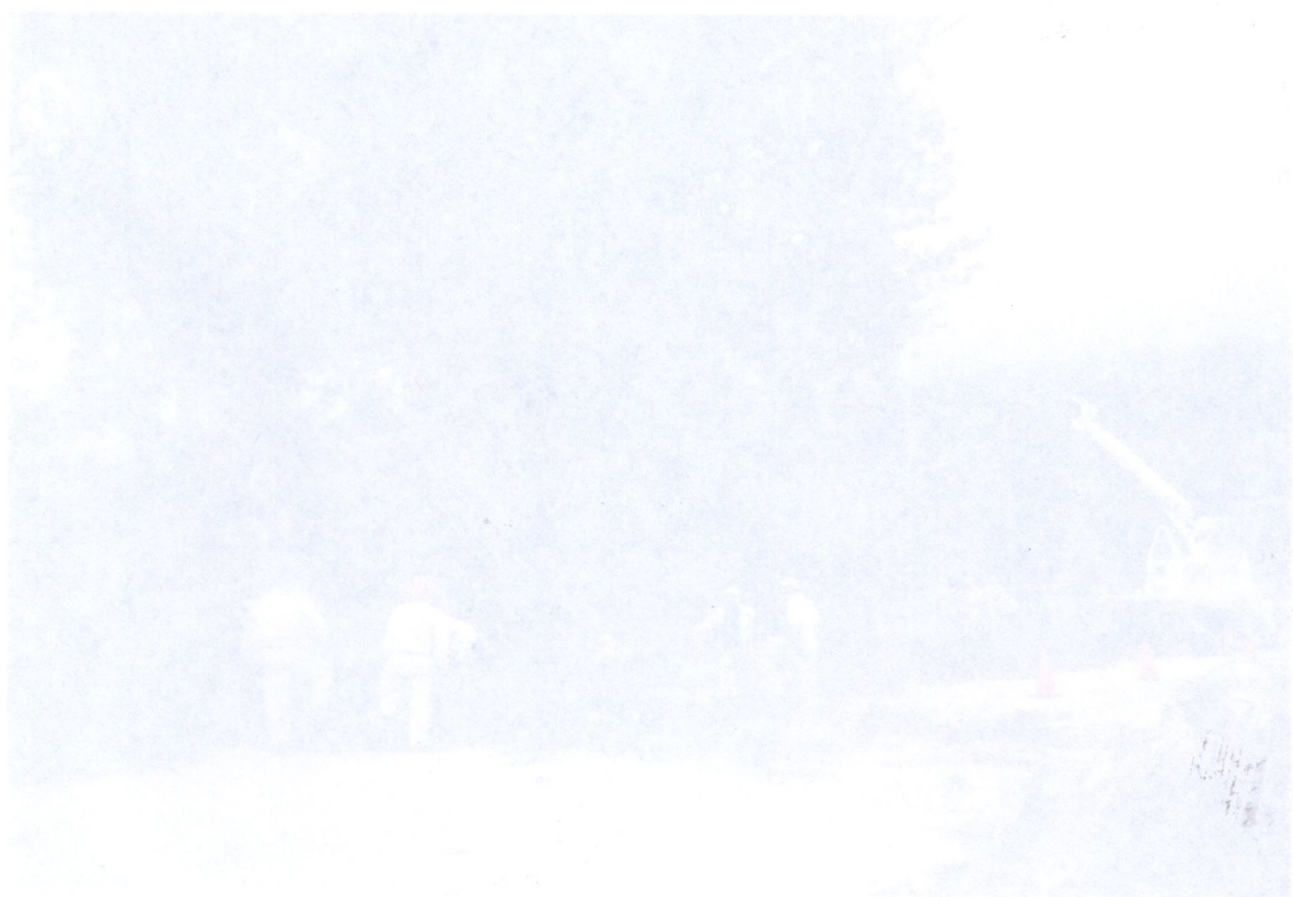
Trabajadores de la empresa de los arreglando los desperfectos ocasionados por el huracán