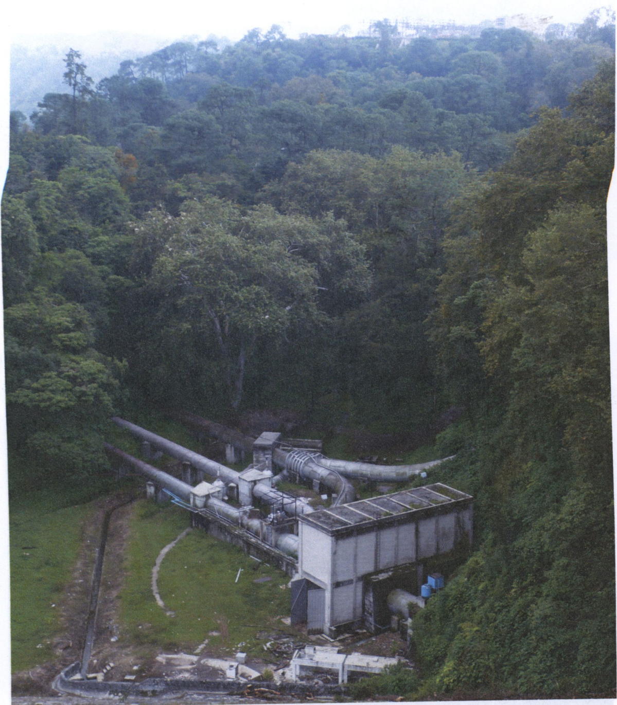
Central hidroeléctrica de Necaxa