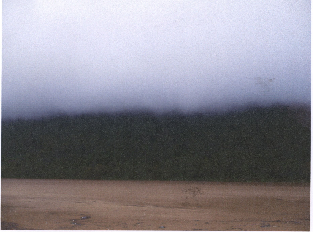
Tenango víctima común del paso de los huracanes