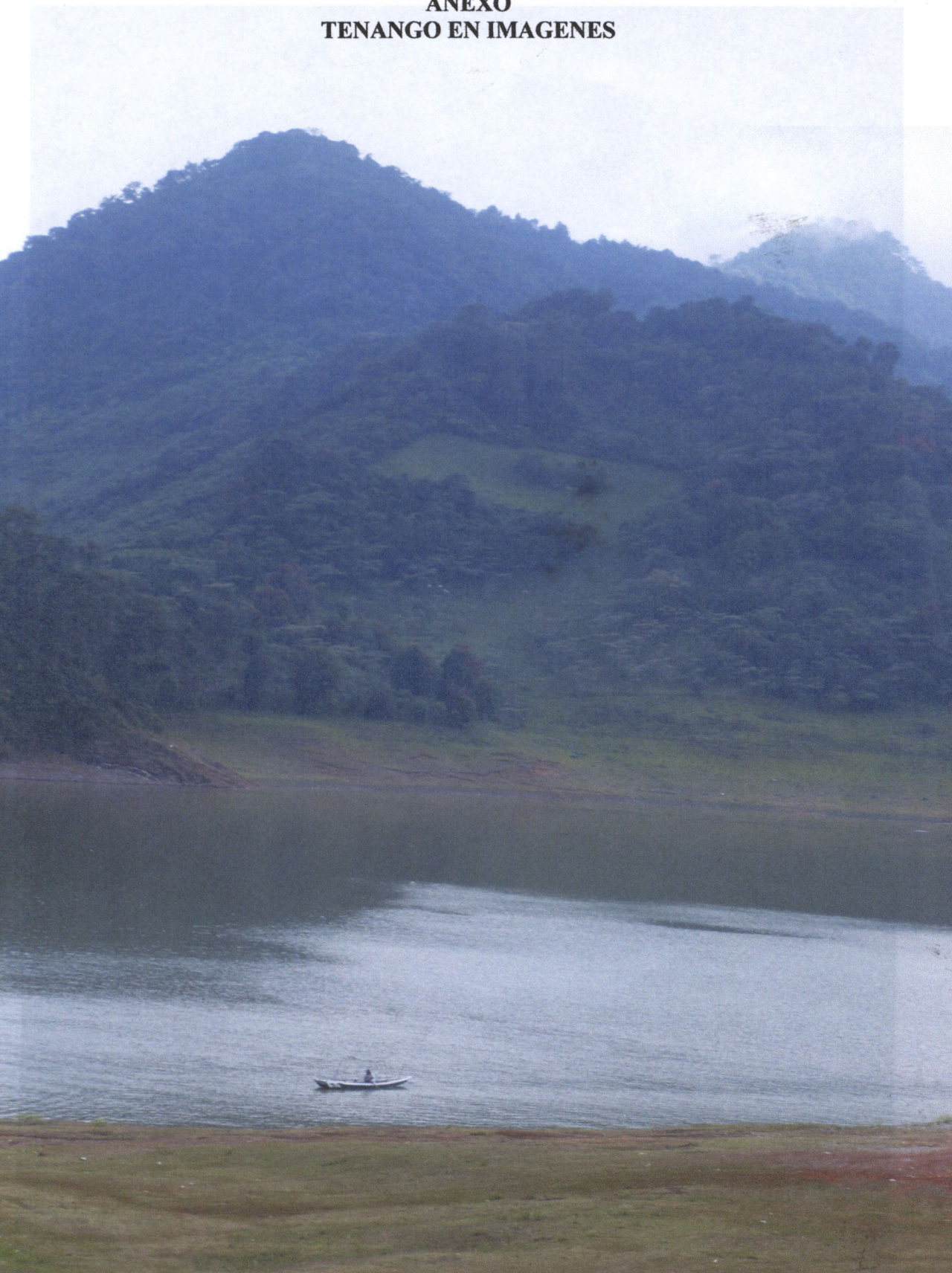
Presa de Tenango de las Flores