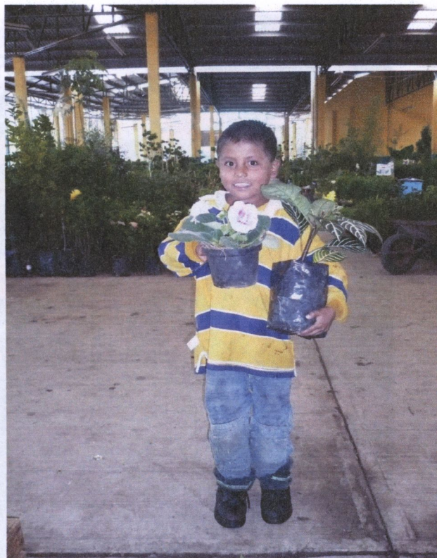
Niño "Carretillero" trabajador del mercado de las flores