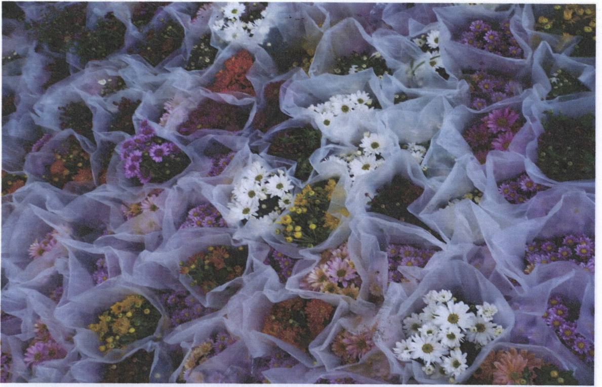
in vernalero de pino