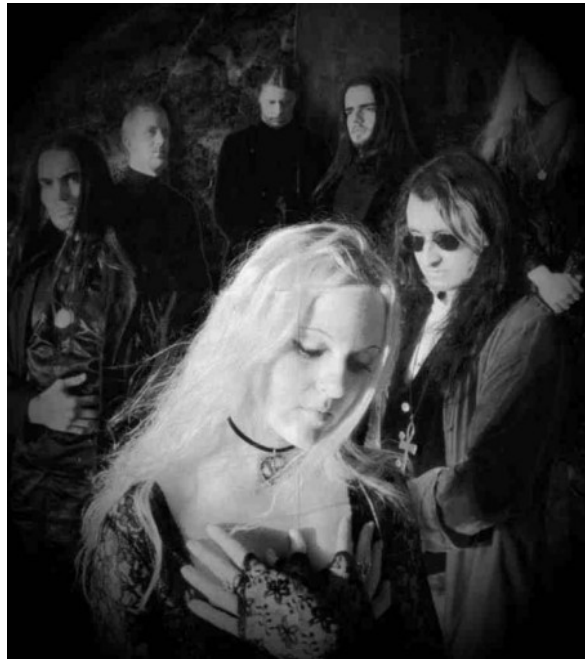
Grupo Theatre of the Tragedy,