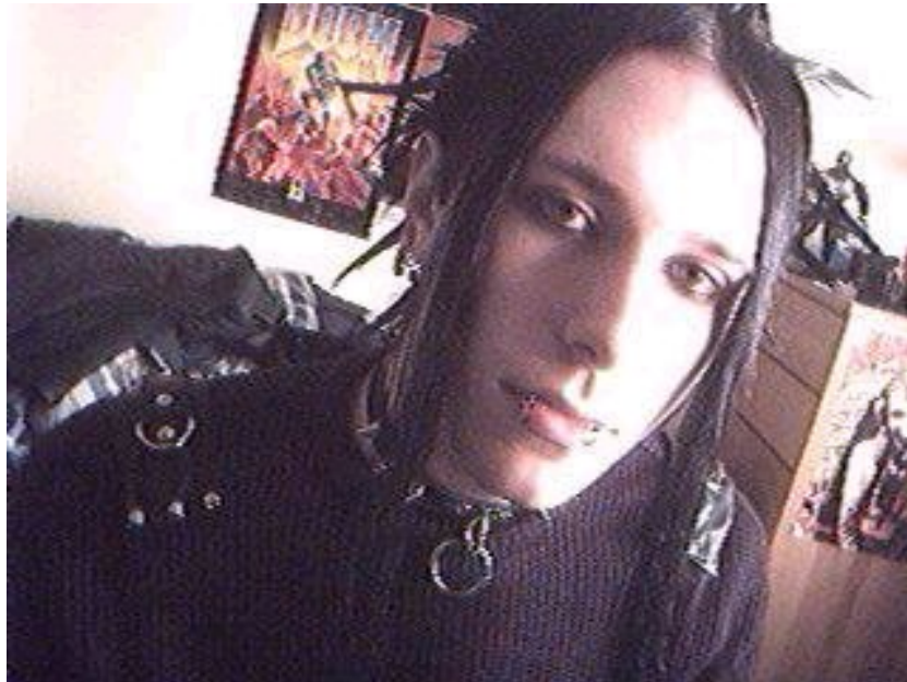
Gótico con perforaciones