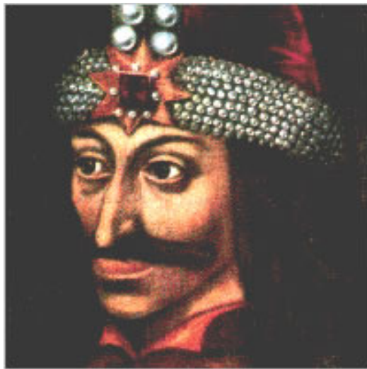
Vlad Teples (El Empalador)