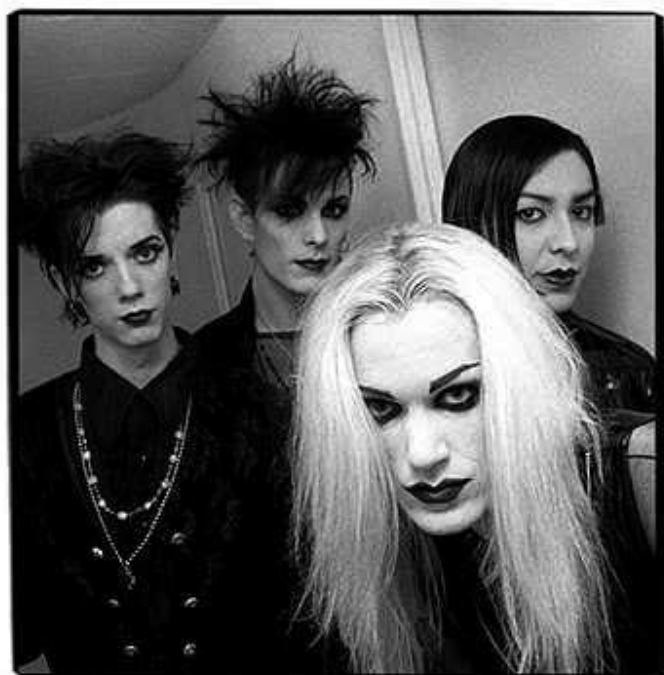
Banda London After Midnight