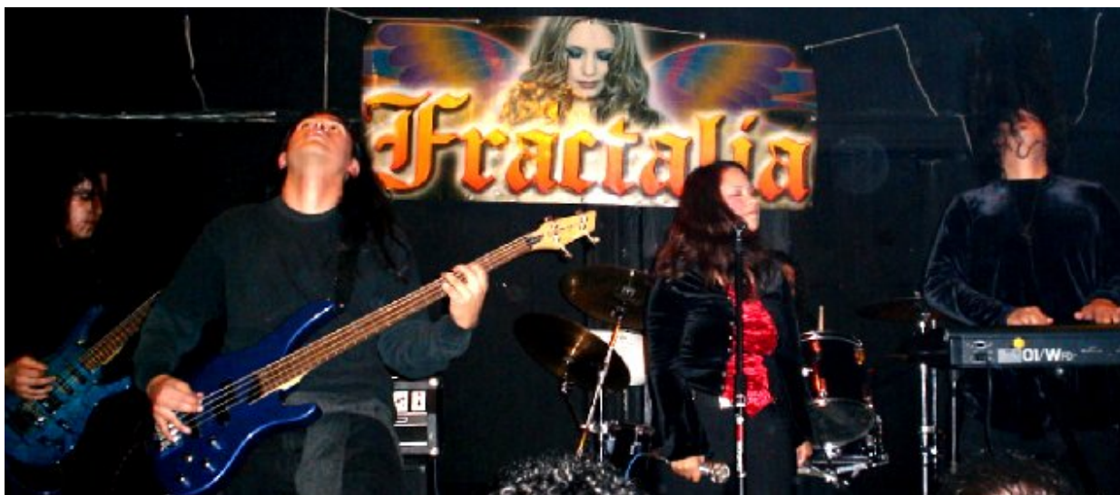
Ejemplo de una banda gótica mexicana