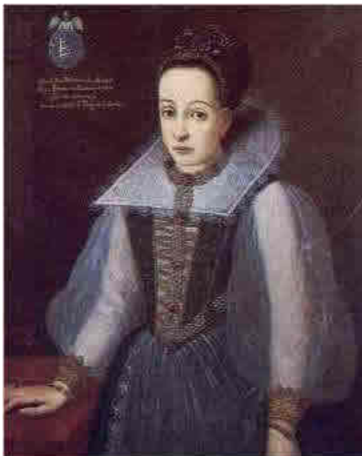
Elizabeth Bathory (1560-1614).