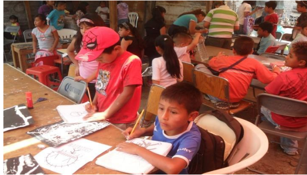
Imagen No. 5, niños en el curso de verano

visitamos (el módulo A), que en su totalidad era radicalmente priista. Conforme pasaba la investigación hubo mayor empatía con este módulo, a tal grado nos pusieron a dar clases en el curso de verano que se estaba impartiendo en ese momento.