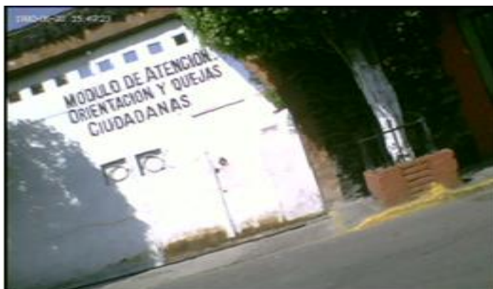
Imagen No. 4, módulo priista

Al entrar a este módulo, y al platicar el por qué estábamos y qué deseábamos en la colonia, se dio nuestro primer problema, ya que la secretaria nos cuestionó cuál era nuestro deseo de estar en este lugar y de qué constaba nuestra investigación educativa, obviamente le dijimos que la investigación constaba grosso modo de estudiar el uso y apropiación de las TIC en zonas marginales; al mencionar la palabra “zona marginal” la secretaria se molestó, en forma de enojo nos comentó que no quería que le llamáramos así, problema que después explicamos diciendo que ese calificativo no se los atribuíamos nosotros, más bien al buscar en internet acerca de zonas marginales nos apareció esta colonia catalogada como tal, ya que cuenta con exclusión social y falta de servicios públicos económicos.