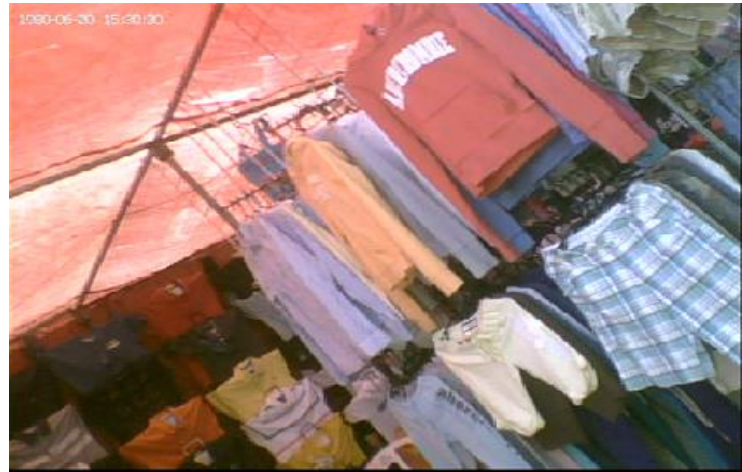
Imagen No. 14 y 15, tipo de ropa que compran los jóvenes en la colonia

Todo esto es lo que crea en ellos una identidad, o bien algo que los identifica, aunque sea vista como negativa para todos o para un gran sector de la gente en la colonia. “El consumo de la cultura ayuda a definir la identidad de los jóvenes” (Morduchowicz, 2008:9).