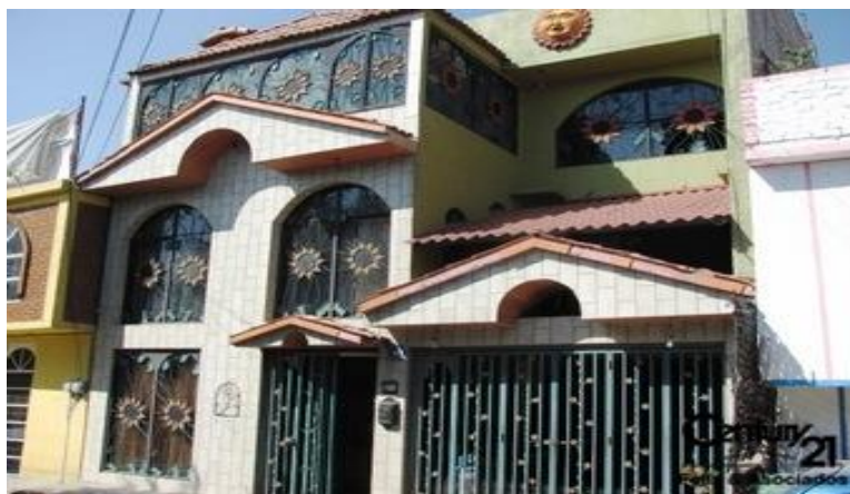
Imagen No. 2, casas lujosas en la colonia

Por el otro sector encontré algunas calles en la cual se ubican en su mayoría vecindades, casas de cartón, de láminas de asbesto, ventanas de madera, noté varias ocasiones que salían niños descalzos o sin ropa. Lo que hace comprobar aún más lo fragmentada que se encuentra la colonia, es decir, la colonia cuenta en sí misma con mucho dinero, no existe marginación económica, hay gente que tiene y goza de muchos privilegios socioeconómicos, pero la basura y su trabajo sobre ella no impide que ésta sufra gran marginación social e incluso haya desproporción en cuanto a las ganancias y recursos económicos que la gente obtiene. De alguna forma representa la condición social de México.