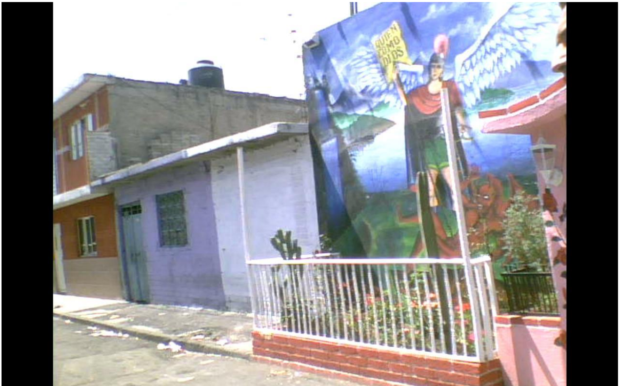
Imagen No.6, capillas religiosas en la colonia

El tema de la religión desde mi punto de vista es muy interesante y se da de una forma peculiar en la colonia, ya que existe una excesiva religiosidad por parte las personas en ésta y de alguna forma toma un rol importante en el desarrollo de la gente en ésta. “Al igual que la cultura, la religión afecta prácticamente todos los aspectos del ser humano” 2 .