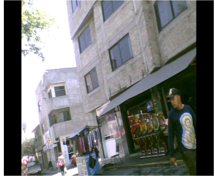
Imagen No. 16 y 17, jóvenes reggaetoneros.

Otro de los sustentos de la cultura popular en los jóvenes de la “Reno”, y por obvias razones, es su música. “La música es el consumo más valorado por los jóvenes. Es la principal marca de identidad y el principal indicador del paso de la infancia a la adolescencia. El carácter portátil, su ubicuidad y su accesibilidad (el bajo costo) hacen de la música un consumo esencial para ellos” (Morduchowicz, 2008:65). Y como ya mencionaba anteriormente, el reggaetón es lo que más se escucha entre los jóvenes, y la cual es parte esencial de esa cultura popular .