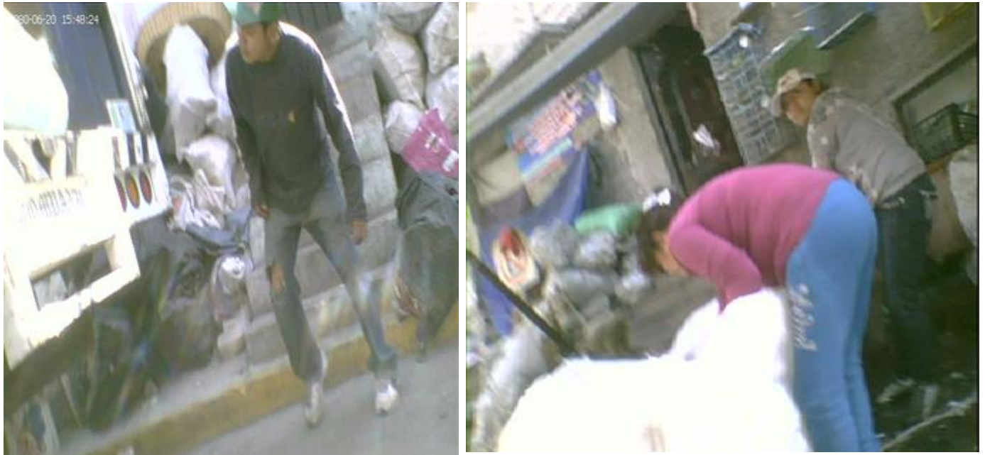
Imagen No. 12 y 13, jóvenes trabajando con la basura

Dado lo anterior, la gente de la colonia, en especial los jóvenes, encuentran en esta actividad una opción inmediata y fácil para trabajar y obtener dinero, reitero principalmente los jóvenes porque la gente adulta toda su vida ha laborado en esto y no busca por lo regular más opciones, aunque cabe mencionar que existen más actividades laborales en la colonia, pero ésta de alguna forma la consideran como la solución principal o más fácil para poder conseguir dinero, ya que entre ellos consideran este trabajo como sencillo, “pues no tiene nada de difícil sólo desarmar o escoger basura” (Luis). Otra opción entre los jóvenes es dedicarse al robo, secuestro etc., pero eso lo ahondaré en el siguiente capítulo.