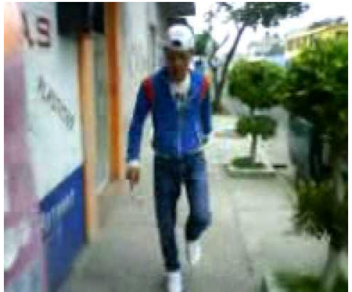
Imagen No. 18 y 19, otro ejemplo de reggaetoneros, no hay distinción de género

Ahora bien, entrando al campo del internet, el uso de éste, hoy en día y más que nunca se le ha utilizado para un sin fin de cosas, estas ciertas utilidades principalmente dependen de los intereses personales de la gente que los consume, es decir, muchos lo pueden utilizar para cuestiones educativas, como pueden ser tareas, investigaciones etc., otros tantos como parte esencial para fortalecer o compartir rasgos identitarios con otras personas, es decir, bajar videos, chatear, visitar su facebook, luego entonces, el conocimiento que se tenga sobre una computadora y el uso del internet parte del conocimiento que se tenga sobre éstos, principalmente se enfoca en los intereses personales de cada persona, en este caso de los jóvenes.