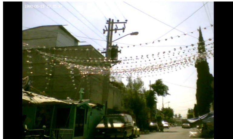
Imagen No. 7 y 8, más capillas católicas en la colonia