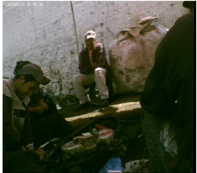
Imagen No. 9 y 10, personas laborando con la basura

Mucha gente suele, o bien solemos pensar que la basura, ya no puede tener alguna utilidad, para ellos, lo de la “Reno”, no es así, todavía le dan por así decirlo una nueva fase de vida y con ello un doble valor, ya que con su trabajo le dan valor. En sí la basura pasa de su última fase de vida social a volverse mercancía.