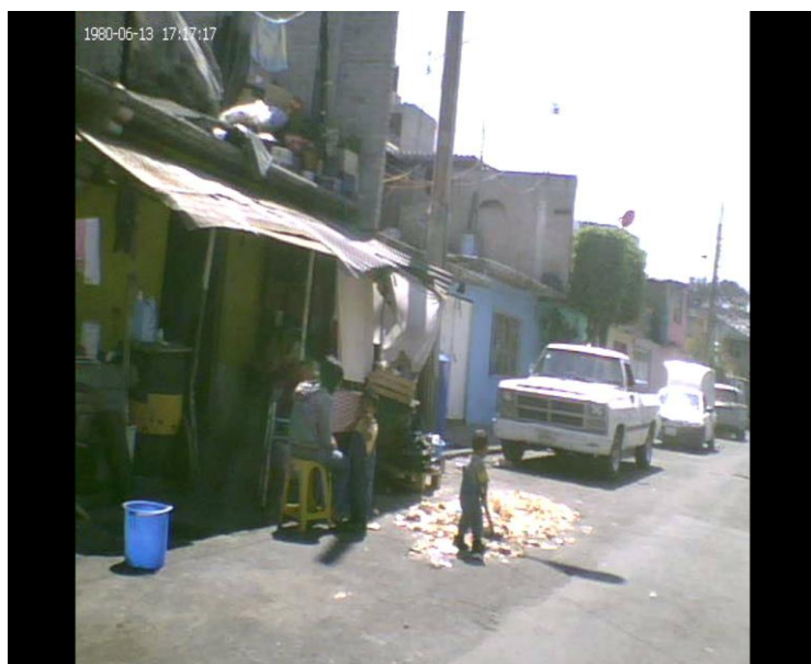
Imagen No. 3, casas de bajos recursos en la colonia.

Por el otro sector encontré algunas calles en la cual se ubican en su mayoría vecindades, casas de cartón, de láminas de asbesto, ventanas de madera, noté varias ocasiones que salían niños descalzos o sin ropa. Lo que hace comprobar aún más lo fragmentada que se encuentra la colonia, es decir, la colonia cuenta en sí misma con mucho dinero, no existe marginación económica, hay gente que tiene y goza de muchos privilegios socioeconómicos, pero la basura y su trabajo sobre ella no impide que ésta sufra gran marginación social e incluso haya desproporción en cuanto a las ganancias y recursos económicos que la gente obtiene. De alguna forma representa la condición social de México.