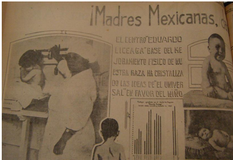
Figura 4. “¡Madres da a la Patria Niños Sanos!” en El Universal

-¡No!- contestaríamos con aquella voz del milagro, -¡No! La Miseria no es la causante. Es la Ignorancia. 121