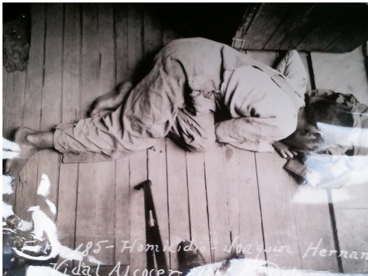
Imagen 1. Expediente 12451, Caja 43, año 1937, CTM. Son pocas las imágenes que disponemos de los niños y jóvenes que llegaron al Tribunal para Menores, pero en esta fotografía podemos percatarnos de la vestimenta que pudieron haber portado algunos de ellos. El overol y la camisa se ven gastados y el menor se encontraba sin zapatos.

Por tal motivo, es interesante analizar los casos de los menores que fueron presentado al Tribunal acusados de vagos, malvivientes o sospechosos. De una selección de expedientes a partir de abril de 1936 406 de menores acusados de vagos, malvivientes o sospechosos, tenemos el registro de 37 casos. Trece de ellos fueron enviados directamente a la Escuela de Orientación para Varones sin que se les realizara el estudio social. Al parecer esto se debió a sus antecedentes, es decir, que habían sido prófugos de la Casa o Escuela de Orientación o del Tribunal. Otros doce fueron regresados a su hogar debido a que habían sido aprendidos y acusados falsamente. Cinco