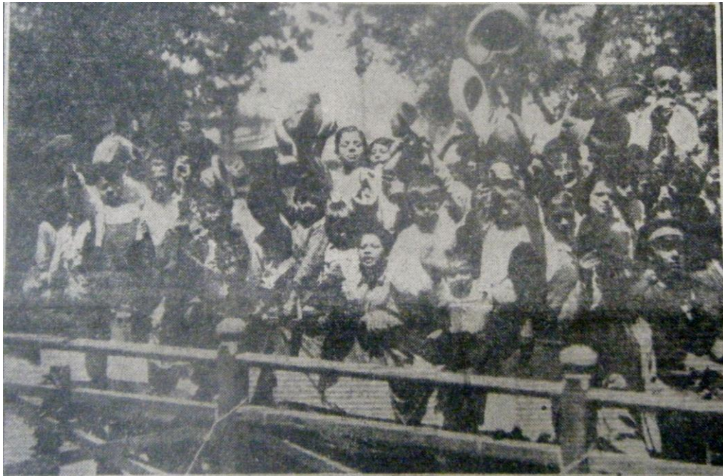
Figura 2. “Fiesta del Niño Pobre” en El Universal .

Había entre los asilados un grupo de niños vestidos con trajes de marineros. Las mujercitas calzadas. Ellos los hombres casi todos descalzados (...). La penuria del Estado ha impedido sin duda cubrir los pies de aquellos desheredados. Estamos en tiempos de aguda crisis. 102