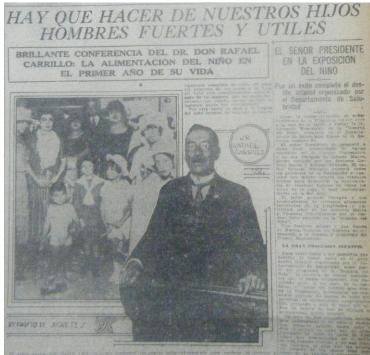
Figura 1. “Hay que hacer de nuestros hijos hombres fuertes y útiles” en El Universal .

crianza de sus hijos.” 96 Por lo tanto, de inculcarles ciertas nociones de limpieza, orden y disciplina. Con ello aspiraban a “remoldear” 97 y “remoralizar” 98 al pueblo, de eliminar costumbres o hábitos de los padres de familia que se consideraban como causantes de la mortalidad infantil y de la degeneración de la “raza” tanto física como moralmente, como era la costumbre de darles pulque a los bebés.