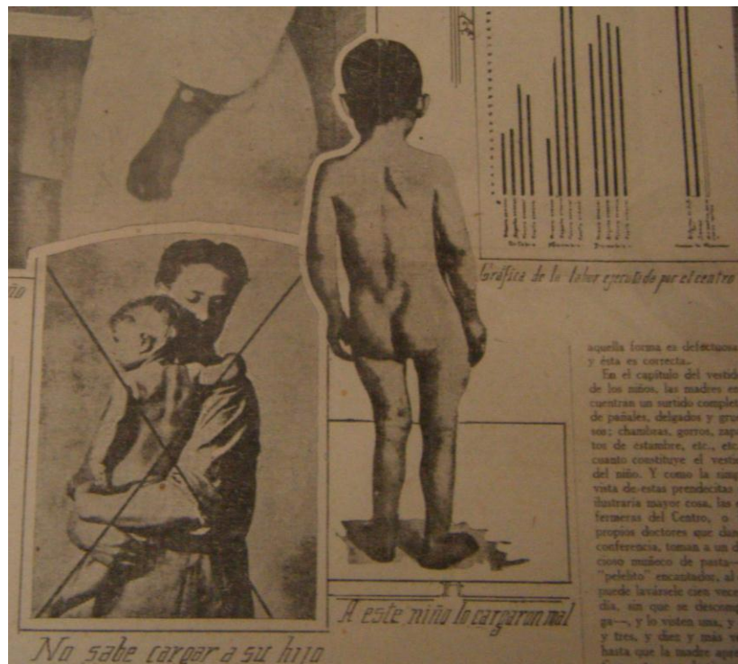
Figura 5. ¡Madres da a la Patria Niños Sanos!” en El Universal .