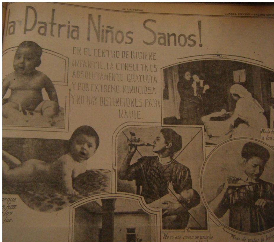
Figura 6. ¡Madres da a la Patria Niños Sanos!” en El Universal