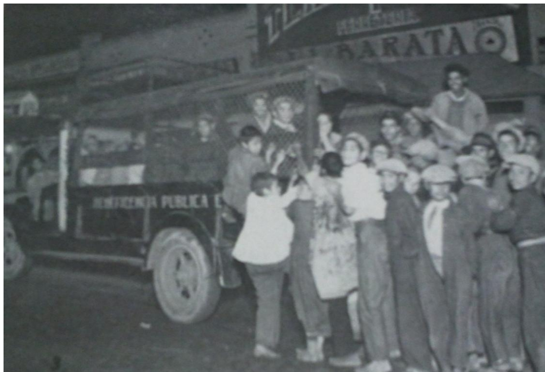
Figura 1. Niños sin hogar que dormían en el arroyo. Abordando el automóvil de la Beneficencia Pública para dirigirse al Dormitorio, Rómulo Velasco, El Niño mexicano...

noche, la merienda se servía a los ocho, y eran levantados a las cinco de la mañana en primavera y a las seis en período de invierno. 306