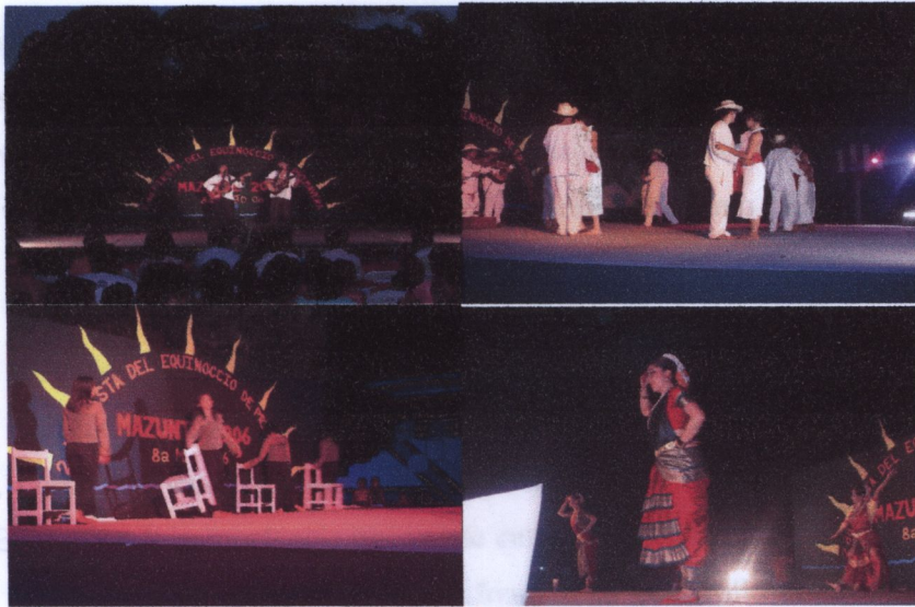
Fotos: "Fiesta del equinoccio en Mazunte. 2006" Berenice Basurto, Marzo 2006.

Hubo una escasa participación de la gente mazunteña en estos eventos. La razón fue, por un lado, de carácter religioso, pues se relacionó la Fiesta de Equinoccio de Mazunte con el Festival del Año Solar Prehispánico, por lo que fue considerada por algunas personas de la comunidad como profana: