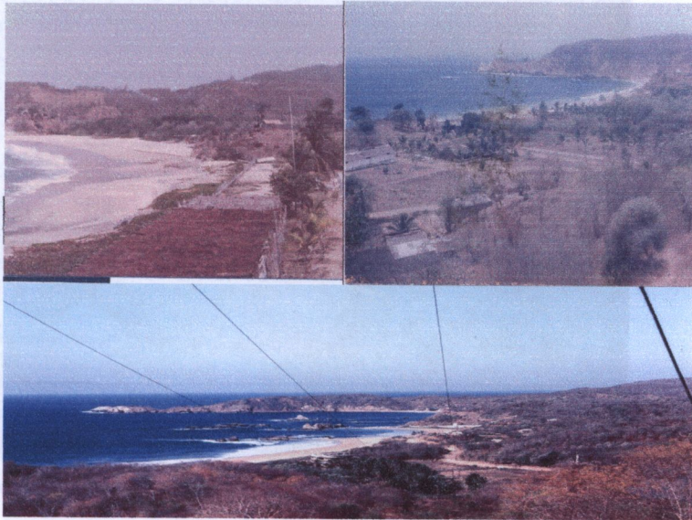
Fotos tomadas por Cuahutemoc Peñaflores. 1975. (Fecha aproximada.)

A continuación se presentan algunas fotografías tomadas por el biólogo Cuahutemoc Peñaflores, investigador del Centro Mexicano de la Tortuga. En ellas se observan una panorámica de Mazunte y San Agustín en los años 70's, que se contrastará con una fotografía de 2005 en la que se intenta enmarcar la misma perspectiva para dar una idea del impacto a nivel ecológico, visual y paisajístico, en la actualidad.