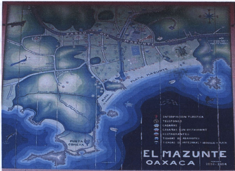
Mapa de Mazunte. Mayo 2005.

calle para acceder a la playa –actualmente llamada calle “Golfina”–. Con el paso del tiempo –no hay registro de la fecha aproximada- se abrieron dos calles más con el objeto de facilitar el paso del turismo a las playas Principal y a la playa Rinconcito –actualmente calle “Carey” y calle “Del Rinconcito”, respectivamente–. El agente municipal dice que hoy en día se están abriendo muchas calles, sobre todo en la parte norte del pueblo, debido a que se está comenzando a lotear y se está respondiendo a una necesidad de delimitar y bardear hogares y negocios.