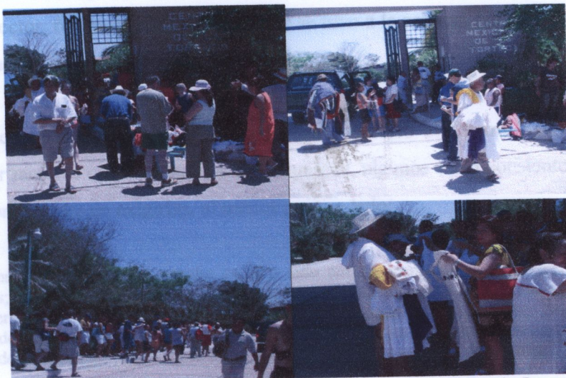
Fotos: "Afluencia turística y amulantage en el Centro Mexicana de la Tortuga". Berenice Basurto. Febrero 2006.

Se debe tener en cuenta que estas cifras no incluyen a los visitantes menores de 6 años y mayores de 60, tampoco considera a las personas con capacidades diferentes ni a los habitantes de las comunidades cercanas, para quienes la entrada es libre. El director del Centro estima que con ellos sumarían, aproximadamente, 110, 000 visitantes al año.