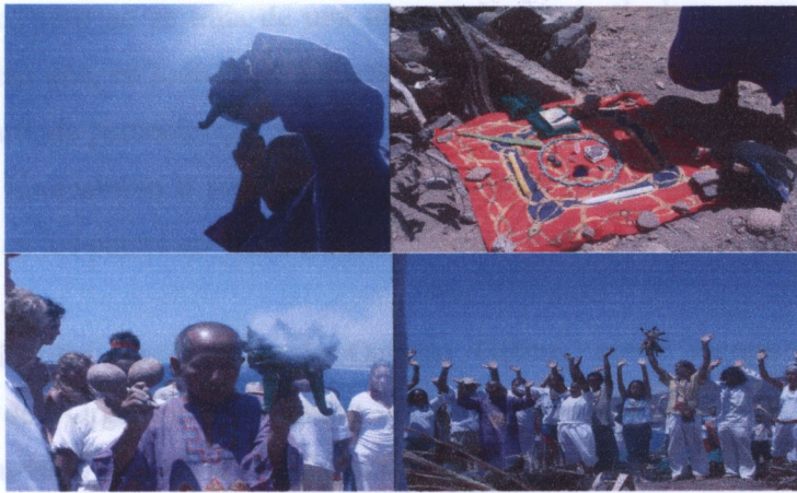
Fotos: "El equinoccio en Punta Cometa" Berenice Basurto. Marzo 2006.

La mayor asistencia fue de turistas, avecindados o gente de otros lados de la costa; incluso llegaron personas de Puerto Escondido, de Pochutla, de Jamiltepec y de varios lugares de donde provenían los grupos de danza de la costa que se presentarían en el festival. Asistió mucha gente de los alrededores, tanto nacionales como extranjeros.