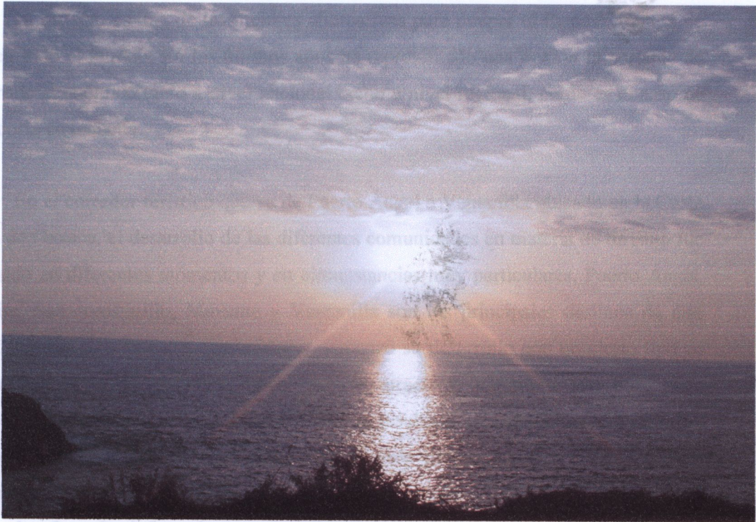
Foto: Puesta de sol en Mazunte. Desde Punta Cometa. Berenice Basurto. Mayo 2005.

se brindan formal e informalmente. Desde Puerto Ángel, que fue el primer sitio turístico del corredor, en desarrollarse –su orientación turística data aproximadamente desde los años cincuentas-, cuenta con mucha mejor infraestructura y superestructura que los demás sitios del corredor; Zipolite se ha consolidado por ser la única playa nudista en México; San Agustínillo, quien comparte con Mazunte la historia de su conformación, su desarrollo turístico es más reciente que el de Mazunte. En cuanto a esta última comunidad, su desarrollo turístico despegó a finales de los ochentas y principio de los noventas; aquí se pretende atraer a un tipo de turismo que disfrute sus atractivos naturales, pero que al mismo tiempo ayude a la conservación de los mismos. Ventanilla se ha consolidado como uno de los mejores proyectos de ecoturismo y en la actualidad es todo un ejemplo a seguir en cuanto a la organización en la planeación de la cooperativa que en la actualidad maneja el turismo en esta comunidad. Cada una de estas comunidades cuenta con infraestructura y superestructura diferenciada y proyectos turísticos que permiten filtrar, de alguna manera, el flujo turístico en la comunidad receptora.