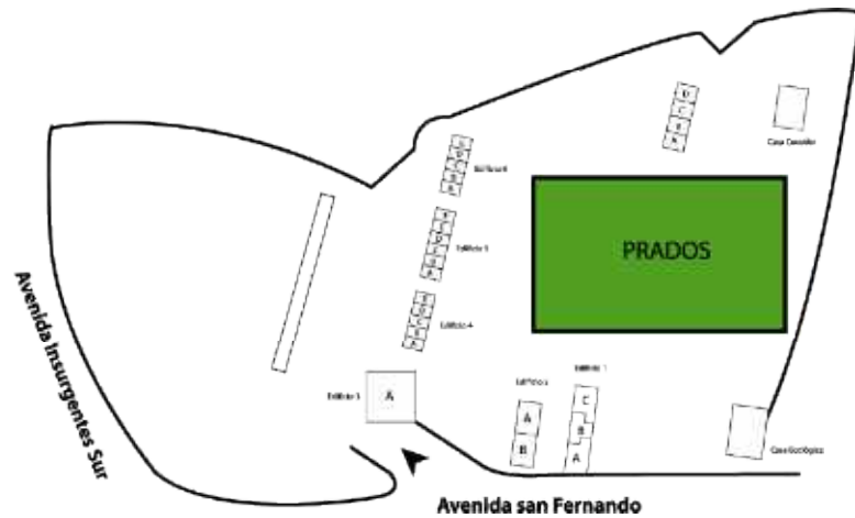
Estructura del Parque Ecológico Loreto y Peña Pobre.

Para ejemplificar los costos inaccesibles para la mayoría de la población, describiré con mayor detalle dos talleres que durante mi investigación tuvieron mayor actividad: