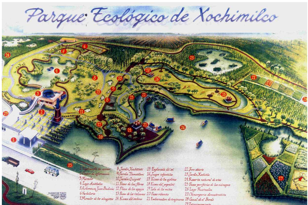
Estructura del Parque Ecológico de Xochimilco.

Además se rentan bicicletas, cuya tarifa es de $15.00 por 30 minutos; recorridos en el tren turístico, con un costo de $10.00 por persona por 10 minutos; la renta para un cuadriciclo para cuatro personas es de $35.00 por 30 minutos; el cuadriciclo para dos personas tiene un precio de $25.00 por 30 minutos; la renta de lanchas de pedales para dos personas tiene un valor de $30.00 pesos por 30 minutos y para dos adultos y dos niños cuesta $40.00 por 30 minutos; la renta para una trajinera tiene un costo de $126.00 y puede subir hasta 14 personas por 60 minutos.