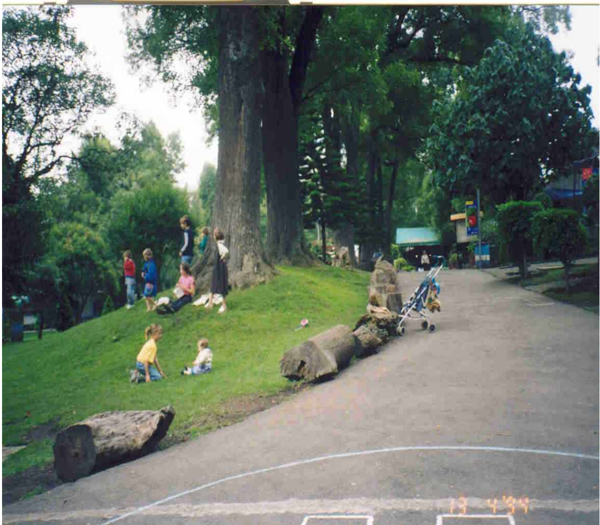
Niños jugando en los prados del "Parque Ecológico Loreto y Peña Pobre"