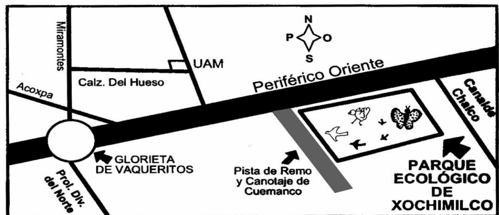
Mapa de Ubicación del Parque Ecológico de Xochimilco

En 1987 Xochimilco fue declarado patrimonio de la humanidad por la UNESCO, desde entonces fue escenario de un plan de rescate ambiental. El rescate ecológico de Xochimilco abarca sobre 3 mil hectáreas una amplia gama de temas: preservación histórica, restauración hidráulica con plantas de tratamiento de aguas, mantenimiento ecológico, limpieza y dragado de 140 kilómetros de canales y lagunas. Ese rescate ecológico dio origen al Parque Ecológico de Xochimilco, que abrió sus puertas en 1993; se localiza en periférico oriente número 1, colonia Ciénega Grande, delegación Xochimilco, en la Ciudad de México.