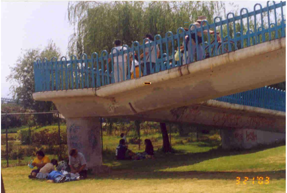
Puente que atraviesa periférico oriente para llegar al Parque Ecológico de Xochimilco.