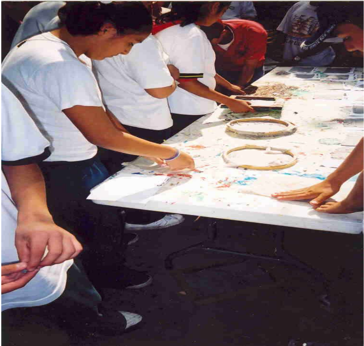
Elaboración de papel en el taller "Fundación el Manantial"