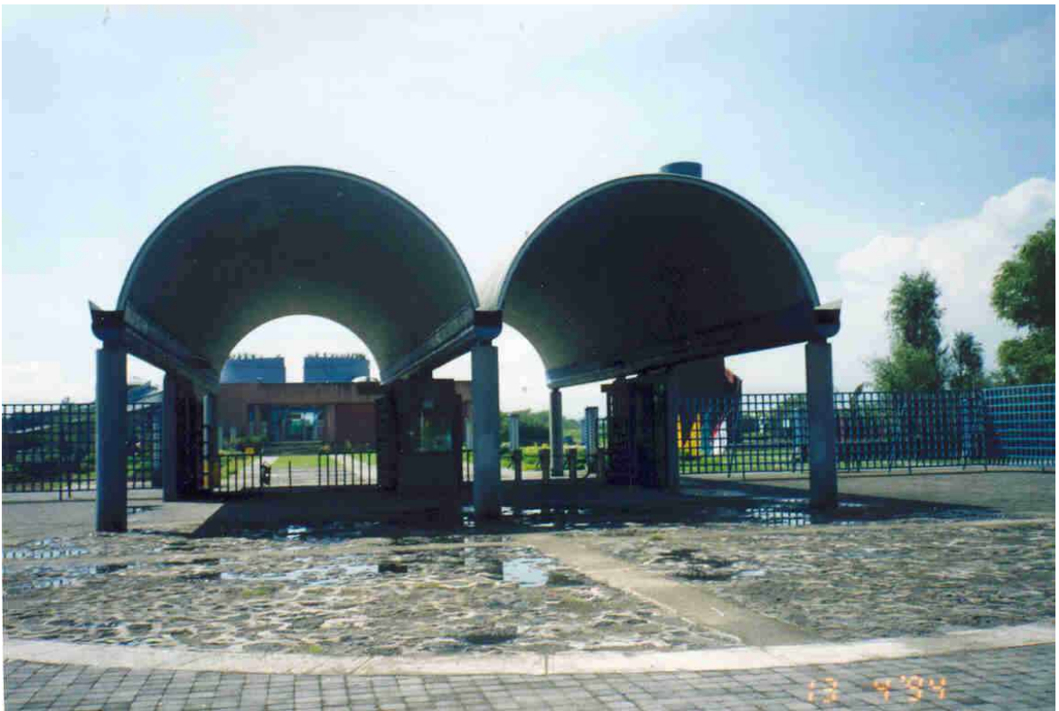
Entrada al Parque Ecológico de Xochimilco