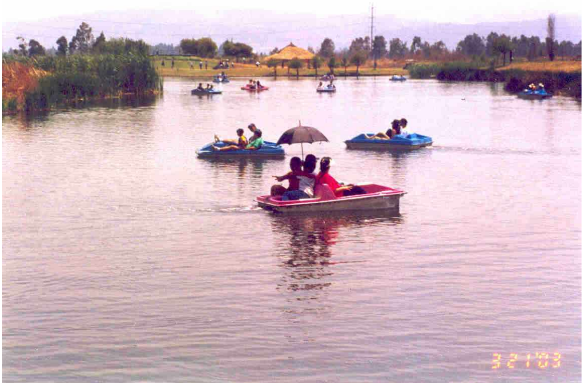
Lago de las lanchas de pedal en el Parque Ecológico de Xochimilco