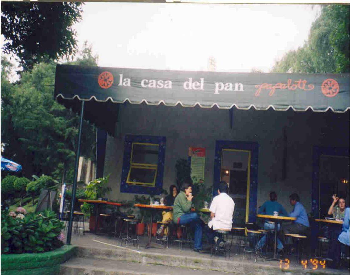
Una tarde en la cafetería "Casa del pan"