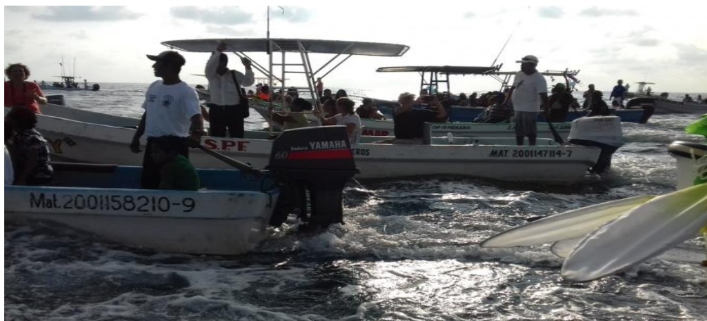
Fotografía 42: Te invitó a mi lancha

Solamente un lanchero puede estar parado de esta manera, ya que las olas del mar no permiten que ningún turista pueda imitarlo. Archivo personal 18 de diciembre de 2015.