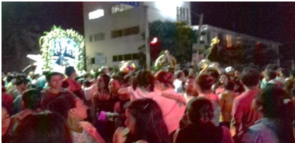
Fotografía 37: A madrugar que la fiesta sigue

El convite por la 3era poniente. Archivo personal 16 de diciembre de 2015.