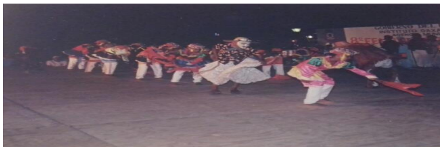
Fotografía 24: Octavo Festival costeño de la danza.