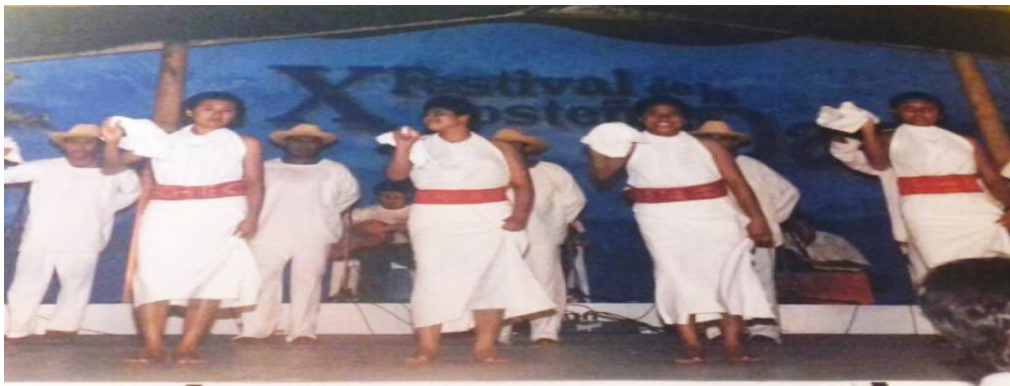
Fotografía 27: Bailando el son chileno.