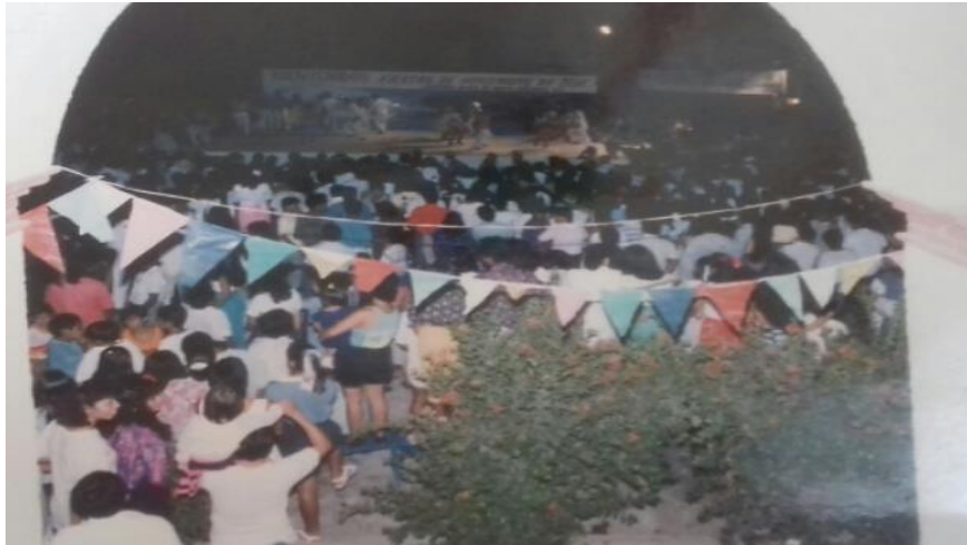
Fotografía 19: Fiestas de noviembre de 1991

Inician las fiestas de noviembre en la agencia municipal de San Pedro Mixtepec.