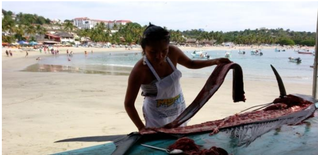
Fotografía 34: Fileteando

Las mujeres filetean el pescado y lo dejan dispuesto para su preparación. Archivo personal 13 de diciembre de 2015.