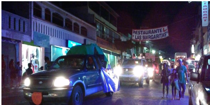
Fotografía 48: Desfile de carros alegóricos

La llegada de los 13 carros alegóricos a la agencia municipal, desde la 3era. poniente. Archivo personal 13 de febrero de 2016.