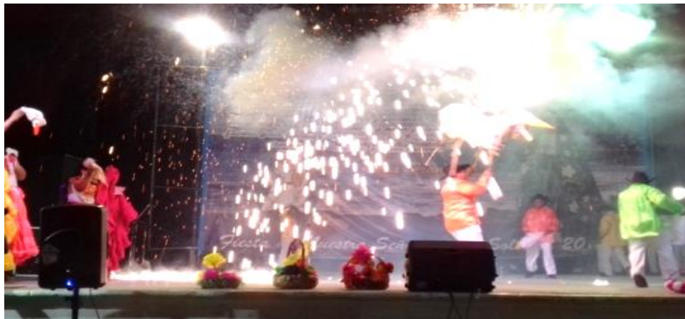
Fotografía 38: El torito se quema

En el escenario del evento sociocultural se queman toritos. 17 de diciembre de 2015.