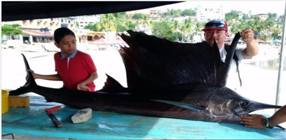
Fotografía 32: Mostrando la captura

Durante el torneo de la Virgen de la Soledad, se debe capturar la mayor cantidad de especies, para ser cocinadas el 18 de diciembre en la comida comunitaria. Archivo personal 13 de diciembre de 2015.