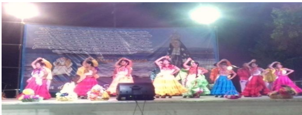
Fotografía 8: "bailando a ritmo de chilenas" 17 de diciembre de 2015.

El evento empieza con bailables de la región, similar al festival costeño de la danza, pero éste es más pequeño y no cuenta con la producción y logística del festival. El grupo de danza de la casa de la cultura deleita a los presentes con bailables de la región de Santos Reyes Nopala, Rio Grande y Puerto Escondido y la banda de música toca en vivo en el escenario. Los espectadores desde sus asientos fotografían el momento.