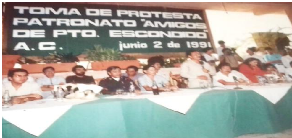
Fotografía 4: "Amigos de Puerto Escondido"

Los organizadores de las fiestas se nombraban amigos de Puerto Escondido, que más tarde formalizaron la asociación con el mismo nombre, esta empezó a incorporar a más integrantes que aportaron nuevas ideas al proyecto. Fue así que en 1991 se toma protesta de la Asociación Amigos de Puerto Escondido A.C. La siguiente fotografía lo muestra.