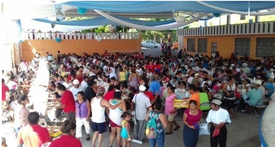
Fotografía 40: Degustando en colectivo

Después de la misa se invita a los asistentes la comida comunitaria. Archivo personal 18 de diciembre de 2015.