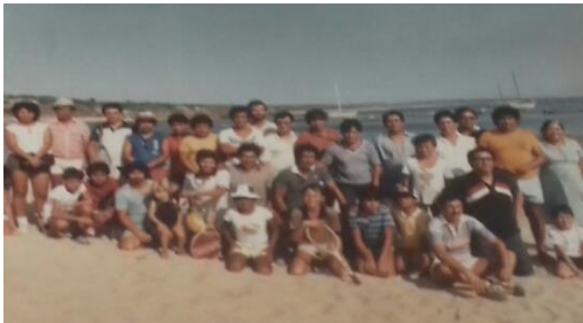
Fotografía 20: Foto del recuerdo

Inician las fiestas de noviembre en la agencia municipal de San Pedro Mixtepec.