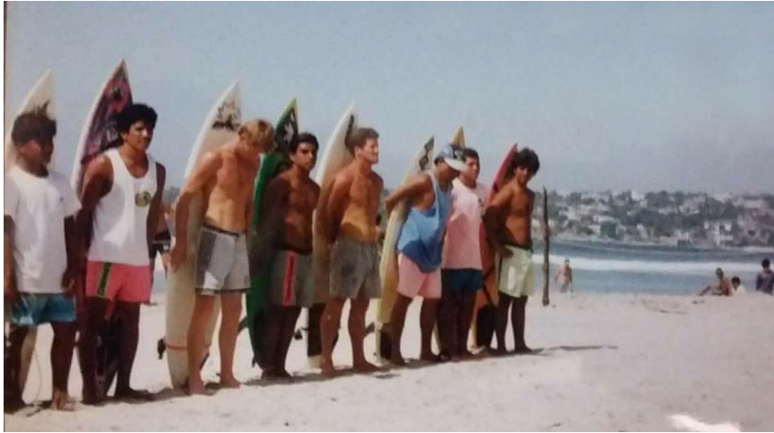
Fotografía 11: Posando para los fotógrafos

Los surfistas son fotografiados con sus tablas de surf , durante los cuartos de final en las fiestas de noviembre en Playa Zicatela. Archivo personal de José Francisco Samperio Esquivel aproximadamente 1993.