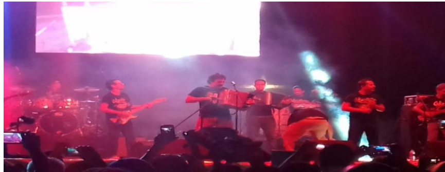
Fotografía 23: Cumbia del río

Al ritmo del acordeón, Celso Piña clausura las fiestas de noviembre en playa Zicatela. 29 de noviembre de 2015.