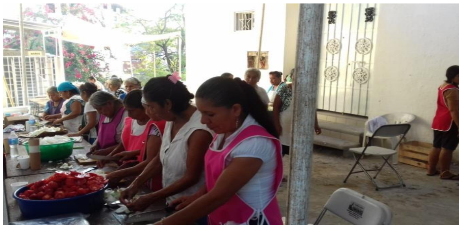
Fotografía 39: Cocinando en colectivo es mejor

En el escenario del evento sociocultural se queman toritos. Archivo personal 17 de diciembre de 2015.