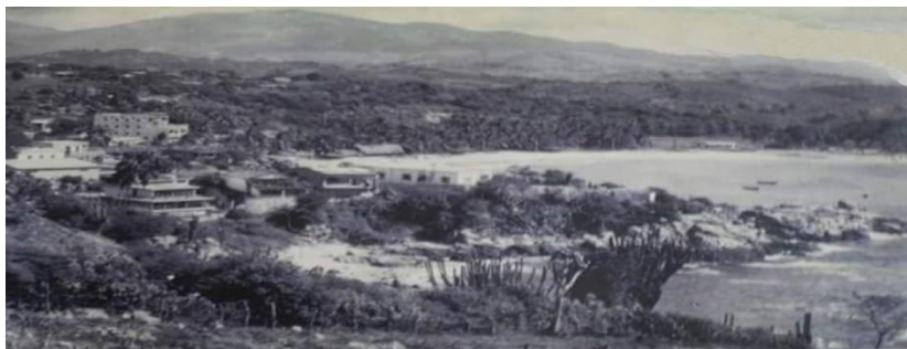
Fotografía 2 32