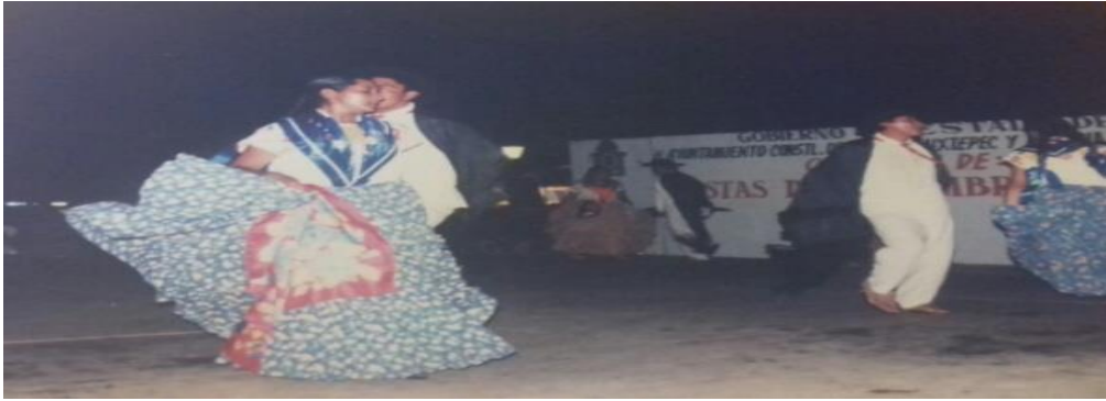
Fotografía 26: ¿Qué suenen los tacones?