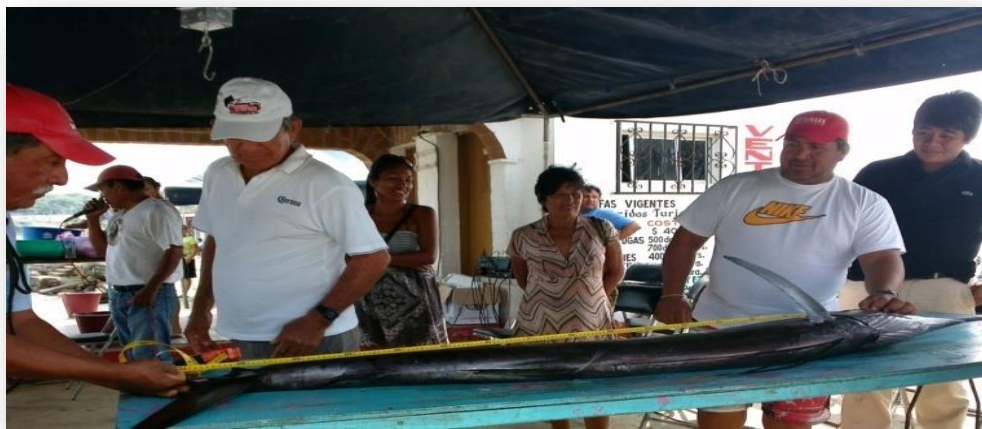
Fotografía 33: La buena captura debe de ser medida

Durante el torneo de la Virgen de la Soledad, se debe capturar la mayor cantidad de especies, para ser cocinadas el 18 de diciembre en la comida comunitaria. 13 de diciembre de 2015.