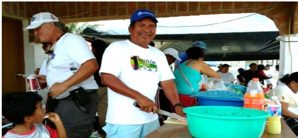
Fotografía 35: Cocinando las tiritas

Las mujeres filetean el pescado y lo dejan dispuesto para su preparación. 13 de diciembre de 2015.