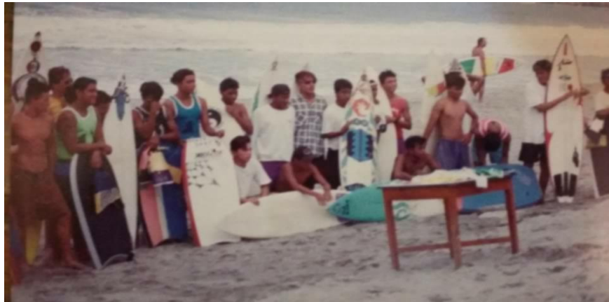
Fotografía 12: Foto general

Los surfistas son fotografiados con sus tablas de surf , durante los cuartos de final en las fiestas de noviembre en Playa Zicatela. Archivo personal de José Francisco Samperio Esquivel aproximadamente 1993.