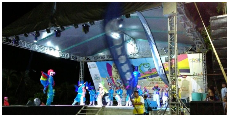
Fotografía 49: Presentación de la comparsa Corona culminó al ritmo del tambor. Agencia Municipal

La llegada de los 13 carros alegóricos a la agencia municipal, desde la 3era. poniente. Archivo personal 13 de febrero de 2016.