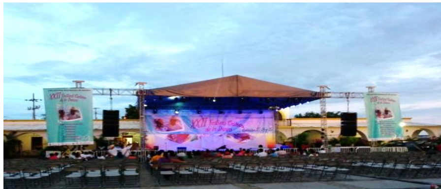
Fotografía 29: El escenario

Encontramos un escenario vacío antes del inicio XXII Festival costeño de la danza. 13 de noviembre de 2015.