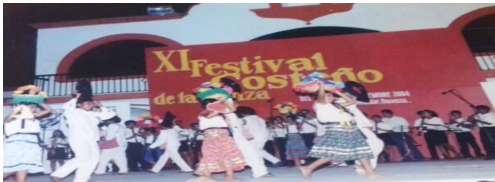
Fotografía 28: Las canasteras.