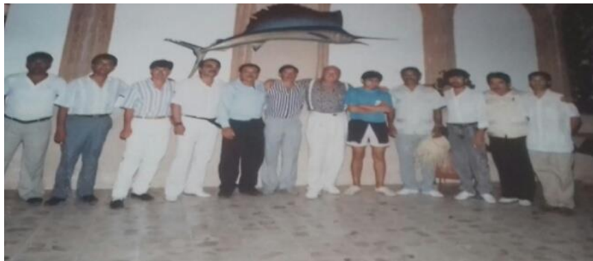
Fotografía 18: El comité organizador