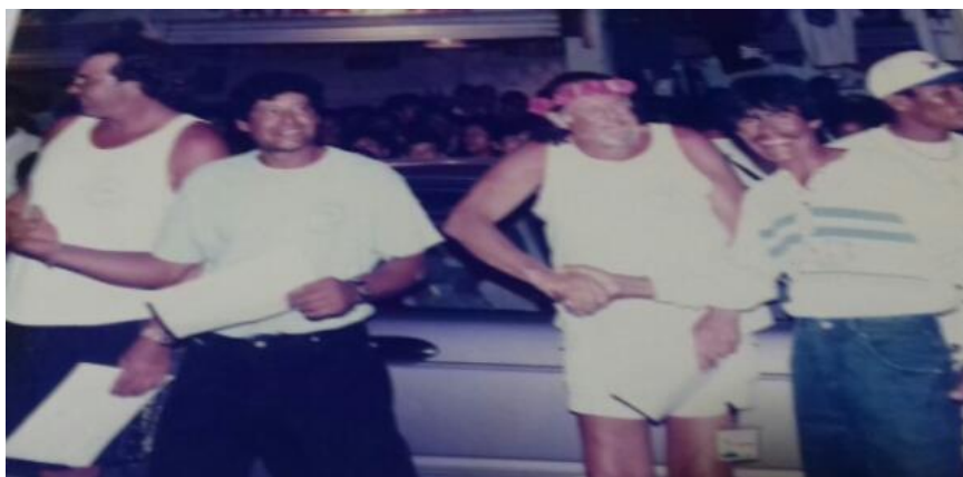
Fotografía 16: El primer carro

Aquí se puede observar uno de los primeros eventos de pesca deportiva, cuando se realizaba frente al restaurante "Los Crotos" ubicado en el Adoquín.