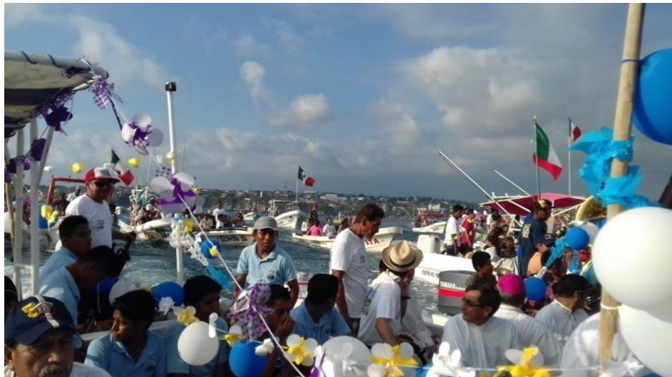
Fotografía 41: Procesión al mar

Después de la misa se invita a los asistentes la comida comunitaria. 18 de diciembre de 2015.