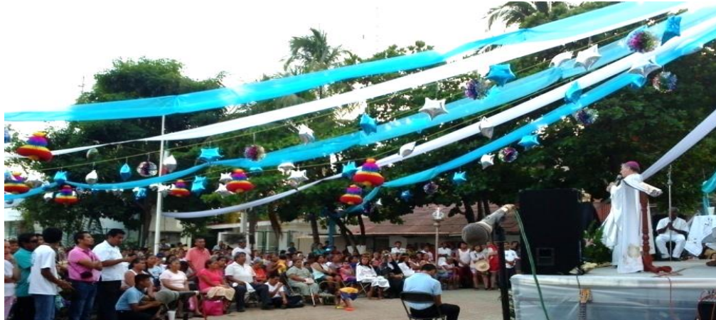
Fotografía 44: El final de un inicio

En la última actividad de la festividad, la misa en la Bahía Principal. 18 de diciembre de 2015.