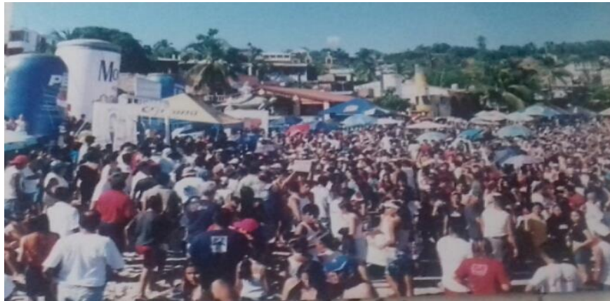
Fotografía 17: El torneo en pleno apogeo

El torneo internacional de pesca deportiva en la Bahía Principal, esta imagen muestra la presencia de los patrocinadores más famosos del programa.