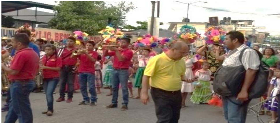
Fotografía 7: "Anunciando el inicio de la fiesta". 16 de diciembre del 2015.

escuchan las zapateadas que se dan por las chilenas que son tocadas, mientras otros toman fotografías.