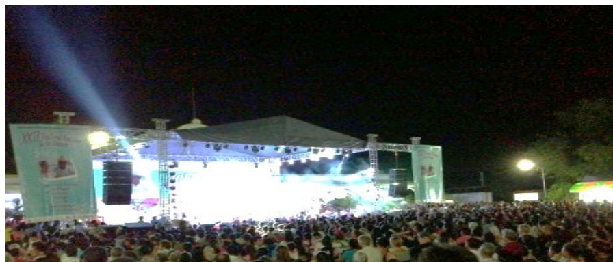
Fotografía 30: La presentación al público

Encontramos un escenario vacío antes del inicio XXII Festival costeño de la danza. 13 de noviembre de 2015.