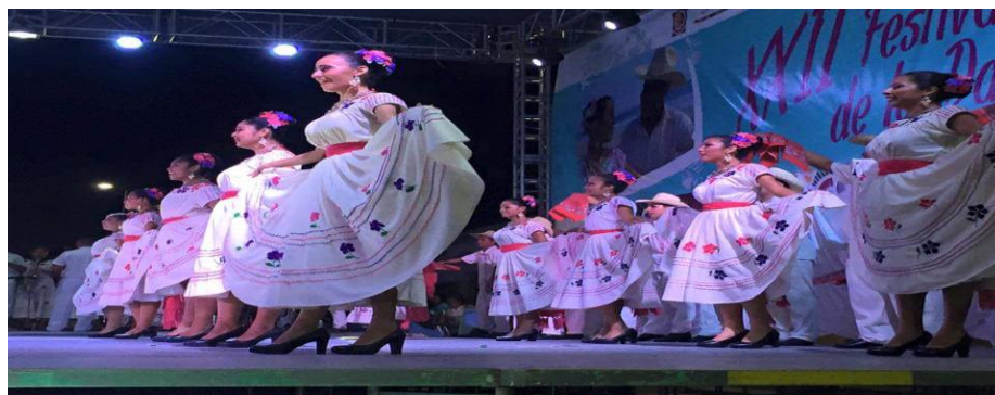
Fotografía 31: Chilena de Puerto Escondido

Más de 14 mil personas en la explanada de la agencia municipal observando el XXII Festival costeño de la danza. 14 de noviembre de 2015.