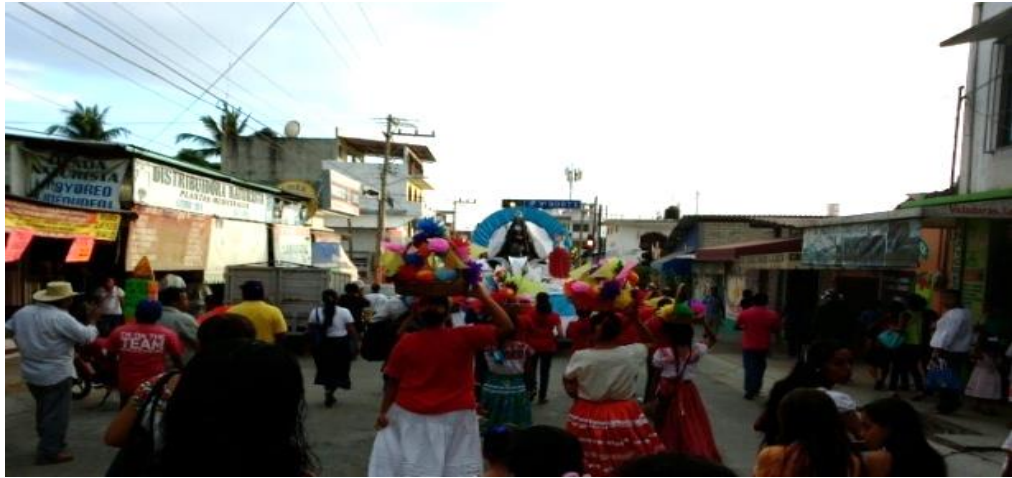
Fotografía 36: Los colores del convite

El convite por la 3era poniente. Archivo personal 16 de diciembre de 2015.