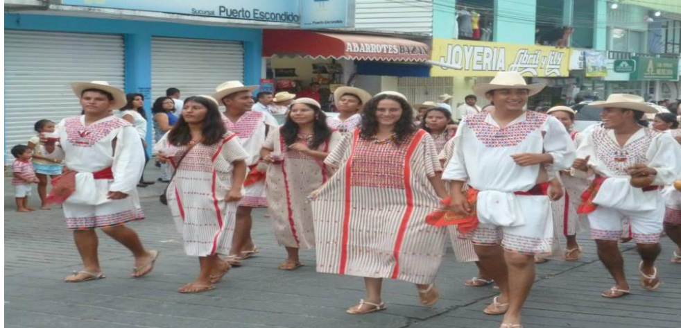
Fotografía 6: "calenda del Fandango Costeño 2015" 148