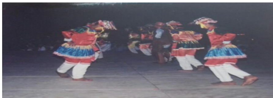
Fotografía 25: A bailar se ha dicho.