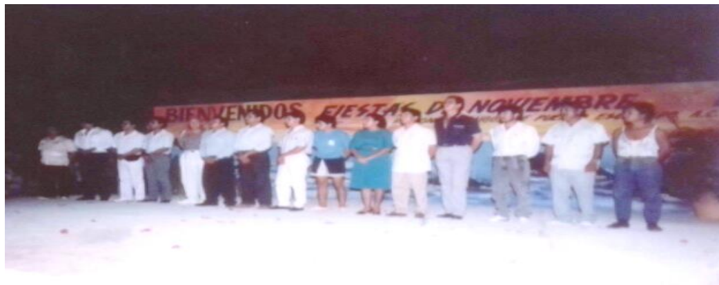
Fotografía 3: "Bienvenida a las fiestas de noviembre"

Los organizadores dan la más cordial bienvenida e inauguran las fiestas en Puerto Escondido.