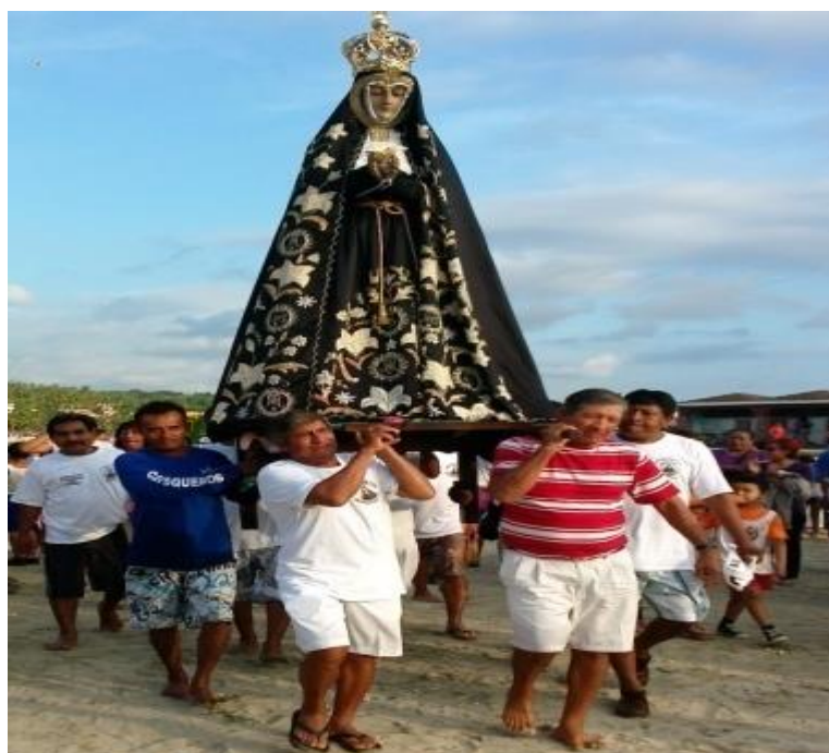
Fotografía 43: La fe del pescador

Solamente un lanchero puede estar parado de esta manera, ya que las olas del mar no permiten que ningún turista pueda imitarlo. 18 de diciembre de 2015.