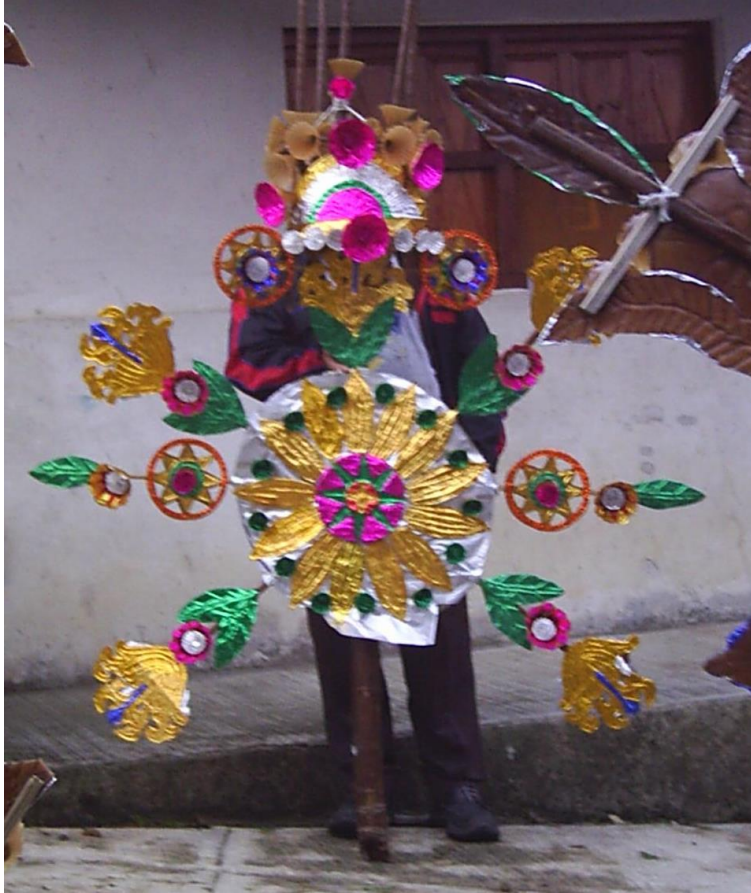
Ilustración 7 Cera de San Juan Bautista

A lo largo del día se realizan confirmaciones; por la noche hay juegos pirotécnicos (castillo y toritos) y el día finaliza con un baile en el auditorio municipal al que acude gran parte del pueblo. Al otro día, se lleva a cabo el juego del palo encebado y una misa. En 2005 el Ayuntamiento no cooperó para llevar los toritos y castillos porque alegaron no contaban con suficientes recursos.