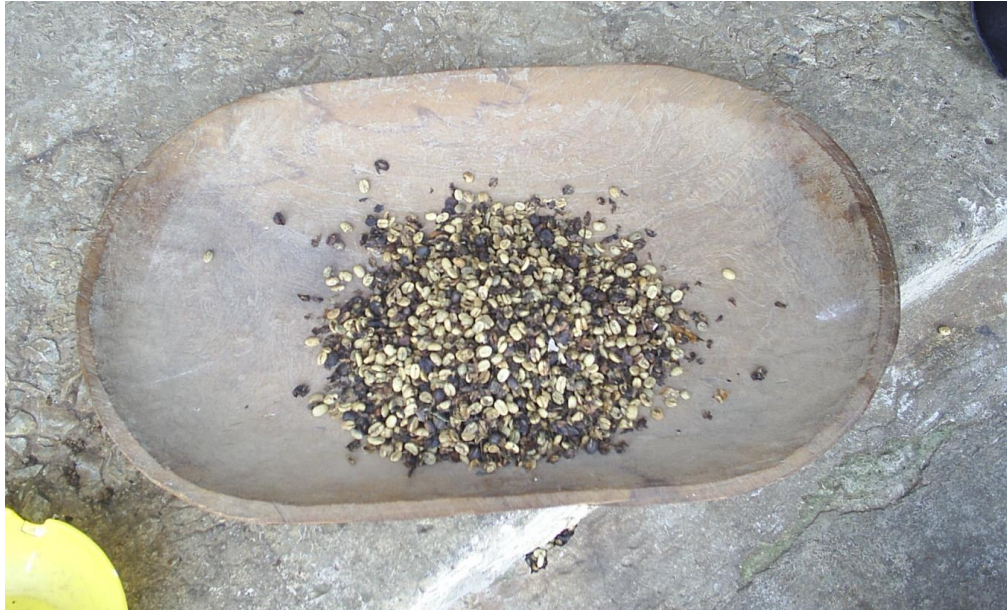
Ilustración 2 Café Pergamino

La siguiente actividad productiva en importancia es el cultivo de maíz, aunque generalmente poca gente se dedica a este producto. El trabajo del rancho se realiza en grupos familiares, la gente que siembra maíz lo hace en pequeñas cantidades y lo alterna con el frijol.