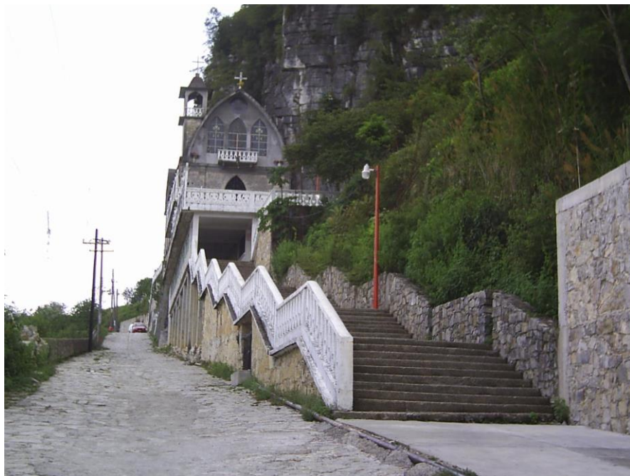
Ilustración 8 Santuario de la Virgen

Hay una similitud entre las dos fiestas en cuanto a los eventos que se realizan como las misas, la procesión, danzas, peregrinaciones, baile, juegos de básquetbol y en ocasiones también de fútbol, así como jaripeo etc. Pero algo en que sí se diferencian es la forma en que se organizan una y otra. Si bien es cierto en las dos hay comités, pero en la fiesta principal, la de la Virgen hay un comité permanente. Dicho comité está creado principalmente para la construcción y administración del Peñón y de su iglesia. Además el apoyo del Ayuntamiento durante la festividad de la Virgen también marca la diferencia al proveer de recursos para que sea más ostentosa.