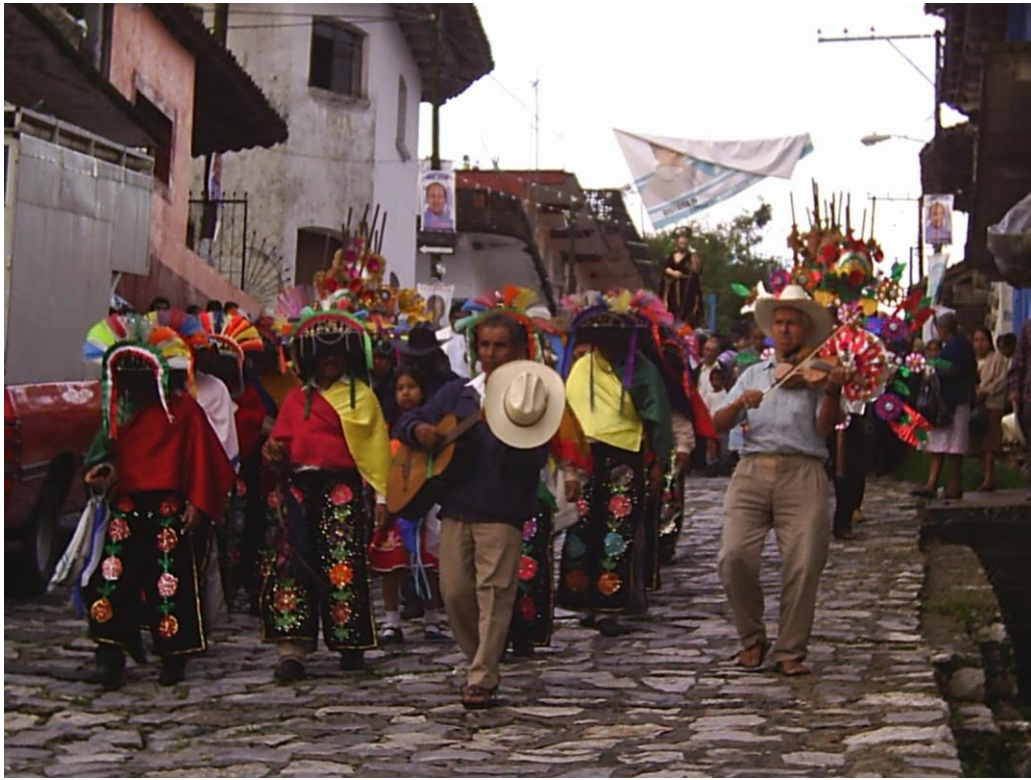
Ilustración 5 Acompañamiento de la procesión por los Negritos