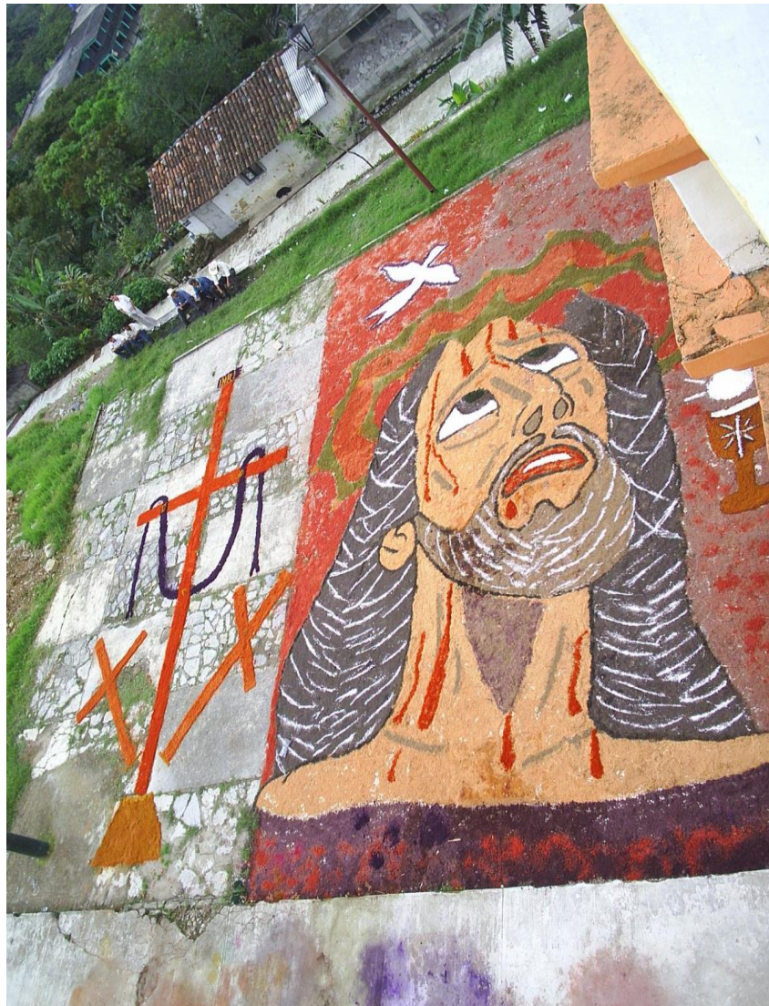
Ilustración 9 Imagen de aserrín

hombres cargan la cruz de madera. Al terminar el viacrucis el sacerdote va a la iglesia y realiza los oficios y el pésame a la Virgen.