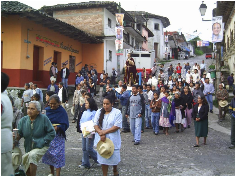
Ilustración 4 Procesión con el Santo Patrón

Ya para el 23 de junio se lleva a cabo una peregrinación que se conoce como “la de la cera”, esta se lleva acabo junto con la danza de los negritos y una imagen pequeña del Santo Patrón. También durante este día hay muchos niños que hacen su primera comunión, teniendo una pequeña celebración en sus respectivas casas. El 24 de junio muy temprano se entonan las mañanitas y hay una procesión por todo el pueblo, se realiza la danza de los Negritos y la danza de los Quetzales. Después sacan la imagen grande de San Juan Bautista y detrás de esta la imagen más chica del mismo santo. Un dato curioso es que, apenas en el 2005 sacaron a la imagen grande, esta decisión la tomaron todos los habitantes de la comunidad, los cuales fueron convocados en la iglesia, por el sacerdote. En ese momento se realizó un rosario para el santo, y así se le pidió permiso para sacarlo del templo; ya que las personas del pueblo tienen miedo a tocarlo y moverlo de lugar porque creen que si lo hacen el patron se va a molestar y por consecuencia habría una tempestad. Detrás de las imágenes van las ceras y finalmente toda la gente.