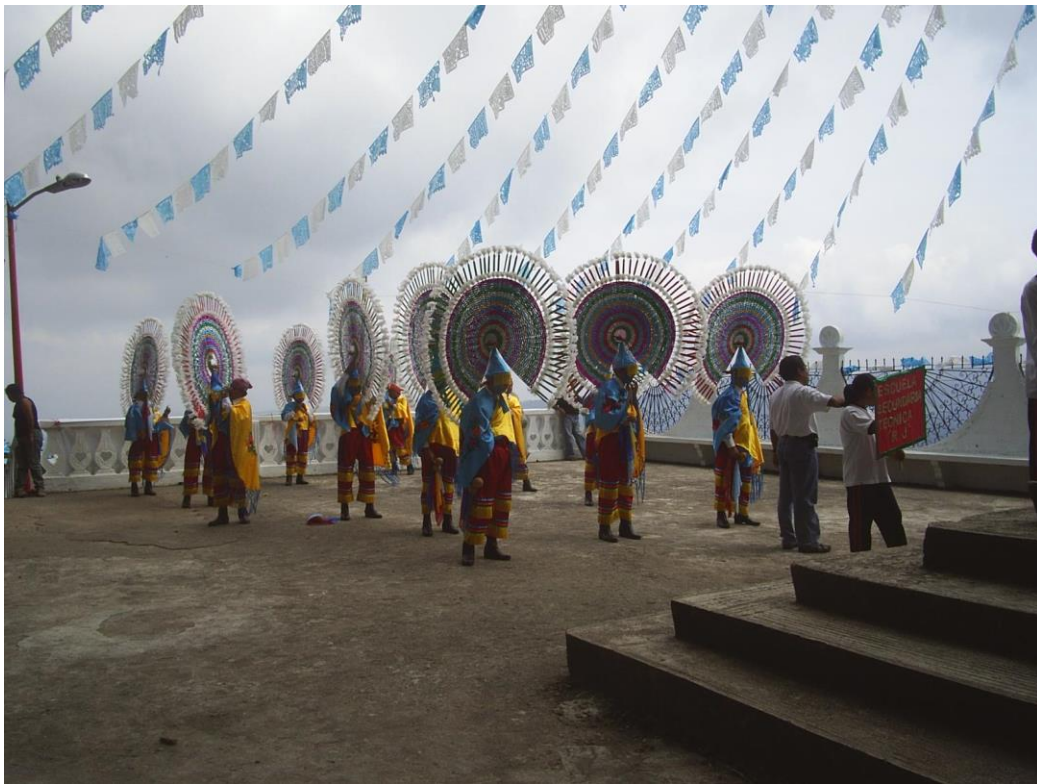
Ilustración 6 Danza de los Quetzales