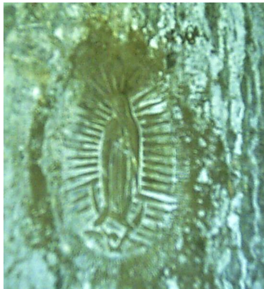
Ilustración 3 Imagen de la Virgen del Peñón