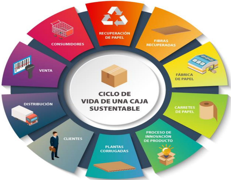
Imagen 3.2. Estructura circular de la empresa Grupak. (Grupak, 2019)

La economía circular en el caso de Grupak surge con la evolución e implantación de nuevas tecnologías, estrategias, buscando una mayor rentabilidad así como un ventaja competitiva sustentable para la fabricación de cartón para embalaje, donde antes de la década de los noventa la extracción de madera era sumamente caro y complicado por la normatividad de esta actividad, sin embargo con la aplicación e innovación para obtener materia prima de otro modo, surge la idea sobre la recolecta, tratamiento e innovación para volver a obtener carretes de cartón para producir cajas de embalaje (Grupak, 2019).