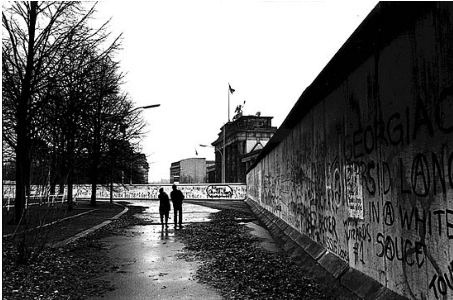
FOTO DEL MURO DE BERLÍN CONSTRUIDO EL 13 DE AGOSTO DE 1961

Fuente: Alemania en Castellano - 50 años de República, www.alemania-online-de/historia ,