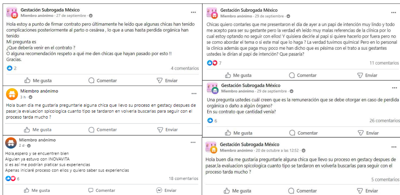
Figura 3. Publicaciones anónimas en el grupo de Facebook “Gestación Subrogada México”

El anonimato de estas publicaciones sugiere la importancia que tiene para las mujeres el cubrir sus identidades, ya sea como una forma de autocuidado mediante la cual buscan guardar su información personal y prevenir cualquier riesgo relacionado con la ilegalidad de la práctica, o como una forma de evitar juicios, señalamientos y acusaciones relacionadas con sus intereses en la subrogación o sus participaciones como “madres gestantes”. Tomando en cuenta el vínculo entre la presencia de las clínicas en las plataformas sociodigitales y la tendencia de las mujeres a