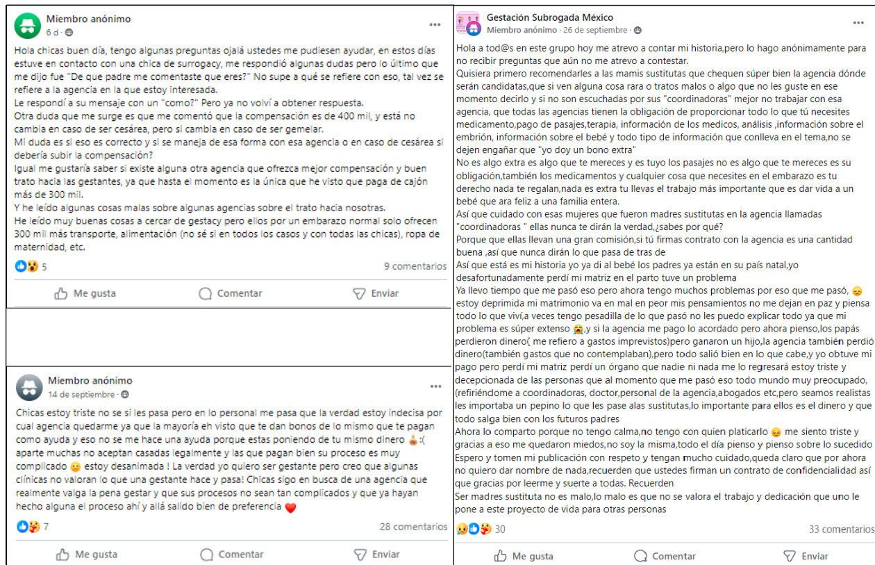
Figura 4. Publicaciones anónimas en el grupo de Facebook “Gestación Subrogada México”

El anonimato en este tipo de publicaciones sugiere que la comunicación, confianza y apoyo que brindan las clínicas a las mujeres no resulta efectiva, viable o clara, por lo que recurrir a las experiencias de otras mujeres que hayan pasado por un proceso similar resulta mucho más valioso, provechoso y relevante. Sin embargo, estas publicaciones también permiten señalar que el anonimato que surge como una forma de autocuidado ante el marco de ilegalidad y alegalidad en el que se encuentra la práctica y frente a las dinámicas de supervisión y vigilancia de la industria, crea cierta distancia entre “madres gestantes”, quienes a pesar de que coinciden e interactúan en espacios sociodigitales, lo hacen sin manifestar abiertamente quienes son, es decir, manteniéndose encubiertas.