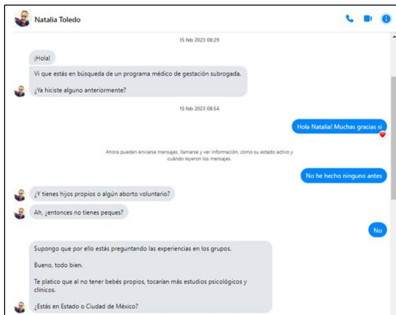
Figura 2. Captura de pantalla de mensajes privados de reclutadora de una clínica de subrogación

Estos mensajes ejemplifican las dinámicas de reclutamiento activo por parte de las clínicas y agencias intermediarias, así como las estrategias de observación y vigilancia que realizan en las plataformas sociodigitales para reclutar mujeres con el fin de que participen como gestantes. Es importante recordar que las trabajadoras de estas instancias que funcionan como agentes