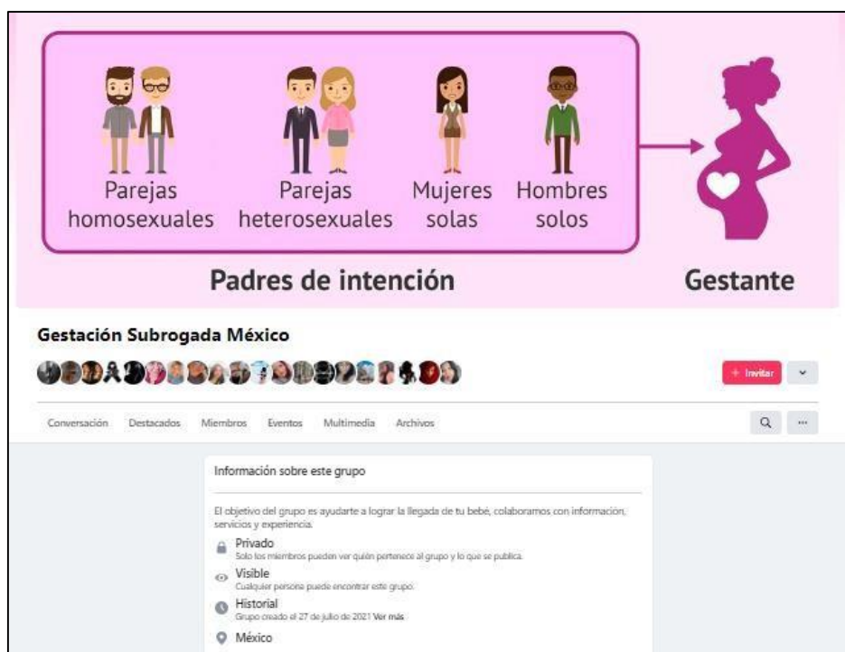
Figura 1. Captura de pantalla del grupo de Facebook “Gestación Subrogada México”

En este espacio surgen en promedio 116 publicaciones al mes por “madres gestantes”, mujeres interesadas en participar como gestantes, clínicas intermediarias, hombres y mujeres que buscan mujeres para alquilar sus vientres y donantes de óvulos. Durante mi inmersión en este espacio sociodigital observé las dinámicas del grupo e interactué en las publicaciones de las distintas participantes durante aproximadamente siete meses, de noviembre de 2022 a junio de 2023. Realicé