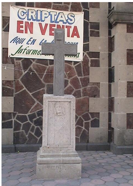
Ilustración 1: Cruz ubicada al costado derecho de la iglesia de San Juan Bautista. San Juan Nextipac, Mayo 2004