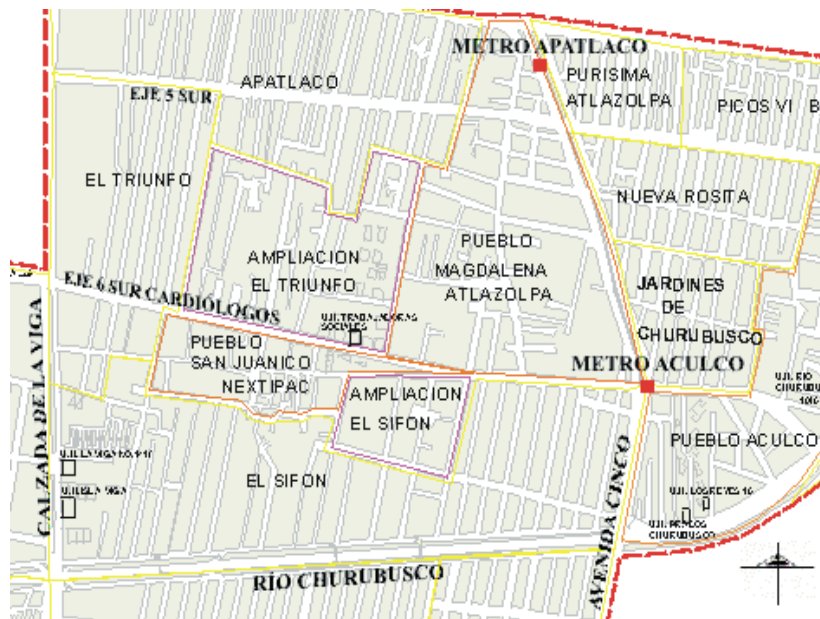
Mapa 2: San Juan Nextipac. Guía Roji, 2004

bueno, muchos terminaron vendiendo, otros han pelado y por ello no se abrieron muchas calles que están hasta Apatlaco, siguen siendo callejones, la gente les quiso dar valor impidiendo que pasaran o se abrieran calles (Coria, M: 2004) 11