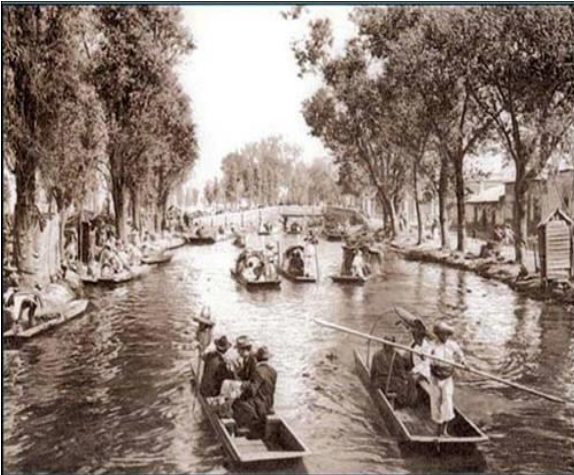
Ilustración 1: Habitantes de la región de Iztapalapa en canoas sobre el canal de Apatlaco, México 193

Se usaban las canoas principalmente para transportar las verduras que se obteníamos de la cosecha, tales como: zanahorias, perejil, nabo, lechuga, rábano, acelga, espinacas, chile, jitomate, tomate, col, poro, cebolla, y betabel. En cuanto a flores, aquí se cultivaba mucho la amapola, el imperial, la margarita, el tzempaxochitl, la espuela, el perrito y otras más. Los manojos que vendíamos estaban sujetos con una hierba que la llamábamos Tule y que salía de las mimas zanjias (Zaldivar, S 2004) 10 ,