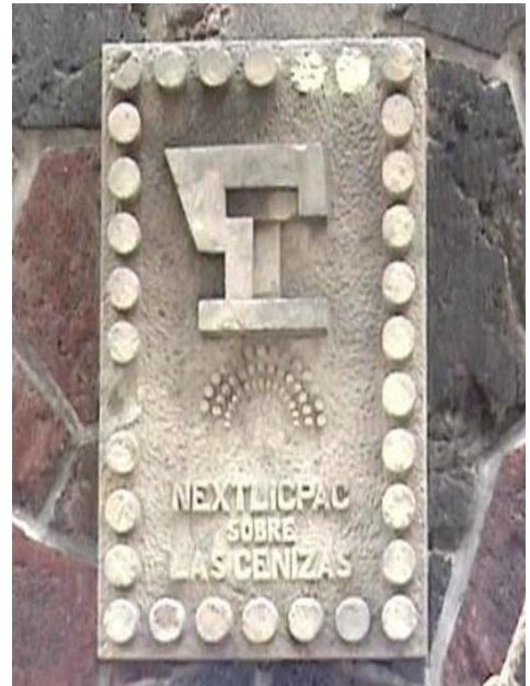
Ilustración 2: Glifo ubicado al costado izquierdo de la iglesia de San Juan Bautista. San Juan Nextipac, Mayo 2004

Lo anterior además de reflejar una separación interesante entre los tiempos de la ciudad y los del lugar, refleja también el proceso del cambio que se da cerca de la segunda mitad del siglo XX, concretamente los años setenta, tiempo en el que fue posible dar cuenta de la diversidad cultural en la zona metropolitana de la Ciudad de México y de la magnitud de cambios que en particular los pueblos de esta, como de otras zonas sufrieron debido al crecimiento y “modernización” de la misma. Ante esto, me pareció pertinente buscar y considerar algunos aspectos que hoy, por medio del pasado, dan forma a la denominación