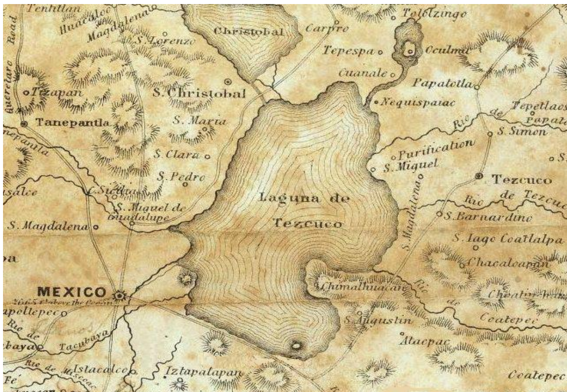
Mapa 0: Antiguo Nextipac año 1300.

El origen de San Juan Neztipac, según habitantes data aproximadamente del año 1300 antes de la llegada de los españoles al Valle de México, dicha región si observamos en el mapa 0 , era entonces un islote, una región de humedad considerable y de tierra propicia para el cultivo, dato que nos permite pensar el significado de la toponimia Náhuatl Nextli ( ceniza) e Icpac ( en lo alto, sobre) que en principio parece no tener mucho sentido para el lector, sin embargo atreviéndome a descifrar el significado, encuentro que desde la cosmovisión náhuatl este lugar en el que la tierra como madre es rodeada de líquido vital resultaba el sitio que permitiría germinar, no solo el alimento que nutriría a sus hombres y mujeres sino la propia vida. Sería el hogar en donde se consumiría el fuego de la guerra y en donde de las cenizas renacerían y sobre ellas descansarían sus hijos. 4