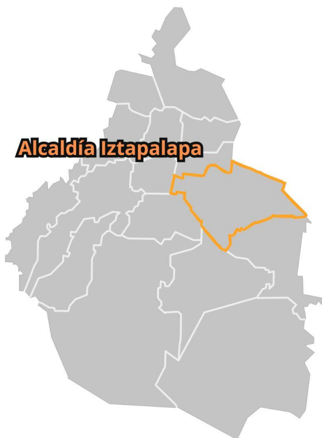
Ubicación Alcaldía Iztapalapa en CDMX. Creación propia.

Bárbara, San Miguel, San Antonio, San Lucas, San Ignacio, San Simón, San Pedro, La Asunción, San Pablo, San José y Tula (UNDOC, 2021)