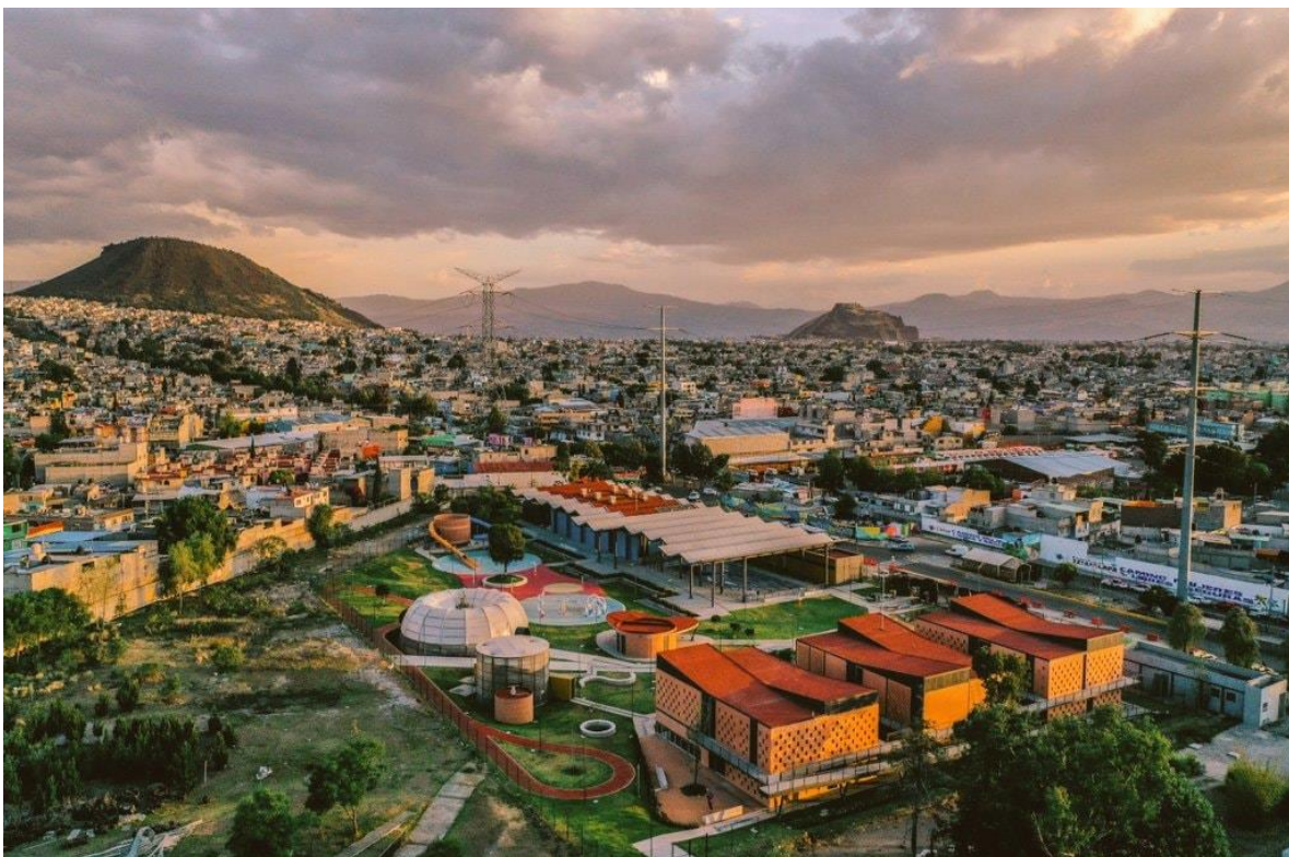
Vista Panorámica UTOPIA Papalotl (Brugada, 2021)

La UTOPIA Papalotl es la que más nos interesa, ya que en ella se encuentra Pohualizcalli: Escuela de Cine Comunitario y Fotografía. La UTOPIA Papalotl fue la tercer Utopía que abrió desde que empezó el proyecto de las utopías; esta fue abierta en el año 2019 y se ubica en Av. De las Torres, casi esquina con Ermita Iztapalapa, en la Colonia Reforma Política. Dicha Utopía cuenta con diferentes actividades y espacios tales como clases de natación, gimnasio al aire libre, clases de box, mariposario, orquideario, talleres de arte, clases de yoga, espacio acuático, salones de danza, trota pista, un auditorio y la escuela Pohualizcalli. Como se mencionó anteriormente, estos espacios son totalmente gratuitos, solo hace falta asistir y registrarse en las actividades de interés.