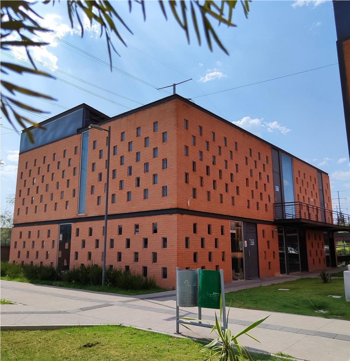
Edificio Escuela de Cine Comunitario y Fotografía Pohualizcalli.