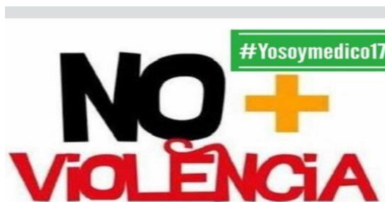
Imagen 0: Imagen del perfil en el mes de marzo de la página oficial del movimiento 24 .

Para realizar este proyecto se consideró a todos los miembros o participantes activos del movimiento social Yo SOY Medico #17 (enfermeras, radiólogos, camilleros, laboratoristas, médicos en medicina general, médicos especialistas en cirugía, personal administrativo, etcétera). La prioridad fue para aquellos que se encontraran activos en la página oficial de Facebook y que participaron en las marchas convocadas por este movimiento.